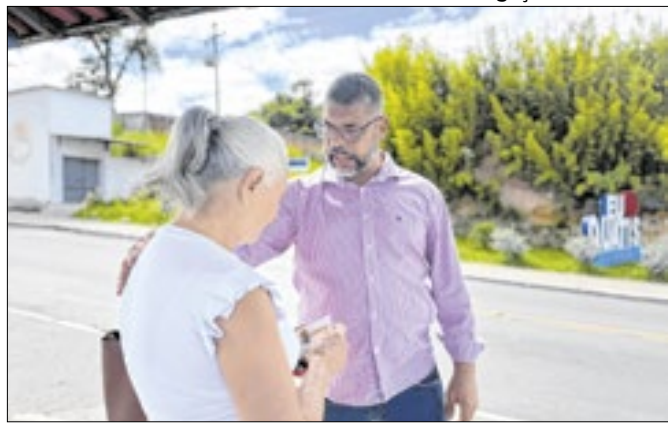
Grupamento atenderá Porto Real e o distrito de Floriano