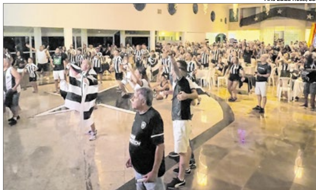
Jogo reuniu torcedores em várias cidades para assistir a final do campeonato