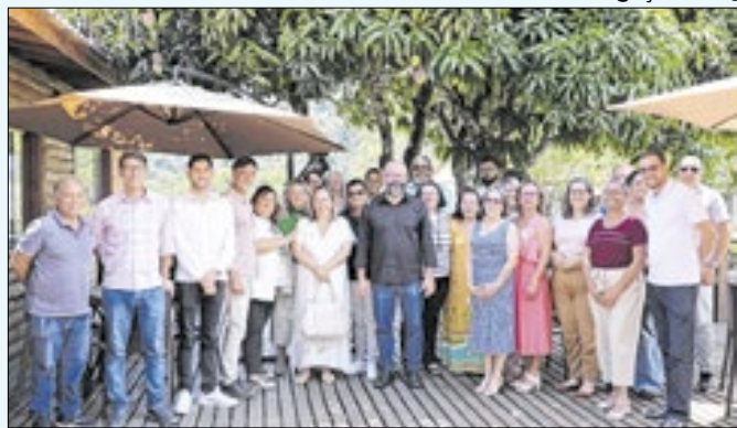
Cidades debateram sobre futuros projetos na saúde