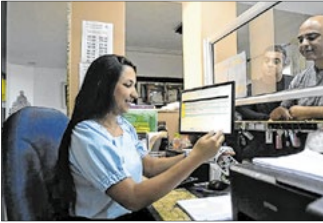
Município gerou 3.603 vagas formais de trabalho