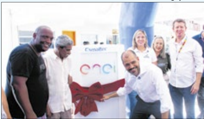
Geladeiras foram entregues aos moradores