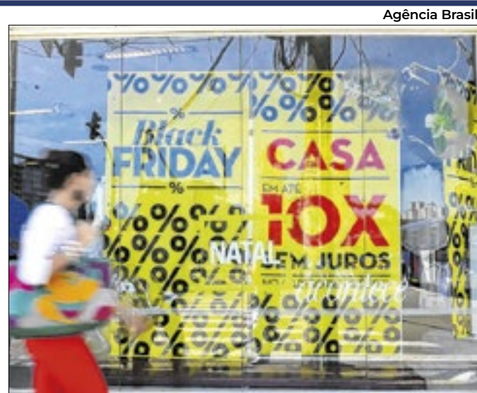
Vendas online de data em novembro surpreendem