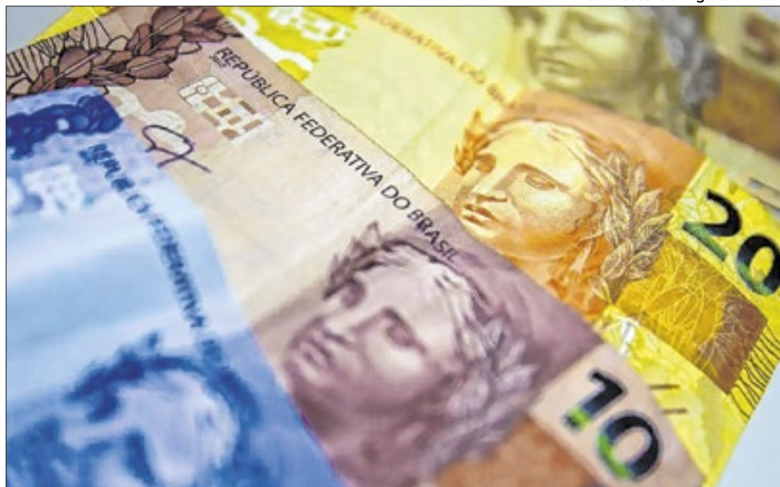
Populismo fiscal favoreceu imagem do Planalto, em detrimento de municípios

No entanto, para chegar ao montante exposto, a CNM considerou a perda de arrecadação do imposto retido na fonte dos servidores municipais, aposentados e pensionistas, o que acarretaria em um impacto fiscal anual estimado em R$ 9 bi-