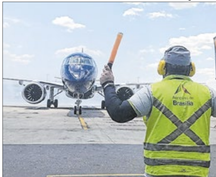
Riscos geopolíticos impõem turbulências às aéreas

A Associação Internacional de Transporte Aéreo (IATA, na sigla em inglês), que reúne mais de 320 linhas aéreas e habitualmente evita se pronunciar sobre temas políticos, aludiu à