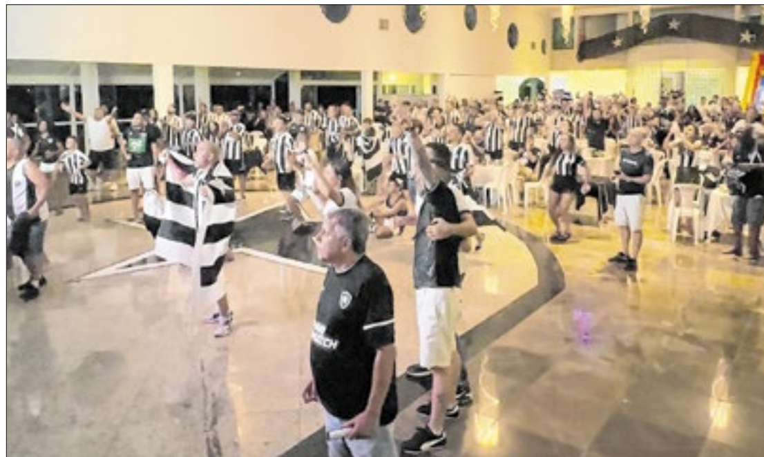
Jogo reuniu torcedores em várias cidades para assistir a final do campeonato