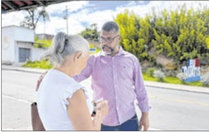
Grupamento atenderá Porto Real e o distrito de Floriano