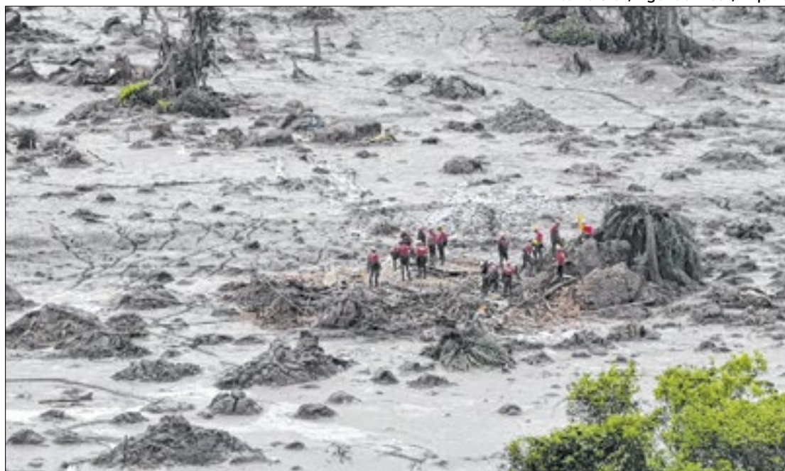
Comissão analisará repactuação do acordo judicial da tragédia em Mariana (MG)

Em nota, a Samarco declarou: “Com o acordo de repactuação, homologado por unanimidade pelo Supremo Tribunal Federal (STF), em 6 de novembro deste ano, a Samarco reforça seu compromisso com a reparação e compensação integral e definitiva dos danos causados às pessoas, comu-