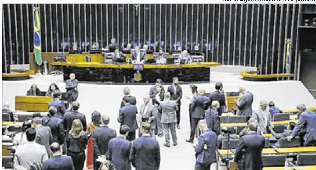
Câmara deve discutir dívidas dos estados nesta semana

Todas as comissões permanentes podem oferecer emendas coletivas à proposta orçamentária. São 17 colegiados do Senado, 30 da Câmara dos Deputados e cinco do Congresso Nacional, fora as Mesas Diretoras do Senado e da Câmara. Cada colegiado pode propor até oito emendas, sendo quatro de apropriação e quatro de remanejamento.