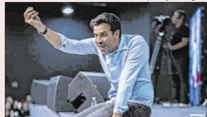
Pablo Marçal propaga a lógica do empreendedor