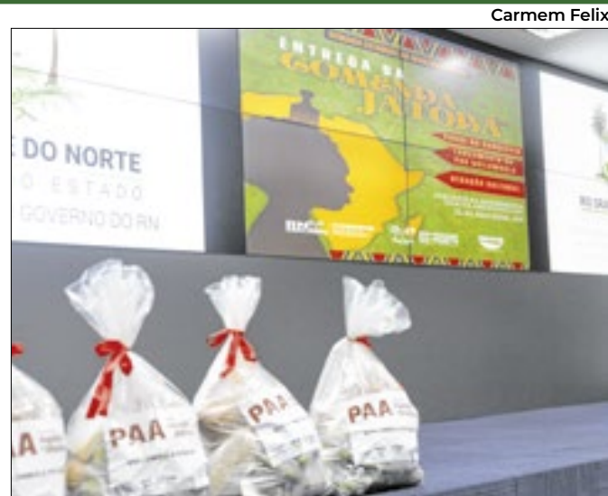
Governo do RN empossa nova diretoria

O prêmio reconhece as conquistas do Piauí na área digital