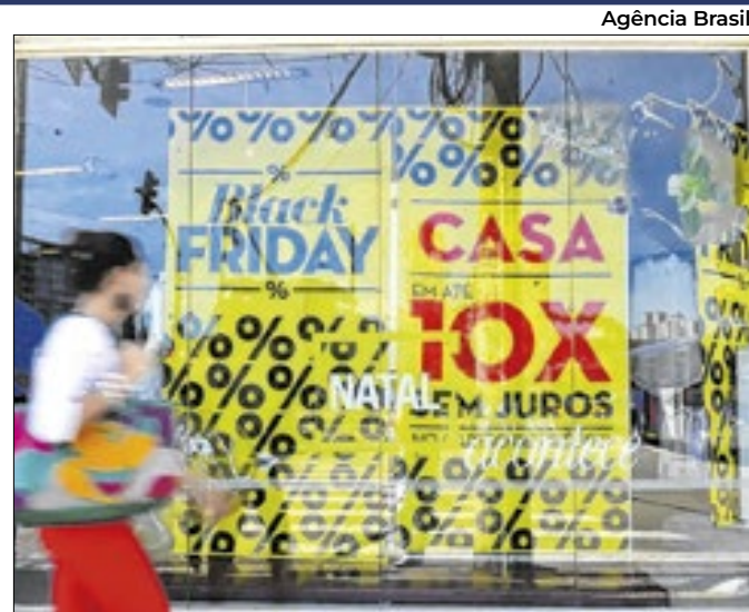
Vendas online de data em novembro surpreendem