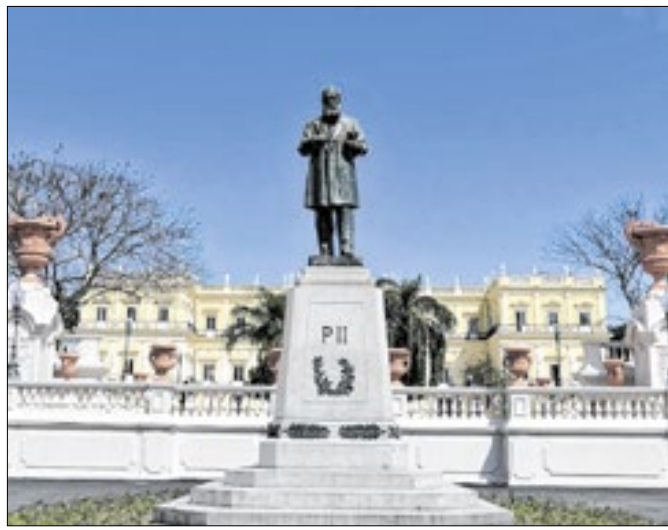
Museu Nacional, localizado na Quinta da Boa Vista