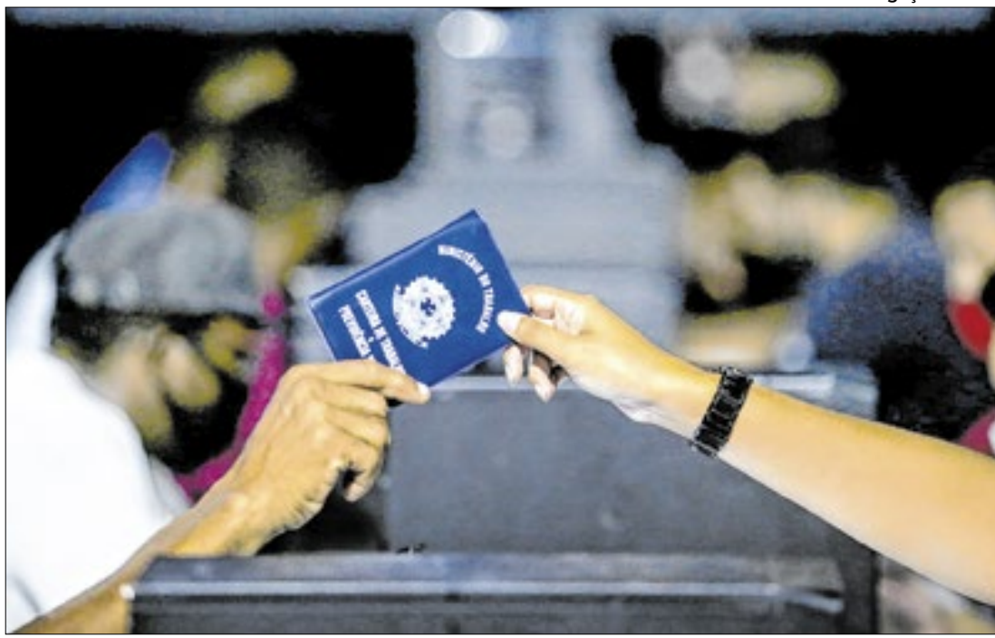
Com 162.486 empregos formais criados nos últimos 12 meses, Estado Rio de Janeiro se mantém na segunda colocação no ranking nacional

mica Federal. O processo licitatório, conduzido pelo sistema de pregão eletrônico, foi vencido pela empresa TEVX Motors Group, representante da marca chinesa Higher. A Prefeitura conduziu uma série de testes operacionais com diferentes modelos de ônibus elétricos.