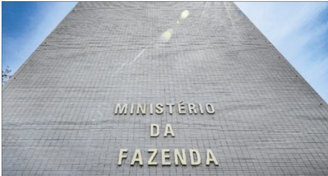
Mudanças da Fazenda podem alterar Tesouro Nacional