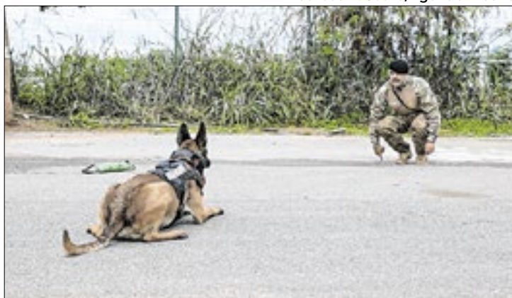
Cães são treinados para identificar odores em operações