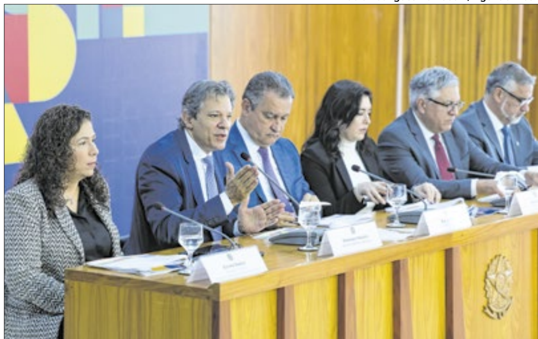
A entrevista coletiva foi realizada às 8h no Palácio do Planalto

Sendo que, as mudanças incluídas na PEC resultarão em uma economia prevista de R$ 11,1 bilhões em 2025; R$ 13,4 bilhões em 2026; R$ 16,9 bilhões em 2027; R$ 20,7 bilhões em