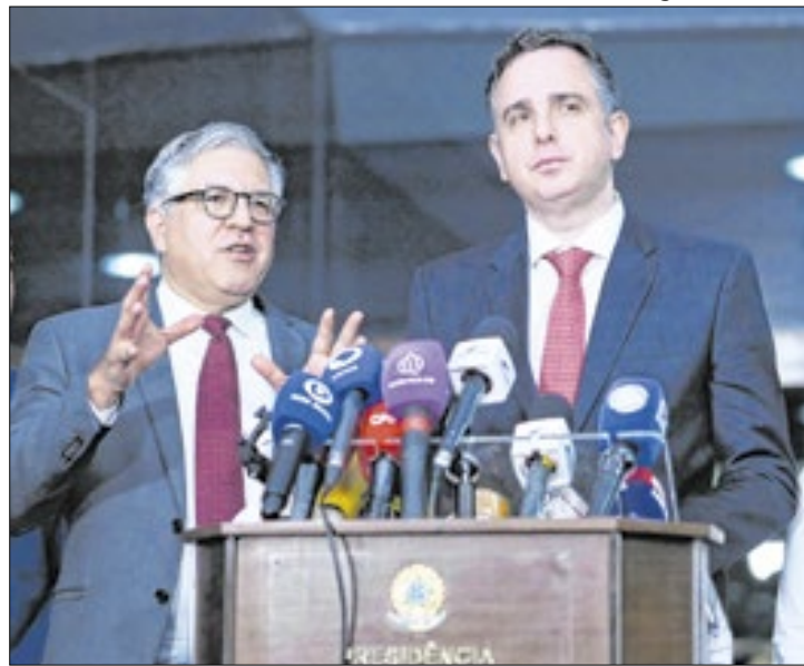
Senado fará esforço concentrado para aprovar projeto

Pacheco ainda reiterou que relator do projeto, senador Eduardo Braga (MDB-AM), e o presidente da Comissão de Constituição e Justiça (CCJ) da Casa, senador Davi Alcolumbre (União-AP), se comprometeram a votar o projeto de lei