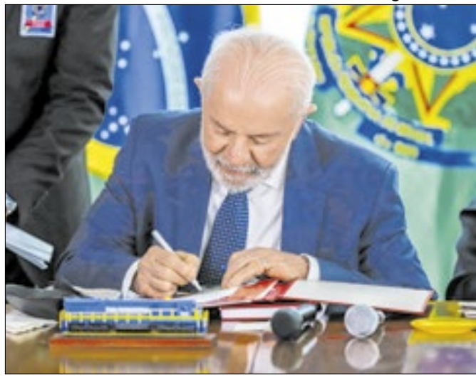
Lei foi sancionada pelo presidente Lula nesta quinta