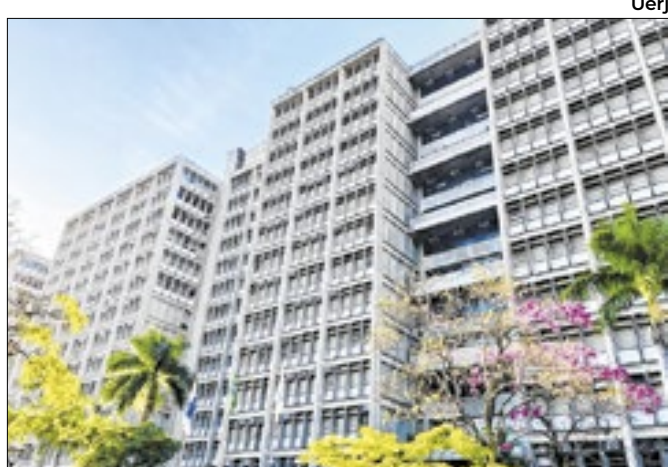
À Uerj não restou outra alternativa que a suspensão