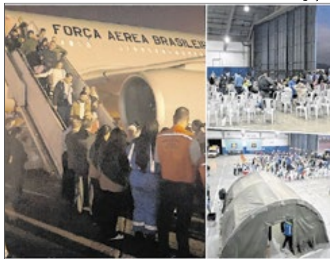
Passageiros receberam atendimento médico do SUS