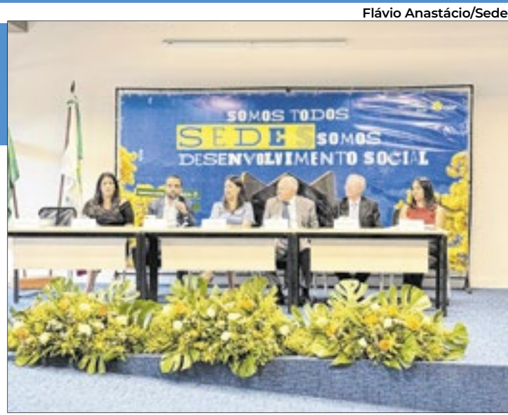
A unidade Imigrantes é o 14º Centro de Referência Especializado de Assistência Social da capital

Diferentemente do Centro de Referência de Assistência Social (Cras), que foca na prevenção, o atendimento nos Creas não é agendado pelo 156 ou site. O público-alvo dessas unidades são pessoas vítimas de violações de direitos, como