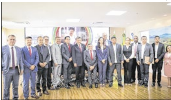
O gestor esteve acompanhado de líderes de municípios