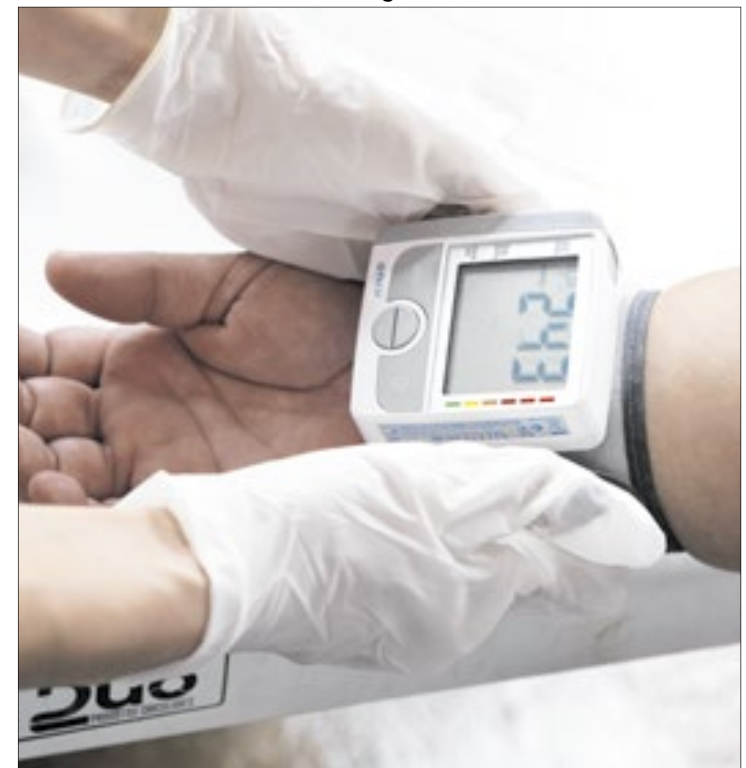
Insuficiência cardíaca lidera o casos de internações no DF