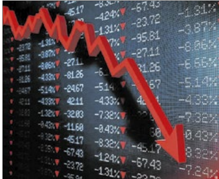
Bolsa amarga baixa de 1,73%, à espera do pacote fiscal

A tarde foi marcada também por pressão no câmbio, com dólar a R$ 5,9289 na máxima intradia, e acentuação de