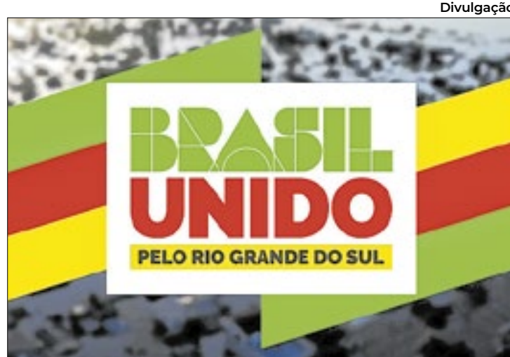
Ajuda é ainda pelas enchentes no estado deste ano

Em novembro, o MTE realizou o último pagamento aos trabalhadores formais, menores aprendizes, empregados domésticos e pescadores que recebe-