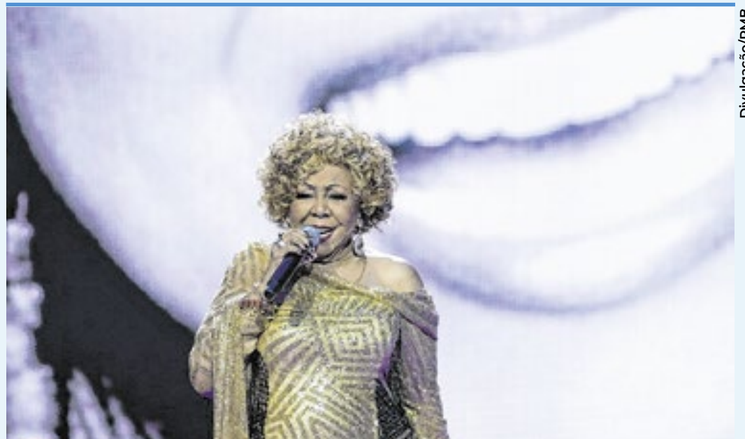
Alcione no palco do Municipal durante o show em sua homenagem no PMB 2023