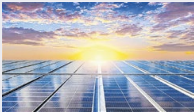
Energia solar já é a 2ª da matriz elétrica nacional