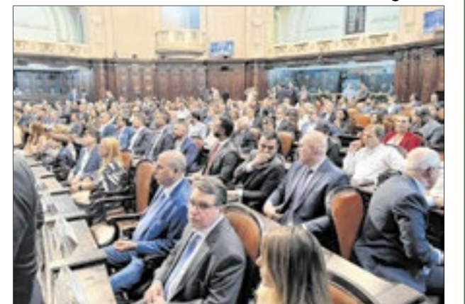
Plenário Barbosa Lima Sobrinho lotado para a homenagem ao secretário da Casa Civil do RJ