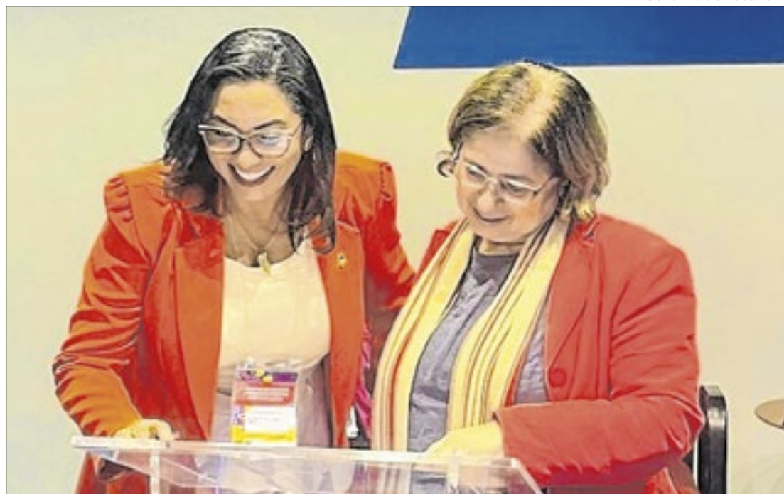
A secretária de Estado da Mulher assina os Acordos de Cooperação

O ACT do Feminicídio Zero visa fortalecer as políticas públicas de prevenção ao feminicídio e à violência doméstica em todo o Brasil. A iniciativa contempla a criação de um Plano de Ações alinhado ao Pacto Nacional de Prevenção aos Femicídios, estabelecido pelo Decreto nº 11.640/2023. O pacto busca implementar ações concretas para reduzir os índices de feminicídios, incluindo a criação de indicadores e comitês gestores estaduais para monitoramento das ações. Além disso, o pacto prevê a elaboração de relatórios periódicos sobre a implementação e os resultados das medidas.