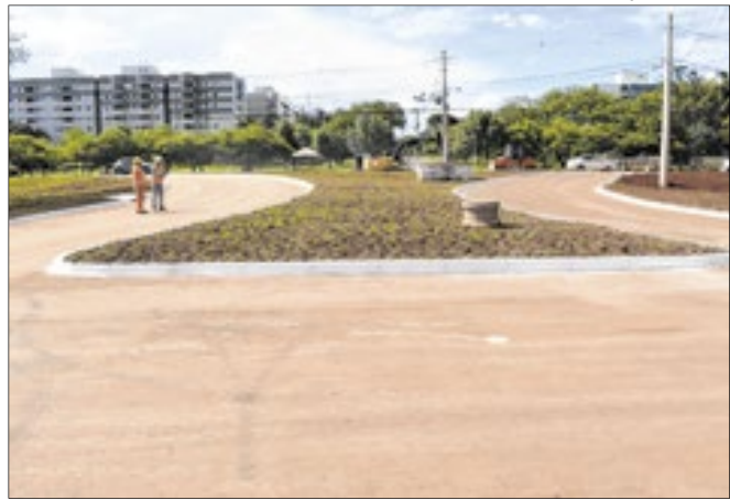
O novo acesso ao Parque da Cidade servirá para desafogar as pistas internas