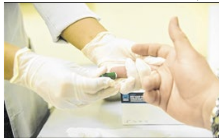
As atividades buscam conscientizar sobre a prevenção