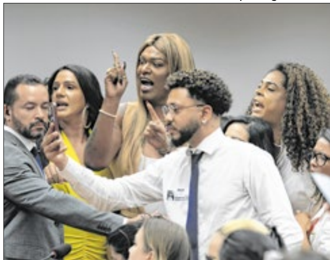
Manifestantes tomaram o plenário da comissão