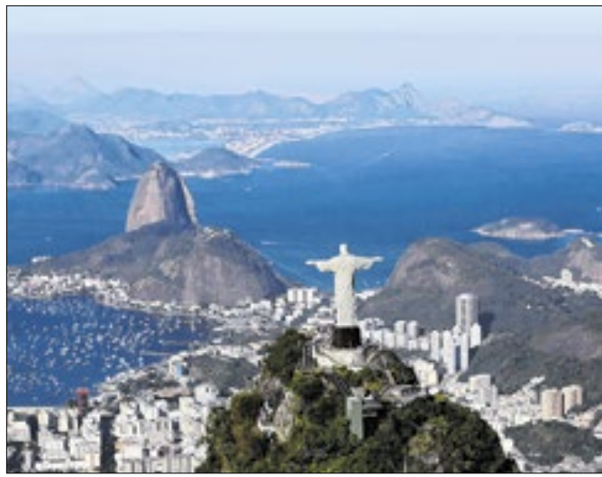
Rio teve terceiro melhor índice no ranking das capitais