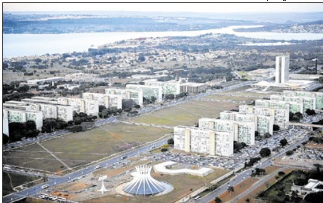
Enquanto receita subiu 3,4%, despesas saltaram 13,2%, no comparativo 2023/2022

Diferentemente, entre as despesas, a expansão foi verifi-