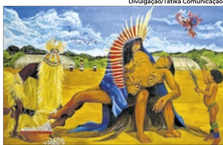
Tela “É Tempo de Kuarup - A Cura”, de Vinícius Vaz

sil Não Conta”, o artista apresenta 16 pinturas que revelam personagens e temas muitas vezes ausentes dos livros de