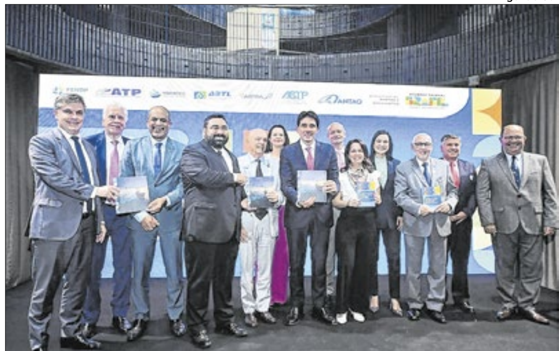
Também foi anunciada a inclusão das concessões de hidrovias na estratégia do Ministério.

O ministro também destacou o crescimento de 6% do setor portuário neste ano de