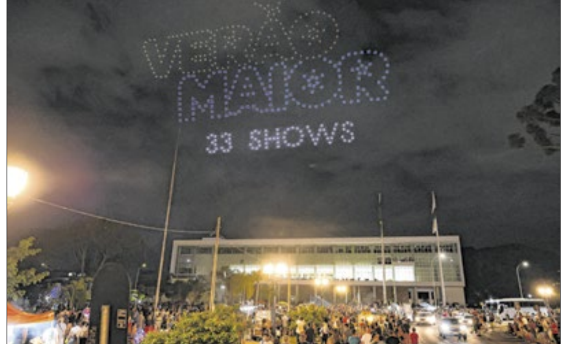
Rodrigo Felix Leal/SEIL

“É um orgulho que o Paraná esteja definitivamente na rota do turismo de verão. Como um todo, já somos um dos estados que mais cresce no turismo, mas especialmente neste momento do ano, em que temos