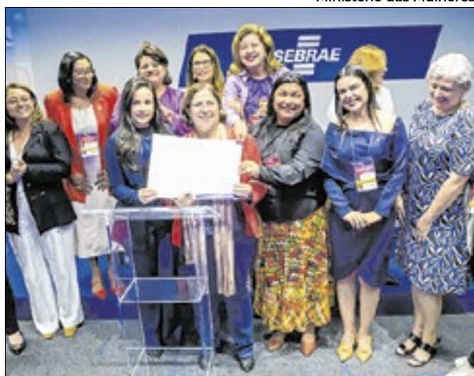
Plano Estadual de Prevenção aos Femicídios