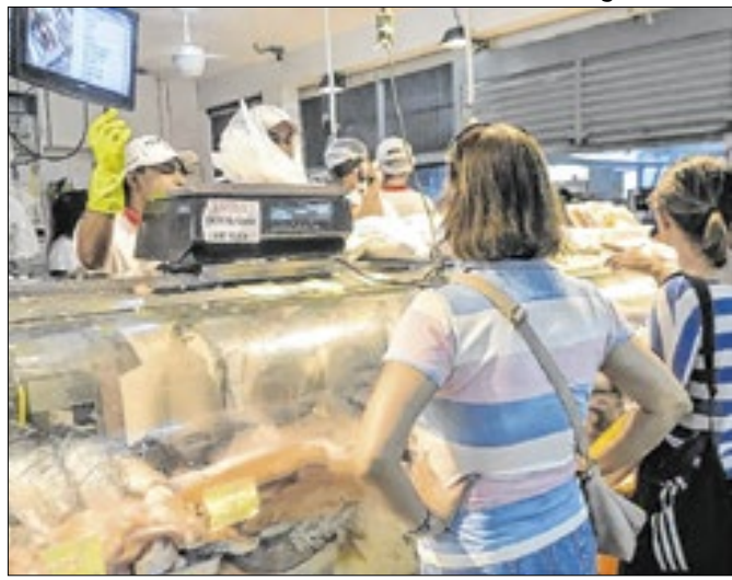
Expectativa positiva da economia levou à 2ª alta seguida