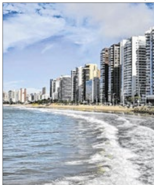
Os números estão no Enfoque Econômico