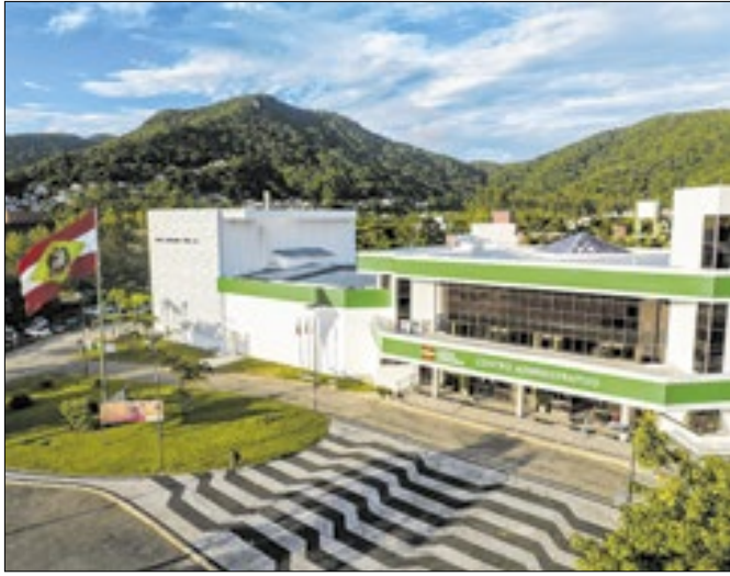
Economia terá injeção de R$ 2,7 bilhões