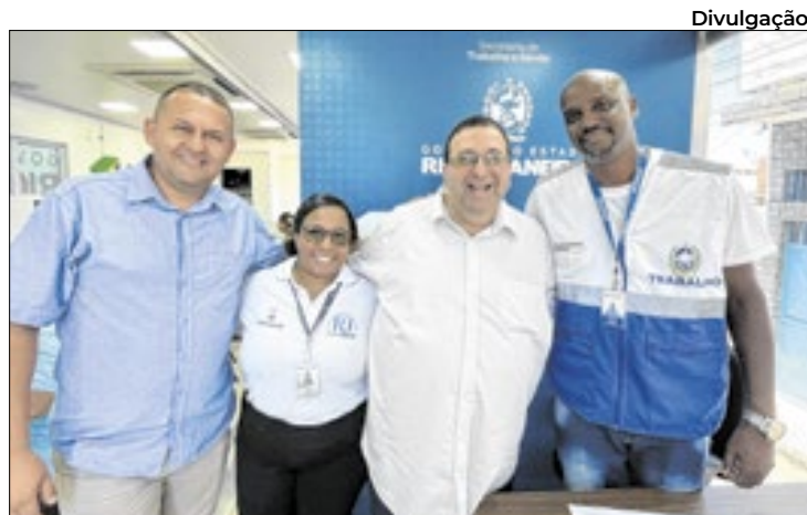
Divulgação A ação social está percorrendo vários municípios

Entre os serviços ofertados, estão emissão de primeira e segunda via do RG, isenções para certidão de nascimento, casamento, óbito e habilitação