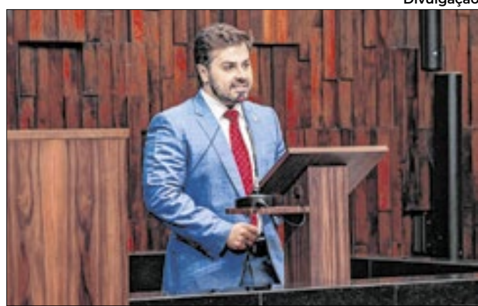
Deputado destinou R$ 112.815,00 em emenda parlamentar