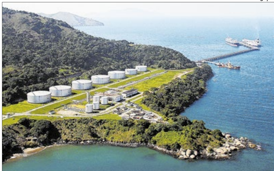
Divulgação Segundo o Corpo de Bombeiros, o acidente envolveu cinco trabalhadores

Em nota, a Transpetro lamentou o acidente e informou que os "trabalhadores foram atendidos imediatamente pelas equipes médicas, mas infelizmente não resistiram". Outro trabalhador, que também estava no local, recebeu atendimento médico e foi encaminhado a um hospital da região, com estado de saúde estável. A Transpetro, juntamente com a Olicampo, está prestando todo apoio aos familiares, segundo a nota da empresa, que irá instaurar uma comissão para apurar as