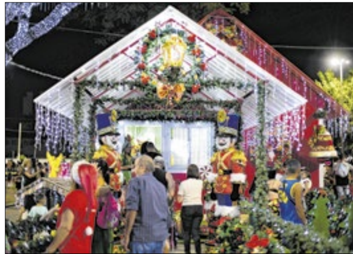
Programação contará com novidades na decoração

Volta Redonda está na contagem regressiva para a abertura oficial do “Natal da Cidadania”, que acontecerá no dia 30 de novembro (sábado), na Praça Brasil, na Vila Santa Cecília, a partir das 18h30. São esperados cerca de 50 mil visitantes durante o período da programação natalina na cidade, que vai até o dia 23 de dezembro. A tradicional Casinha do Papai Noel já está sendo montada e muitas novidades estão previstas para este ano, com show musical, entrega de presentes para as crianças, e decoração inédita, incluindo uma réplica de cerejeira no estilo japonesa com aproximadamente 11 metros de altura.