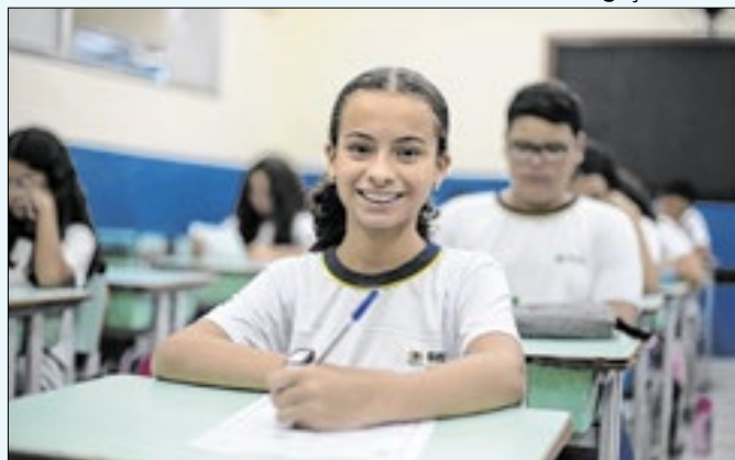
Ação será viabilizada por um programa do Governo Federal