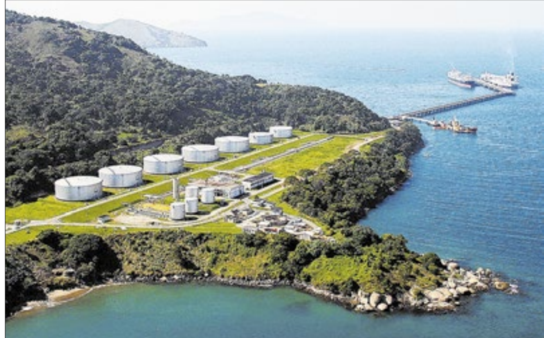
Segundo o Corpo de Bombeiros, o acidente envolveu cinco trabalhadores

Em seu site, o Sindicato dos Petroleiros do Rio de Janeiro (Sindicato RJ) também divulgou nota e afirmou