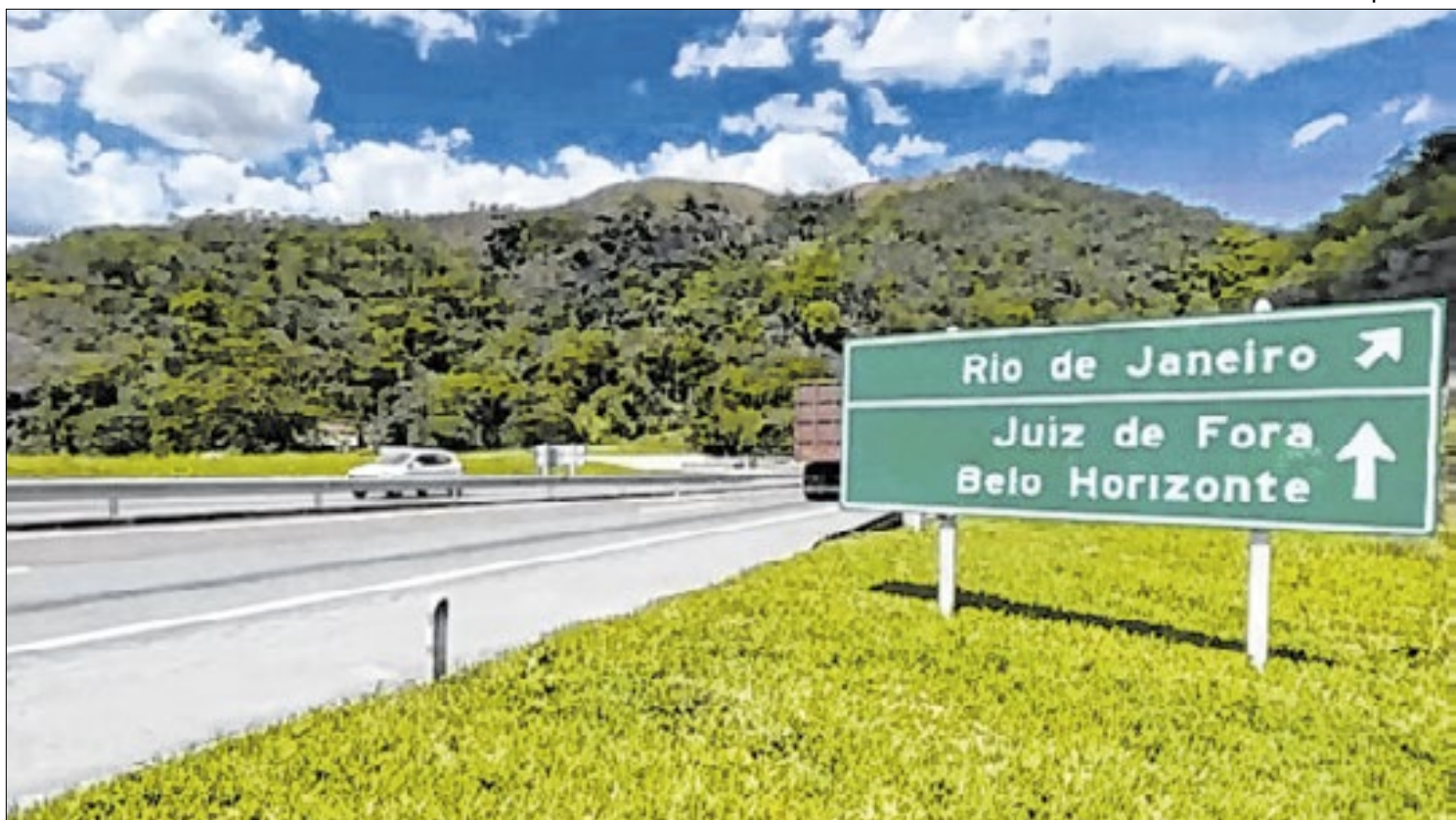
Rodovia é a principal ligação entre os estados do Rio de Janeiro (Rio de Janeiro) e Minas Gerais (Juiz de Fora)