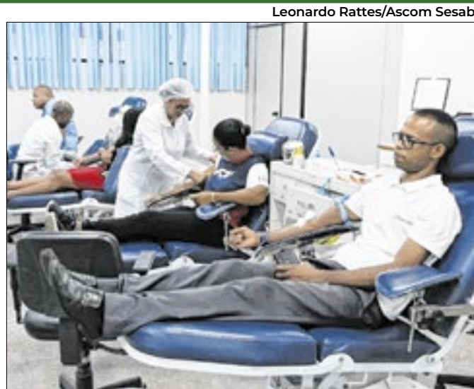
Leonardo Rattes/Ascom Sesab

Estado sedia Encontro de Gestores Federais e Estaduais