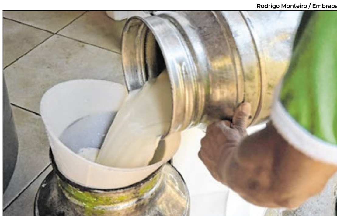
Rodrigo Monteiro / Embrapa

Nos dias 28 e 29 de novembro, o Centro de Eventos do Ceará receberá a Cúpula Mundial sobre Transição Energética (WSoET), promovida pelo Winds for Future e co-organizada pelo Governo do Ceará. O evento reunirá especialistas e autoridades para discutir o futuro energético sustentável.