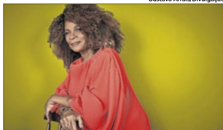
A homenagem valoriza trajetórias do cinema brasileiro