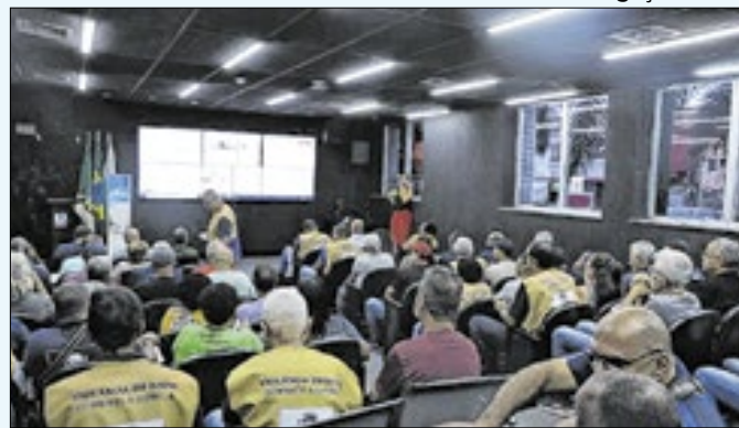
Evento pôs em pauta o combate na proliferação do vírus