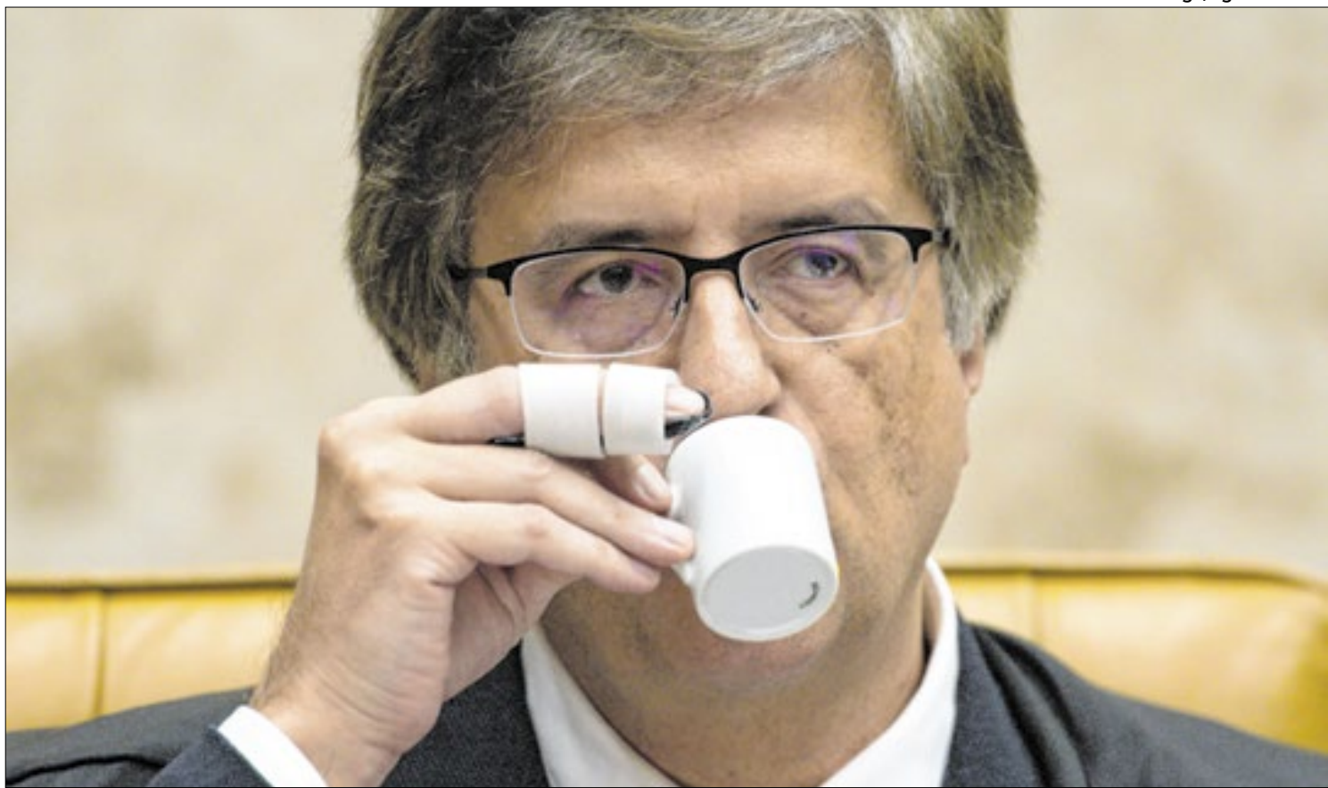
Gonet terá a responsabilidade de decidir se os indiciados serão denunciados ou não

a decisão, demonstrando interferência direta na jurisdição da Corte. Para o ministro, permitir essa atitude levaria ao esvaziamento da competência do STF. "Estariamos a permitir que um órgão jurisdicionalmente inferior a esta Corte frustrasse as competências próprias do STF", afirmou. O ministro Gilmar Mendes ressaltou ainda que sua decisão não envolve o mérito do debate sobre a constitucionalidade do modelo das escolas cívico-militares. Este julgamento será feito em momento oportuno.