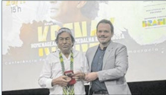
Líder indígena, Ailton Krenak mereceu homenagem