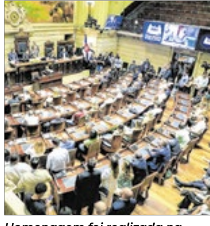
Homenagem foi realizada na noite da última segunda-feira, 25 de novembro, na Câmara Municipal do Rio

-dama do estado, os secretários de estado do Turismo, Segurança Pública, Polícia Militar, Polícia Civil, Saúde, Corpo de Bombeiros, Casa Civil, o Secretário de Saúde da prefeitura do