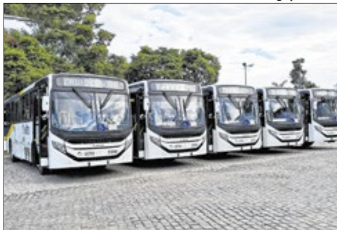
Veículos ficaram impossibilitados de circular de manhã