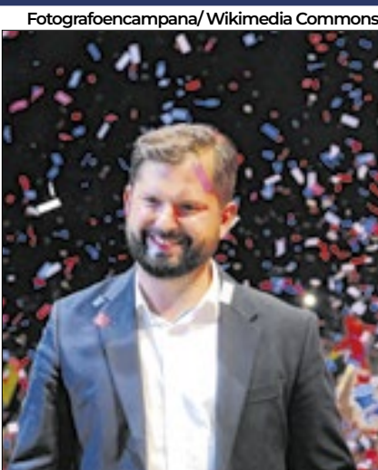
Boric foi acusado de assédio sexual

O presidente do Chile, Gabriel Boric, é alvo de uma denúncia de assédio sexual que está em investigação no Ministério Público do país. O líder "nega categoricamente" ter cometido qualquer crime.