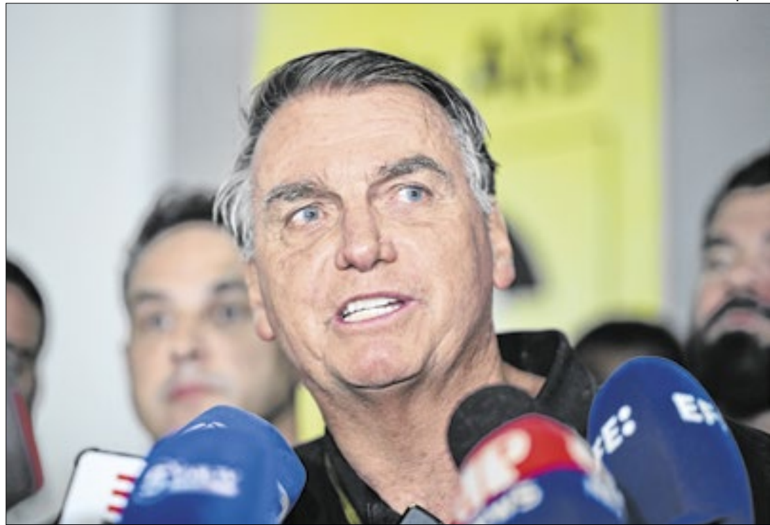
Em coletiva, Bolsonaro alegou ter "zero conhecimento" sobre trama de golpe

A expectativa é que, caso a PGR opte por realizar as denúncias, o julgamento poderá ser conduzido pela Primeira Turma do STF. O colegiado é composto por Moraes e pelos ministros Flávio Dino, Cármen