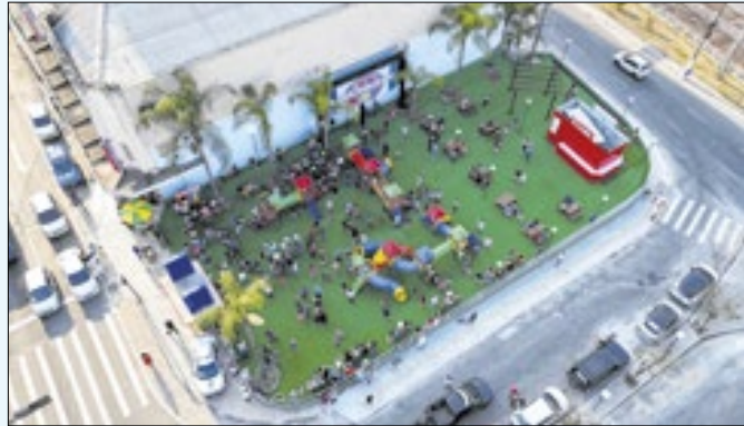
Evento contará com brinquedos e área de food trucks