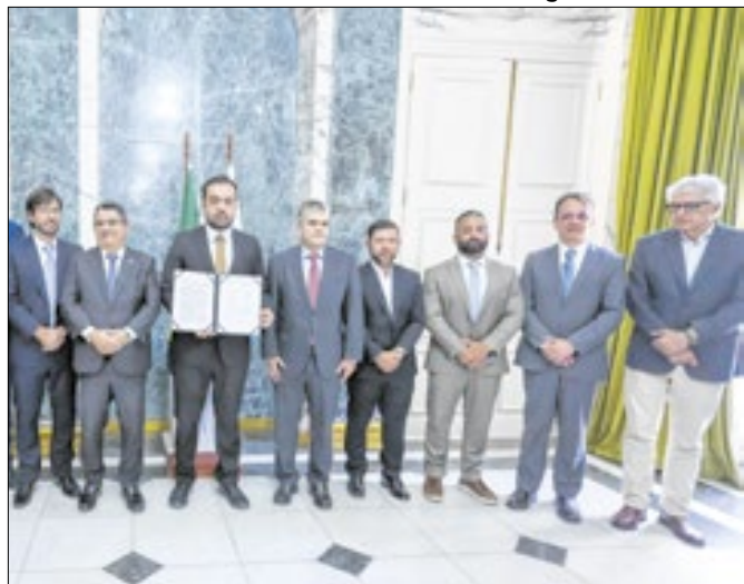
Assinatura de acordo judicial com a Supervia