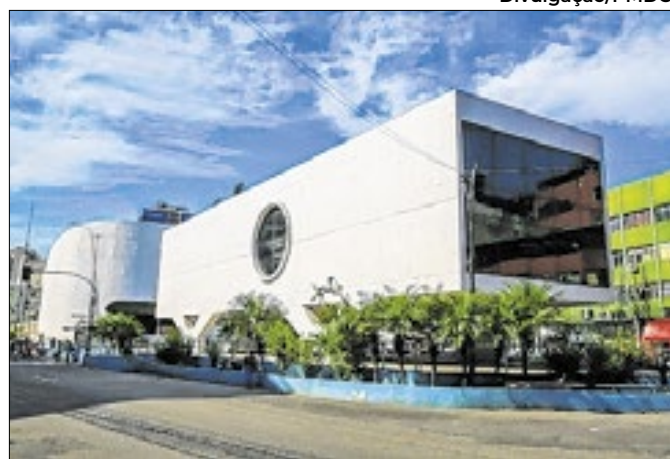
Biblioteca celebra aniversário com programação