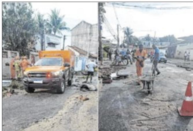
Tragédia vitimou idosa e interditou rua em Rocha Miranda