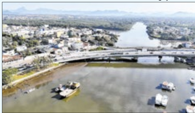
Codin levará estrutura técnica para Macaé