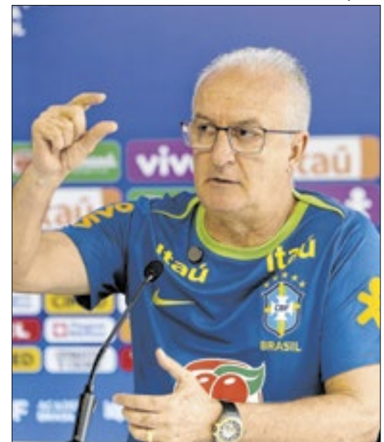
Dorival quer menos ‘gringos’ no Brasileirão