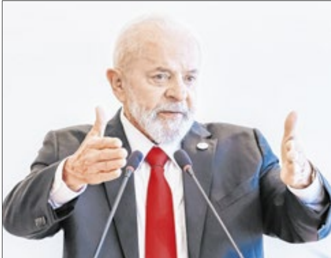
Proposta atende a pedido do ministro Flávio Dino