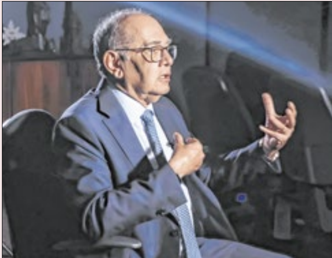
Decisão do ministro será levada a referendo do Plenário