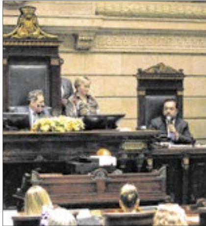
Em seu discurso, o governador Cláudio Castro não mediu suas palavras para elogiar o seu subsecretário