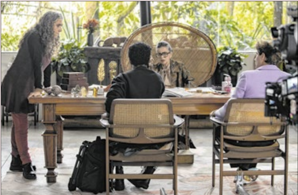
‘O Clube Das Mulheres De Negócios’ é umas das estreias nacionais da semana