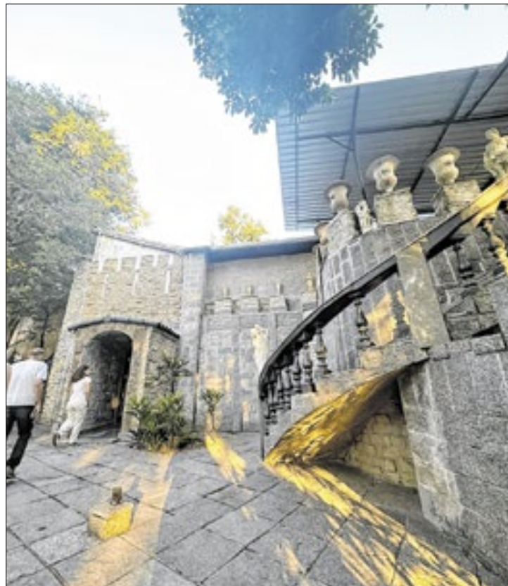
Museu Multitemático em Barra Mansa foi um dos destaques

Uma das parcerias mais relevantes do Correio na editoria cultural é o Teatro Gacemss, localizado em Volta Redonda. Tendo se firmado