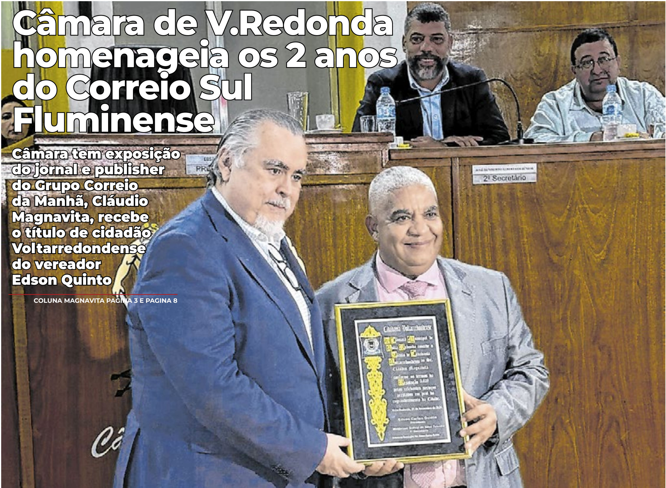
Ana Luiza Rossi/CSF