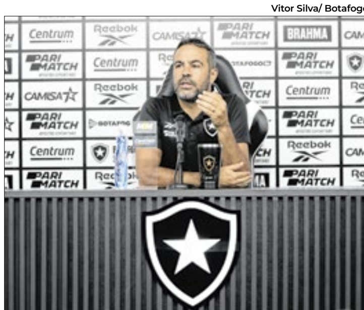
Artur Jorge mandou um recado direto para o Atlético-MG

"Nós tivemos o goleiro do Atlético-MG (Everson), no final, que veio falar que a equipe do Botafogo queria confusão e eu vou responder dizendo que inadmissível é que um jogador tenha chutado a bola na cara do Tiquinho. Isso é fazer confusão. O Hulk no final falou sobre um jogador meu. Hulk que eu muito respeito, mas se preocupou com as palavras de um jogador por ter dito alguma coisa ao adversário. Acho que é de pior tom, quando nós pegamos um jogador da pró-