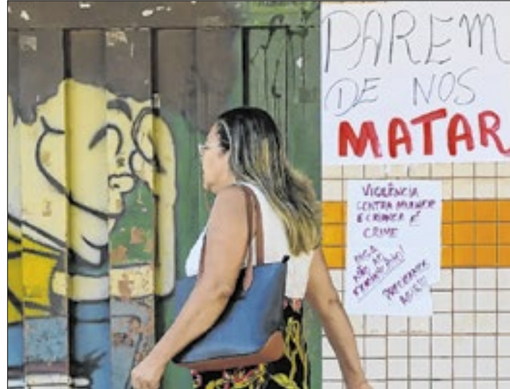
No Brasil, as estatísticas continuam alarmantes

controle excessivo; violência moral: difamação, calúnia ou qualquer tentativa de manchar a reputação da mulher; violência sexual: atos sexuais forçados ou qualquer forma de coerção; e violência patrimonial: controle ou destruição de bens materiais, documentos e valores da vítima.