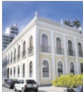
Palácio Barão de Guapi