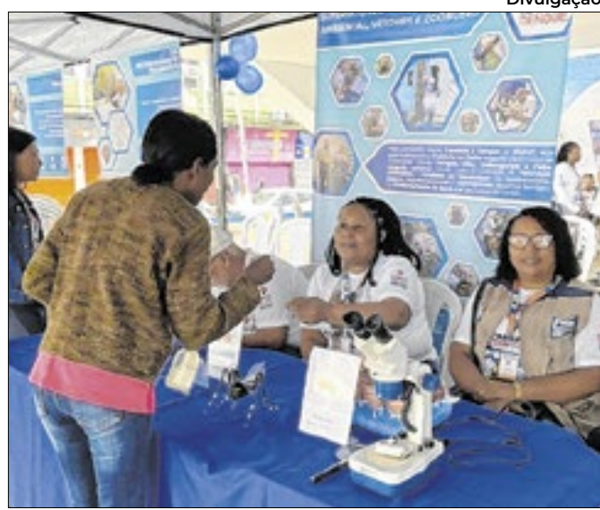
Caxias entra na mobilização contra a dengue