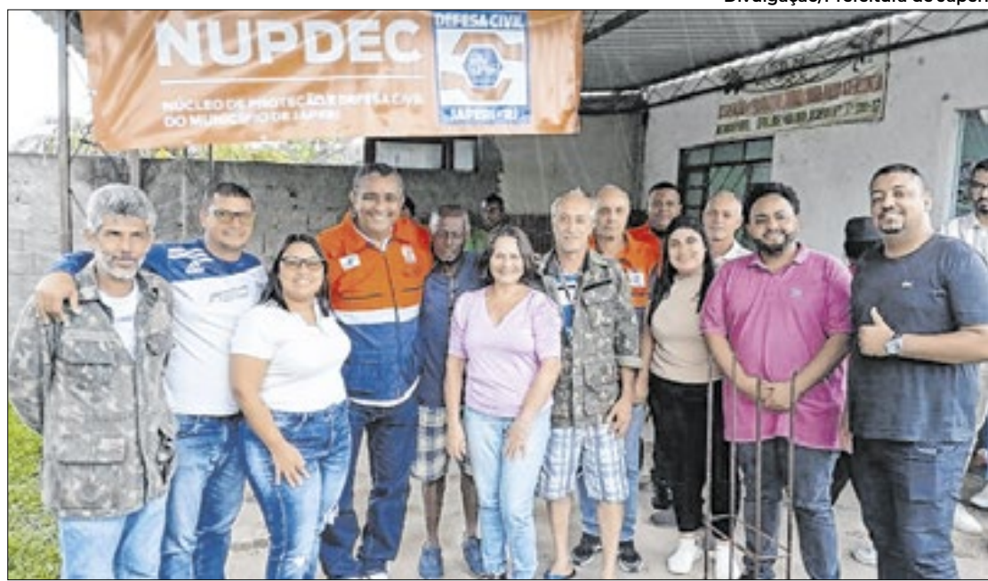
Bairro Marajoara foi escolhido para ganhar o reforço da Defesa Civil de Japeri

A inauguração do equipamento no Marajoara reforça o compromisso da Prefeitura com a segurança da população e o fortalecimento da proteção civil, promovendo a colaboração entre o poder público e os cidadãos para enfrentar situações adversas. A presença do equipamento no bairro é mais um marco no pro-