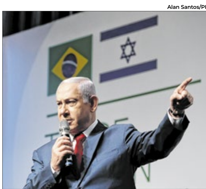
EUA também tenta mediar cessar-fogo pela Faixa de Gaza

Elias Bou Saab, vice-presidente do Parlamento libanês, confirmou o progresso, no entanto, e disse que "não há grandes obstáculos" ao cessar-fogo, "a menos que" o primeiro-mi-