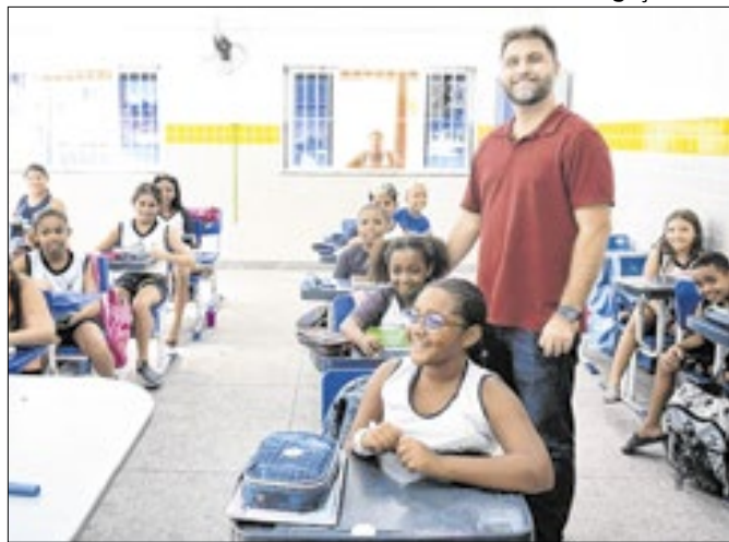
O prefeito Wladimir Garotinho durante visita aos alunos