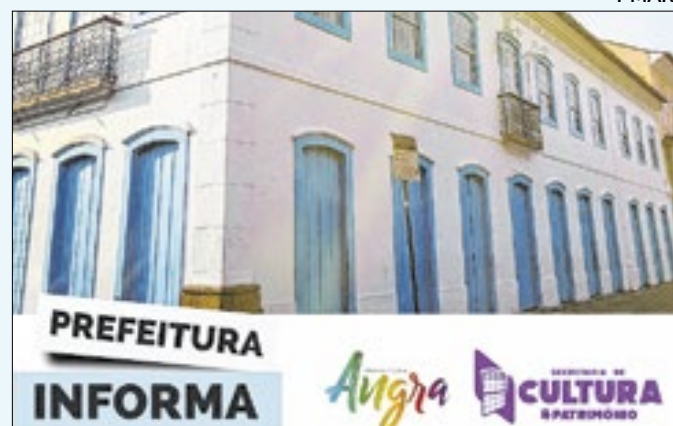
As inscrições estarão abertas até o dia 2 de dezembro