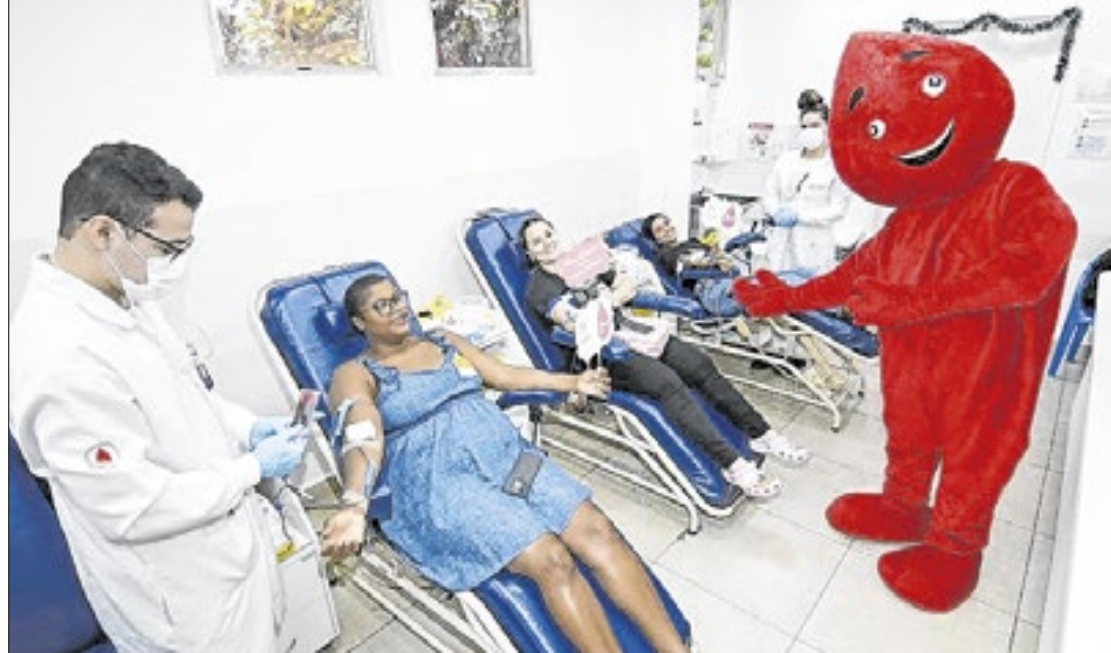
Hospital Geral de Nova Iguaçu (HGNI) comemorou o Dia Nacional do Doador de Sangue