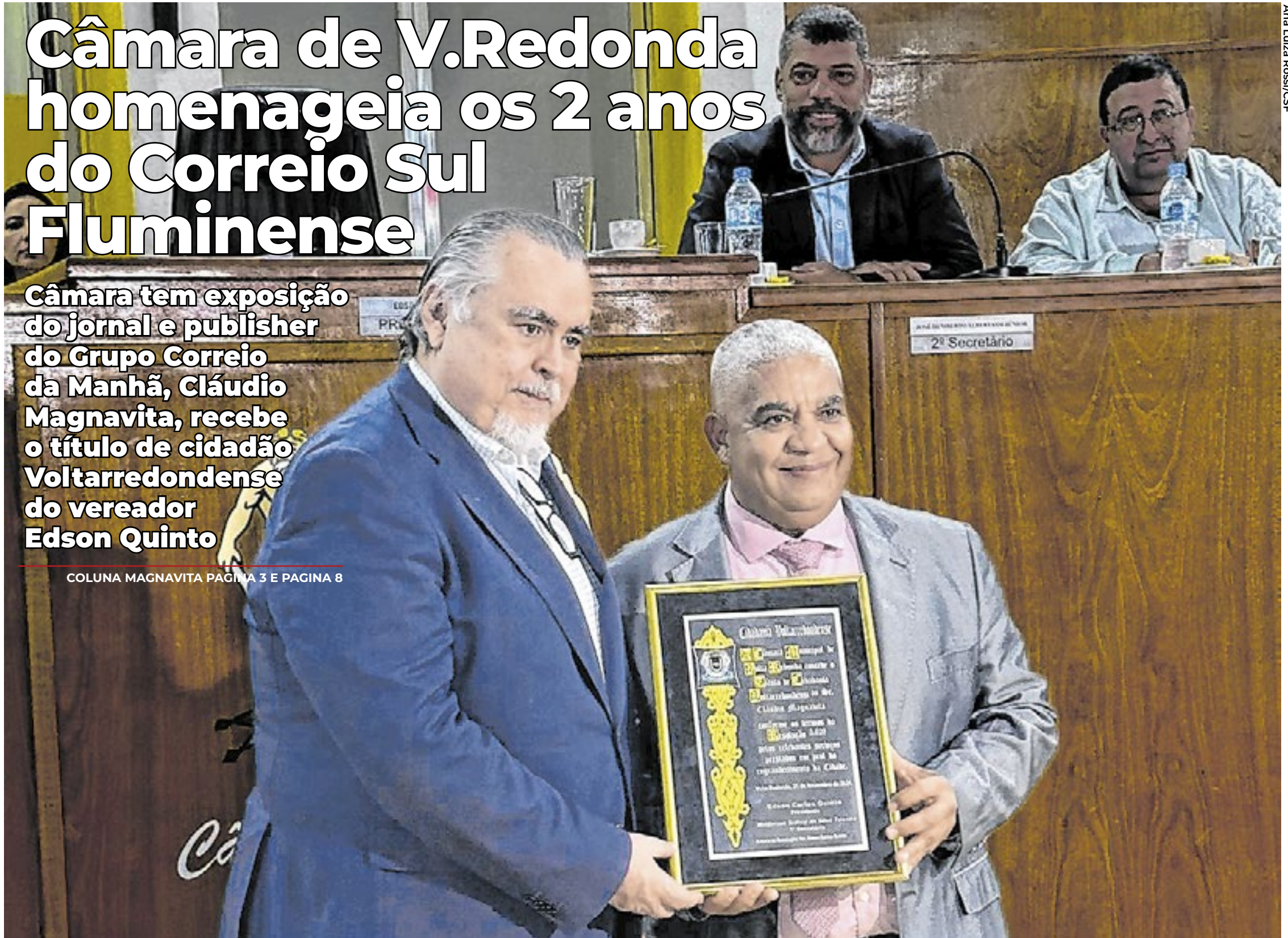
Ana Luiza Rossi/CSF