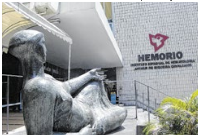
Campanha da instituição reforça valor da doação