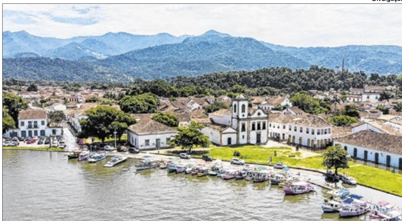
Rio-Santos leva para a histórica cidade de Paraty-RJ

Rio-Santos já consumiu R$ 305 milhões só nos reparos de mais de 450 sinistros após fortes chuvas ainda em 2022