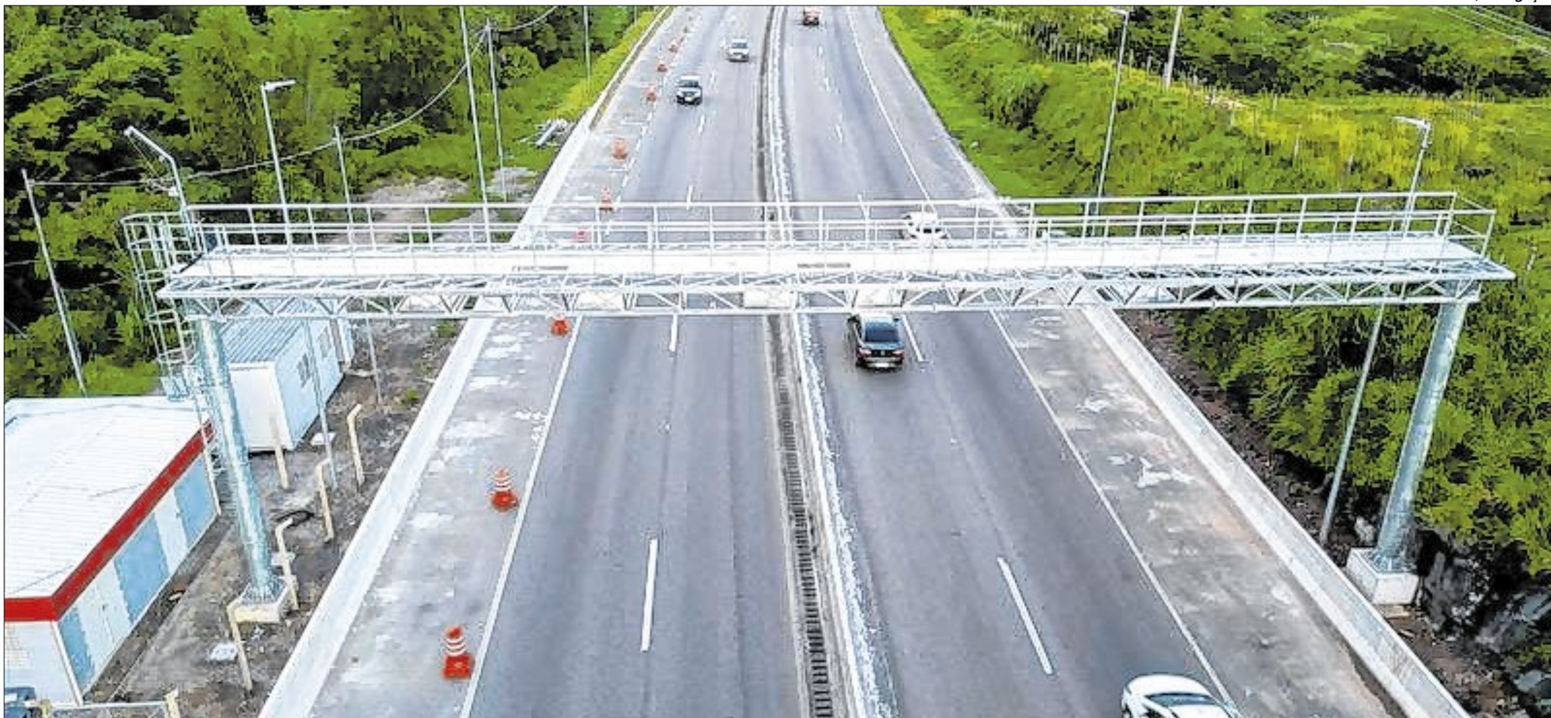
Rio-Santos tem pedágios automatizados e enfrenta problemas de deslizamentos