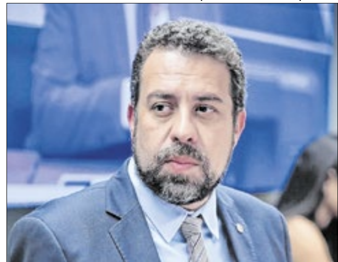
Documento da defesa mudou fala sobre Boulos