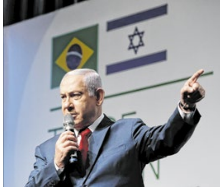
EUA também tenta mediar cessar-fogo pela Faixa de Gaza

Elias Bou Saab, vice-presidente do Parlamento libanês, confirmou o progresso, no entanto, e disse que "não há grandes obstáculos" ao cessar-fogo, "a menos que" o primeiro-mi-