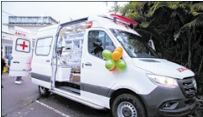
Cidade é uma das únicas a ter uma UTI Neonatal