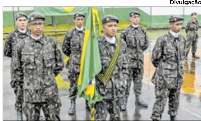
TG 01-01 já formou mais de oito mil reservistas