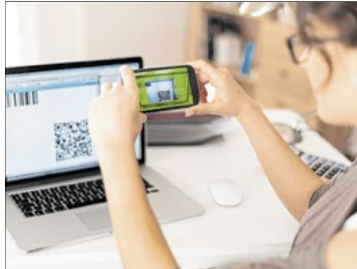
Black Friday pode chegar a 89,3 mil tentativas de golpe

Entre as práticas fraudulentas mais comuns está o chamado "golpe do Pix", no qual criminosos criam ofertas enganosas e induzem consumidores a realizarem pagamentos via transferência, sem entregar o produto ou serviço prometido.