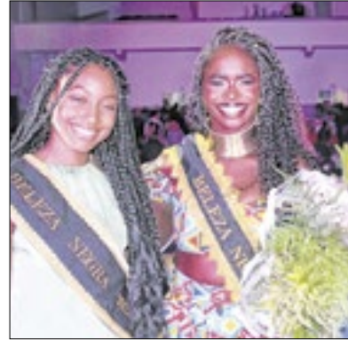
Beleza negra em destaque

Em Cordeiro último sábado (23), aconteceu o Concurso Beleza Negra 2024, que tem o objetivo de valorizar e difundir os diferentes padrões de beleza e promover a conscientização sobre a igualdade racial.