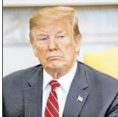
Caso 'Trump' pode ser arquivado

O procurador especial Jack Smith pediu à Justiça dos Estados Unidos para arquivar o caso de tentativa de subversão das eleições de 2020 contra Donald Trump, na segunda (25). O procurador, que o republicano já afirmou que irá demitir