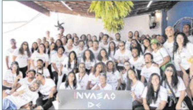
Despertar a paixão pela leitura é a missão da ONG