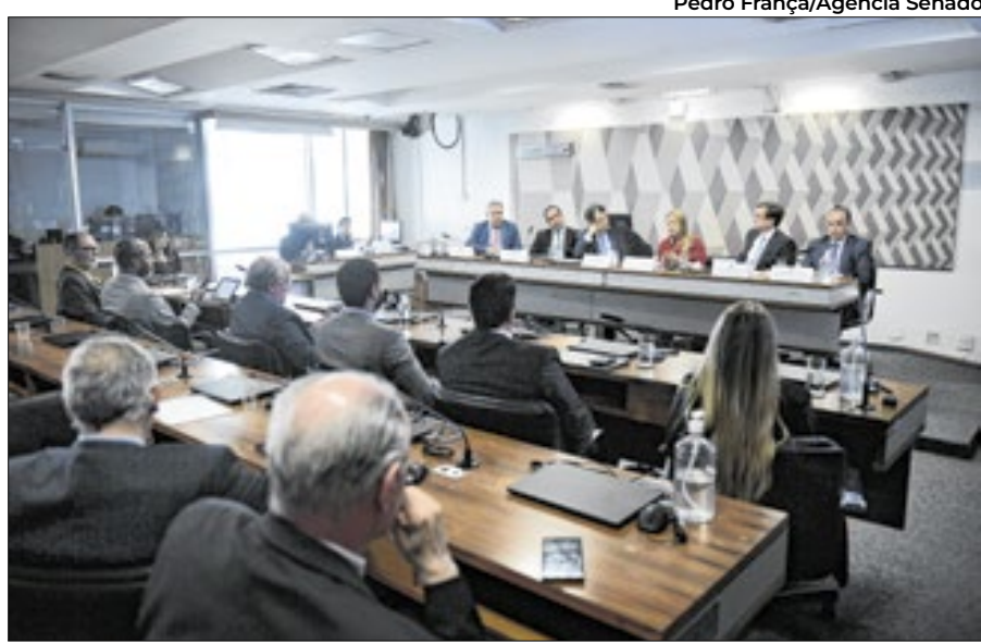
Pedro França/Agência Senado

Inicialmente estavam previstas 11 audiências públicas para debater o tema, mas o relator achou necessário ampliá-las para 13, atendendo pedidos. "As reuniões têm abordado os impactos da Reforma [Tributária] em áreas como saúde, regimes financeiros, setor imobiliário, infraestrutura e, especialmente, na Zona Franca de Manaus e nas Áreas de