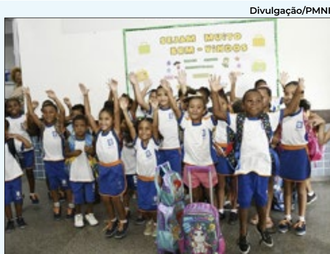
Prefeitura dá início à pré-matricula online

A mobilização contou com visitação e fiscalização em borracharias, galpões e ferros-velhos, entre outros estabelecimentos. Também foram realizados serviços de saúde, com aferição de pressão arterial, glicose e auriculoterapia, e aplicação da vacina contra a dengue, para crianças e adolescentes de 10 a 14 anos. A Superintendência lembra que o atendimento ao público acontece através do Whatsapp do Disque Dengue: (21) 2342-1810 ou presencial, na sede da Superintendência, localizada na Avenida Actura, nº 30 – Campos Elíseos, de segunda a sexta-feira, das 9h às 16h.