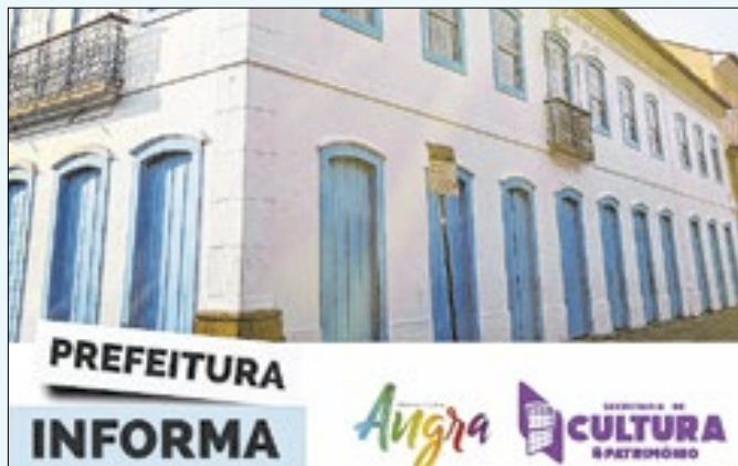
As inscrições estarão abertas até o dia 2 de dezembro