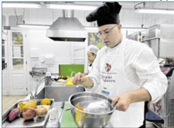
Vencedor será premiado com viagem ao Recife