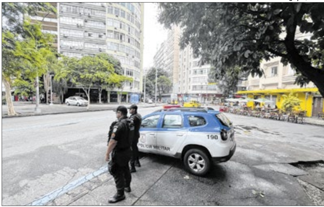
Estado registrou, nos dez primeiros meses do ano, avanços significativos na segurança

novo prazo vai até o dia 30 de dezembro e é destinada àqueles que ainda não compareceram durante o calendário regular, realizado de setembro a novembro. Até o momento, 76% dos beneficiários já realizaram o recadastramento.