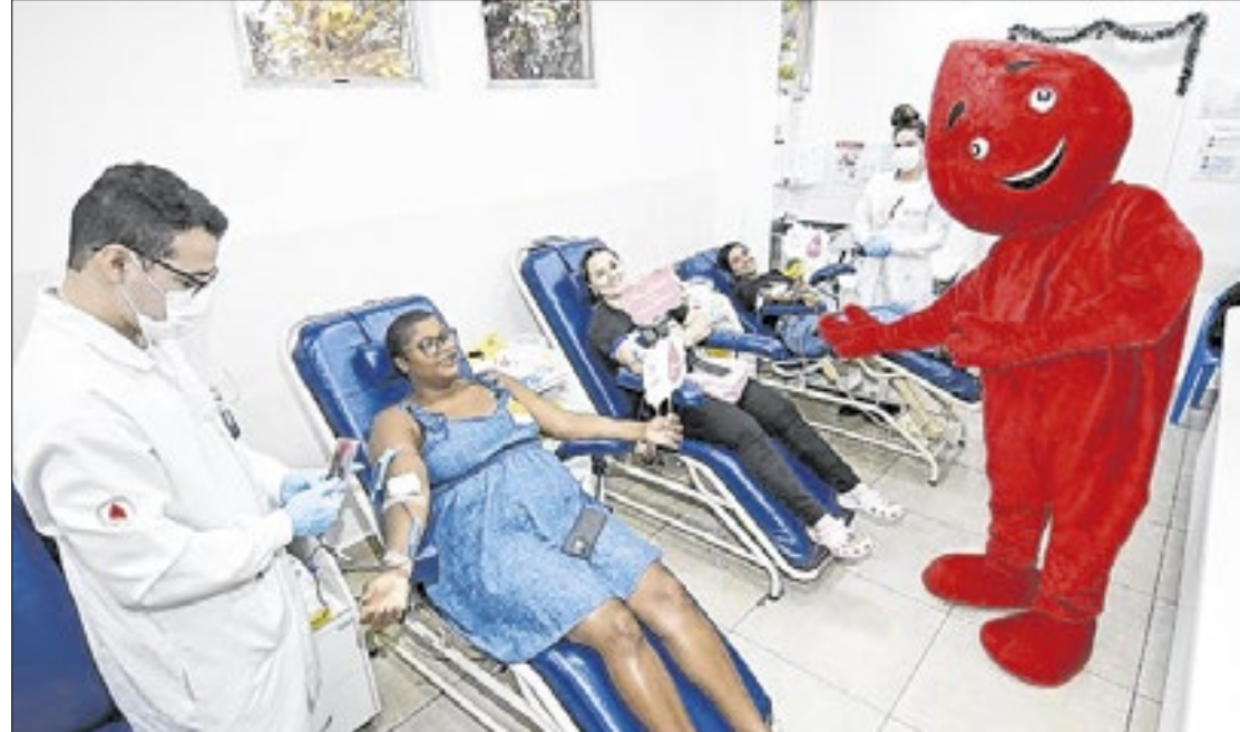
Hospital Geral de Nova Iguaçu (HGNI) comemorou o Dia Nacional do Doador de Sangue