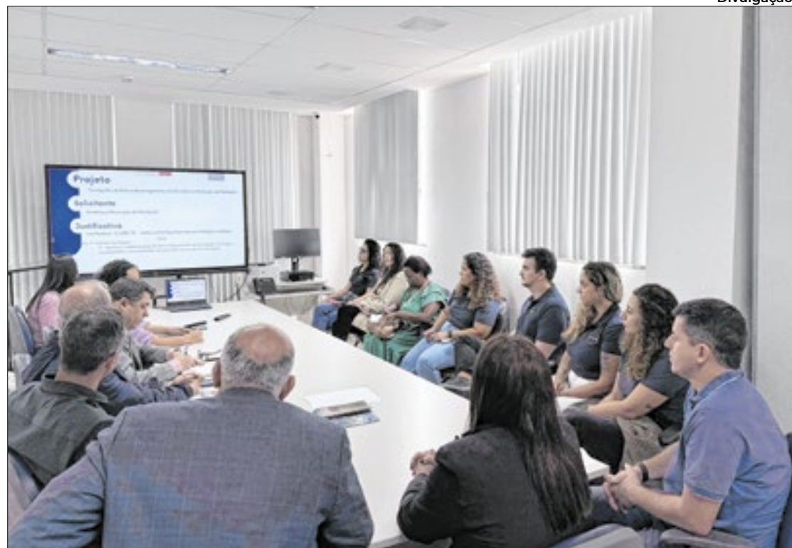
Estudo faz parte das ações preventivas do Estado e será integrado ao programa Serrana Resiliente