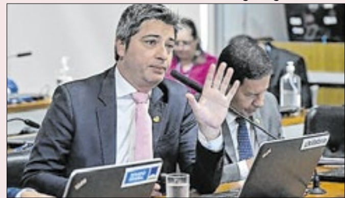
Senador monitorou passos de suspeito no exterior