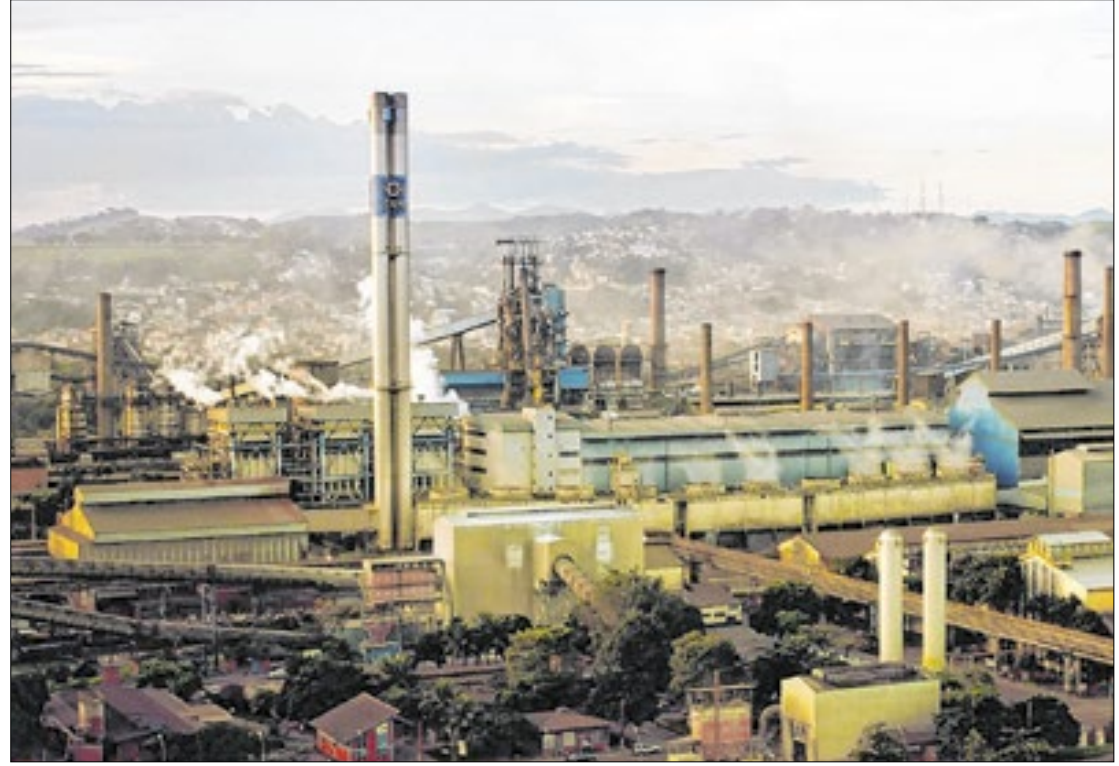
Senado alega que ação da Associação de Comércio Exterior não deve ser reconhecida

Pessoas ligadas à associação consideraram pouco usual o parecer do Senado, já que faz um juízo de valor quando deveria, de acordo com ela, apenas