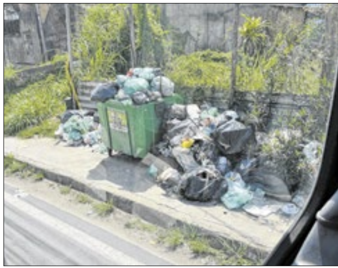
Acúmulo de lixo em diversas regiões tem sido frequente