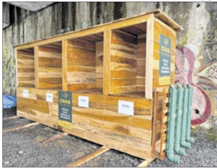
Projeto tem apoio do ICMBio e da APA Petrópolis

A primeira lixeira reciclável de Petrópolis foi instalada neste sábado (23), na Estrada do Cato-bira, em Petrópolis. A iniciativa é da Opensat Soluções, que lidera um projeto inovador e preocupado com o meio ambiente, com o apoio da CRAS Madeira, Ita Verde, ICMBio, APA Petrópolis e Nosso Jardim Plantas Ornamentais. A instalação da lixeira marca um avanço na conscientização ambiental e no cuidado com os espaços públicos da cidade, que estão abandonados pelo Governo Municipal. A lixeira foi instalada no viaduto do Cato-bira, ao lado de uma caçamba previamente revitalizada pela Opensat, reforçando o compromisso da iniciativa com a limpeza urbana e a sustentabilidade.