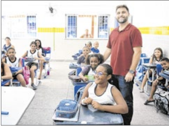
O prefeito Wladimir Garotinho durante visita aos alunos