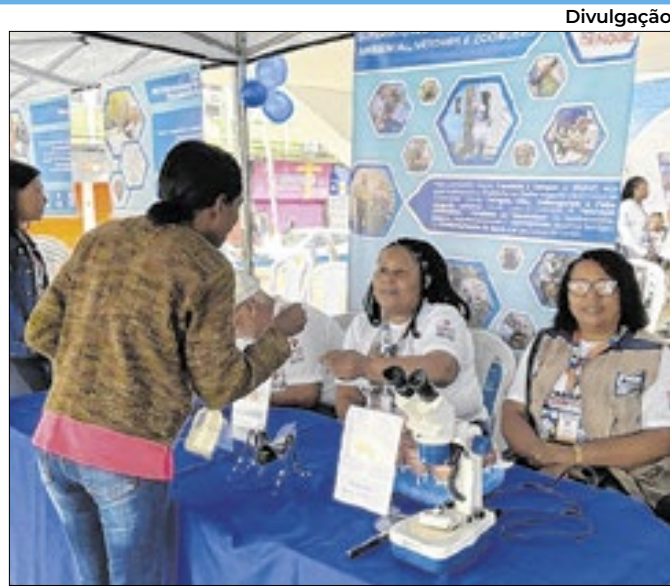
Caxias entra na mobilização contra a dengue