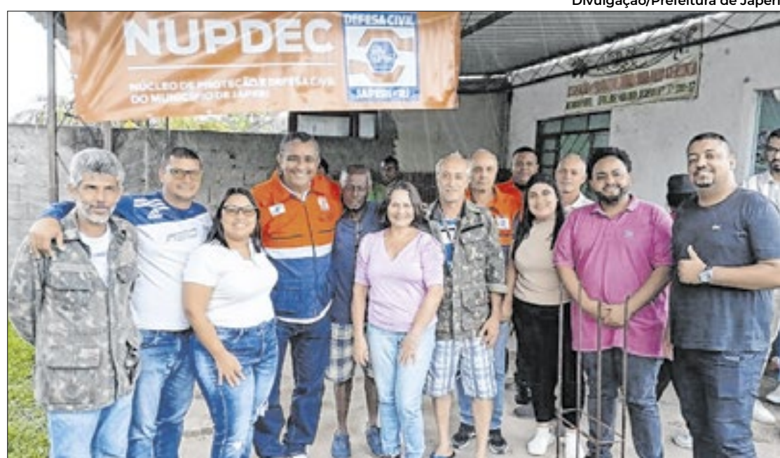
Bairro Marajoara foi escolhido para ganhar o reforço da Defesa Civil de Japeri

A inauguração do equipamento no Marajoara reforça o compromisso da Prefeitura com a segurança da população e o fortalecimento da proteção civil, promovendo a colaboração entre o poder público e os cidadãos para enfrentar situações adversas. A presença do equipamento no bairro é mais um marco no pro-