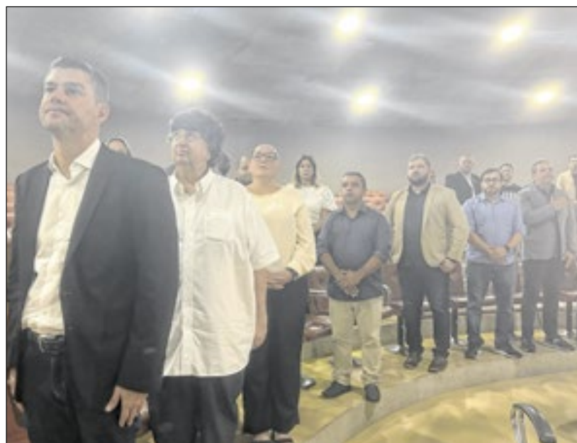
Autoridades se posicionam para o Hino Nacional