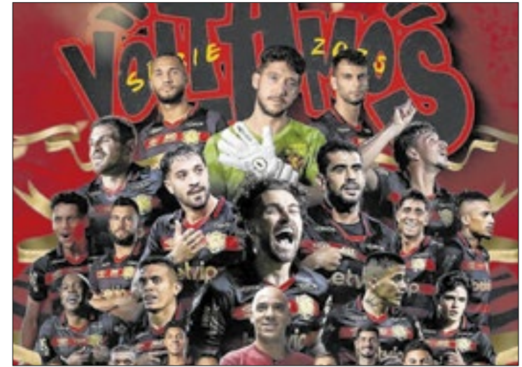
Sport retorna à Série A após três anos na Segundona

Além do Guarani (20º), os outros três times que foram rebaixados para a Série C de 2025 são: Brusque (19º); Ituano (18º); e Ponte Preta (17º).