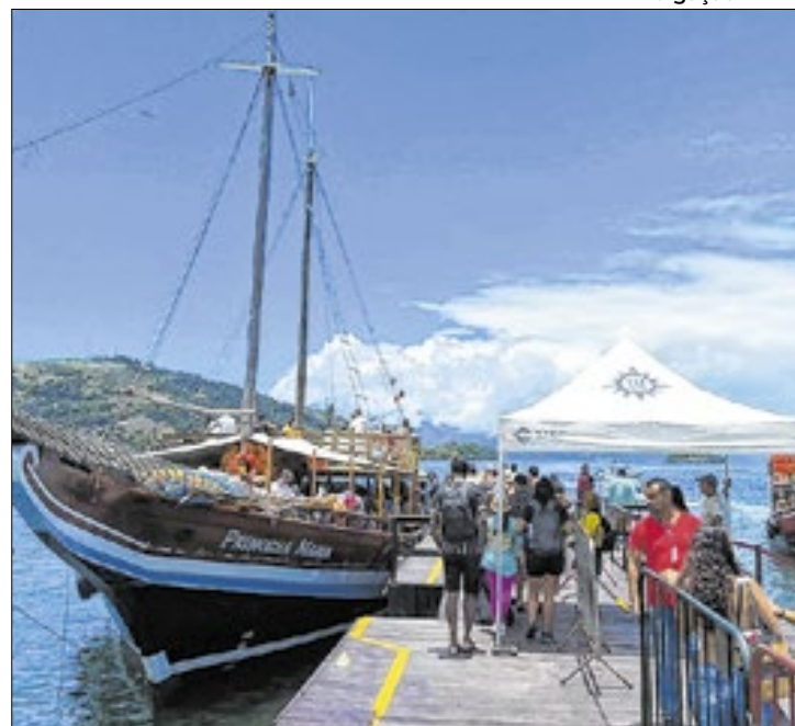
Milhares de turistas desembarcam em Angra nessa época

A temporada de navios já começou em Angra dos Reis e está impactando positivamente a economia da cidade. No último domingo (24) a visita do transatlântico Seaview, com 4.300 pessoas a bordo, movimentou Angra. De acordo com a TurisAngra, cerca de três mil passageiros desembarcaram na Estação Santa Luzia, no centro da cidade, com o objetivo de conhecer um pouco mais das belezas naturais e da história do município.