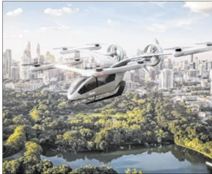
Parceria representa avanço consistente para mobilidade

A parceria prevê um 'vertiporto', infraestrutura projetada para as fases de decolagem, pouso e operação das aeronaves eVTOL, integrada ao aeroporto. Na perspectiva, a ideia central é definir uma solução sustentável de mobilidade aérea, que otimize o fluxo de cargas e passageiros no RIOga-