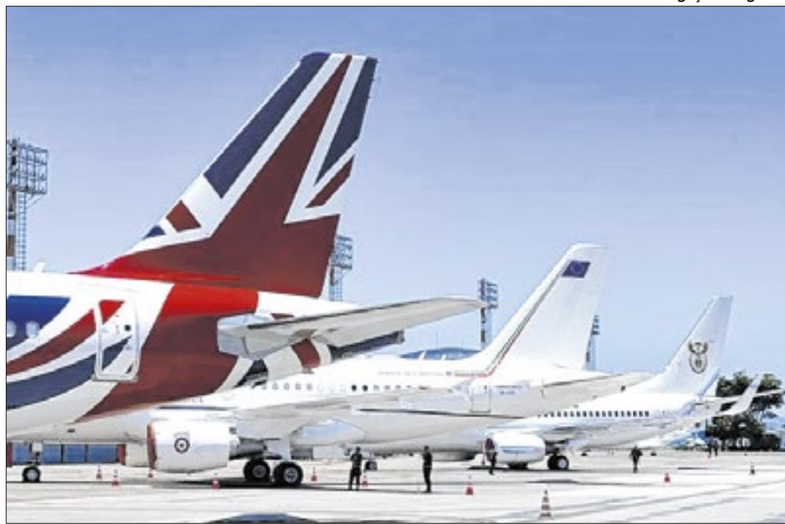
Aeroporto Internacional do Rio comprovou eficiência de 1º mundo no G20

Outro indicativo da qualidade de performance é o fato de as delegações estrangeiras terem sido recepcionadas pelo recém-inaugurado RIOgaleão Exclusive, que vem a ser o espaço antes chamado de Salão Nobre, alvo de reforma específica para atender às exigências do evento, que trouxe conforto e singularidade no atendimento prestado aos chefes de Estado e suas respectivas equipes, que puderam sentir o toque de hospitalida-