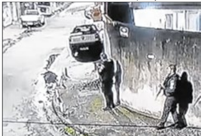
Agentes encaram 'fogo pesado' de bandidos em Bangu