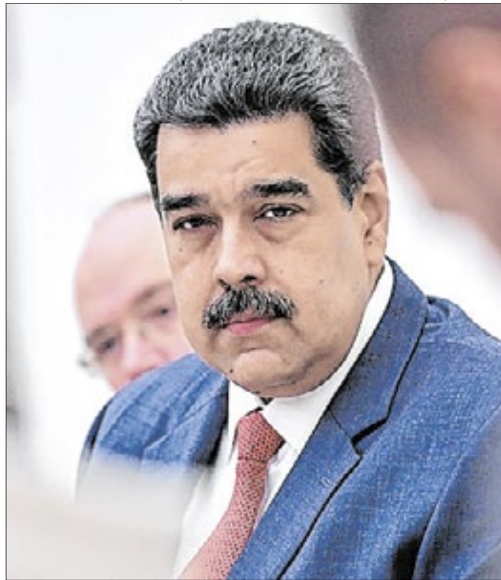
Tensão entre o regime de Maduro e a Argentina aumentou