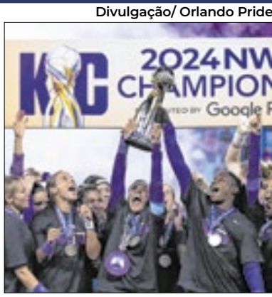
Marta levou Orlando Pride à NWSL