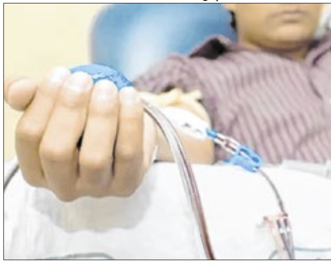
Secretaria identificou diversas irregularidades nos planos