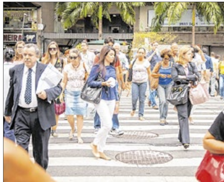
Indicador atinge o menor patamar, desde o início da série

Esses dados constam da Pesquisa Nacional por Amostra de Domicílios (PNAD) Contínua, divulgada nessa sexta-feira (22) pelo IBGE (Instituto Brasileiro de Geografia e Estatística), ao destacar que a retração da desocupação ocorreu em sete das 27 unidades da federação (UFs).