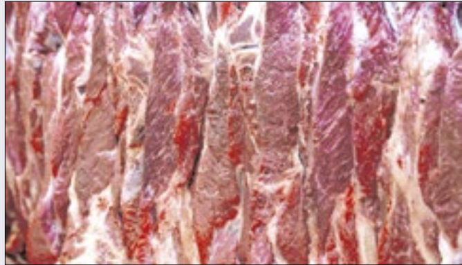
Multinacional francesa já sofre efeito do próprio boicote