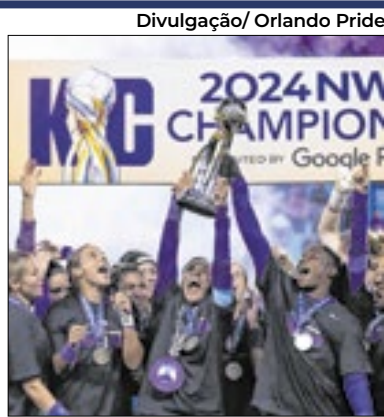
Marta levou Orlando Pride à NWSL