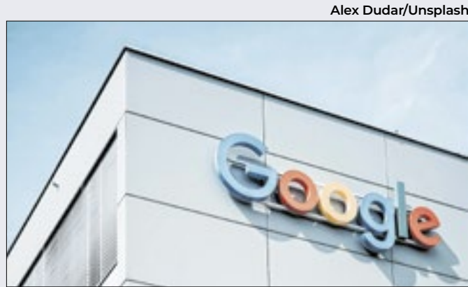
Governo dos EUA quer quebrar monopólio de 'gigante'

Apesar da expectativa 'positiva' no 4T24, a pesquisa aponta que as instituições contem com leve piora em custo/disponibilidade de funding [mobilização de recursos financeiros de terceiros para um investimento, pelo mercado bancário ou de capitais e inadimplência].