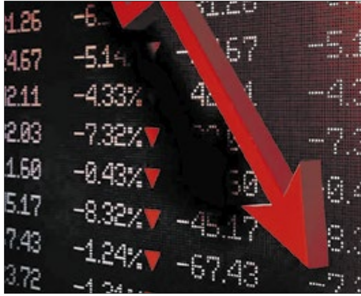
Bolsa 'derrete' pela demora do anúncio de corte de gastos

O Ibovespa voltou do feriado do Dia da Consciência Negra de mau humor: fechou com queda de 0,99%, aos 126.922,11 pontos, uma baixa de 1.275,14 pontos. É o menor patamar desde 6 de agosto, quando terminou com 126.266,70 pontos, a última vez que o IBOV termina uma sessão abaixo dos 127 mil.