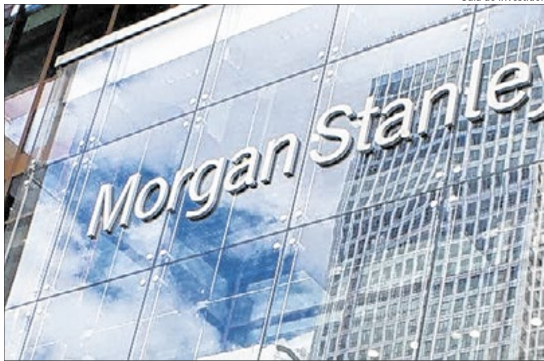
‘Elevados riscos fiscais’ motivaram rebaixamento do país perante o Morgan Stanley

Em relatório publicado, nesse domingo (17), o banco ianque acentua que “o financiamento do governo está sugando o oxigênio do mercado local de renda variável. Com juros de longo prazo entre 12% e 14% ao ano, os investi-