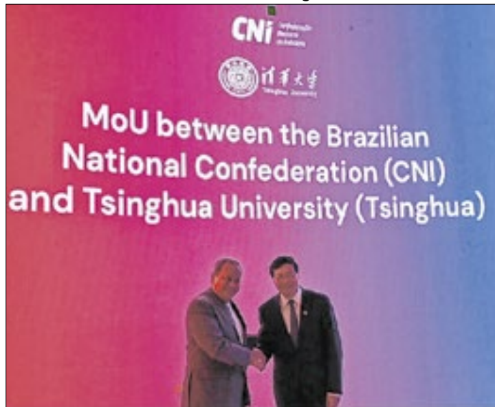
Cooperação tecnológica é vital para avanço da indústria

A iniciativa também pretende ampliar a colaboração entre as instituições para incentivar programas de mobilidade, formação de especialistas