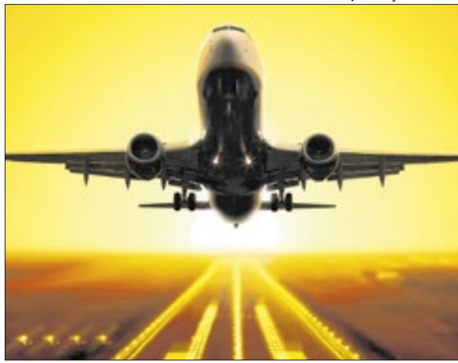
Movimento de passageiros no setor aéreo bate recorde