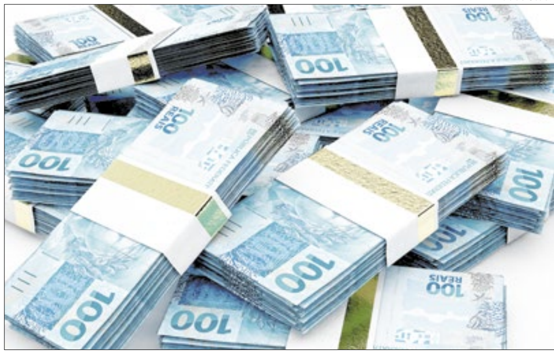
Arrecadação cresce forte, mas corte de gastos pelo Planalto é 'empurrado com a barriga'

Já as receitas administradas por outros órgãos – que têm grande peso dos royalties sobre a exploração de petróleo – o crescimento foi de