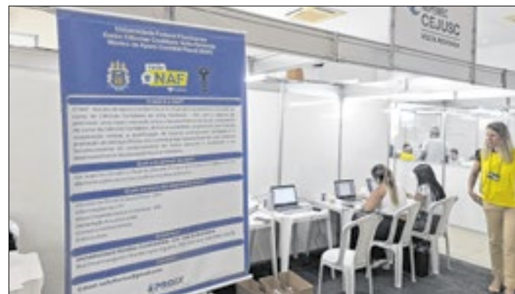
Volta Redonda sedia primeiro dia do Feirão Limpa Nome