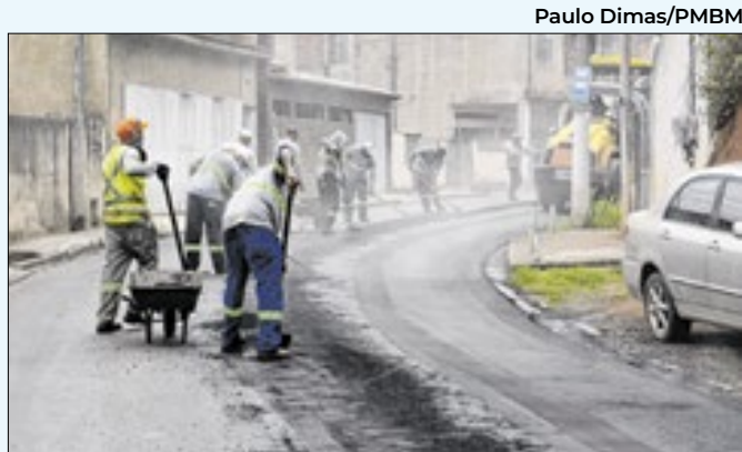
Serviço é parceria entre o Governo e a prefeitura