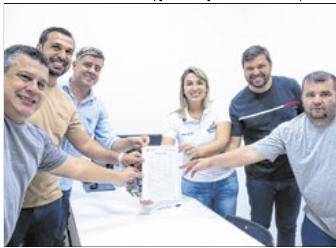
Espaço oferecerá acolhimento e atividades para idosos