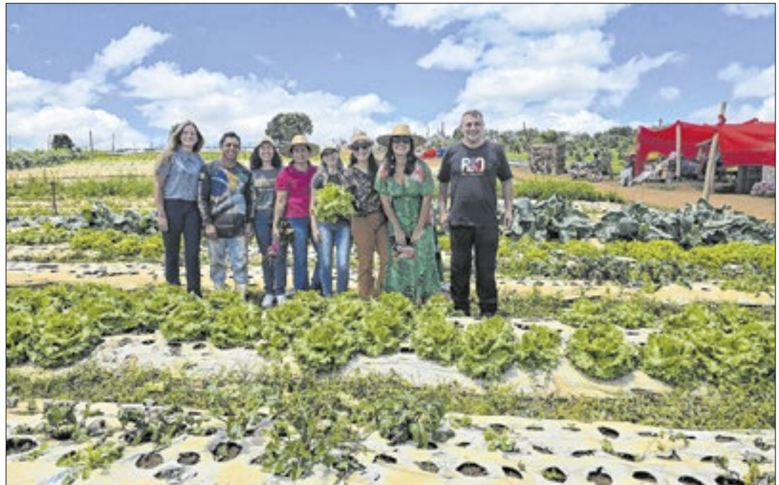
Turismo Rural RJ é fruto de uma colaboração técnica entre a Setur-RJ, TurisRio e a Seappa

ditionalmente têm redes estabelecidas com agentes de viagens e clientes. Quando mescladas com influenciadores digitais, a divulgação alcança um público mais amplo e diversificado, incluindo aqueles que talvez não planejam visitar determinado destino", complementa Kling.