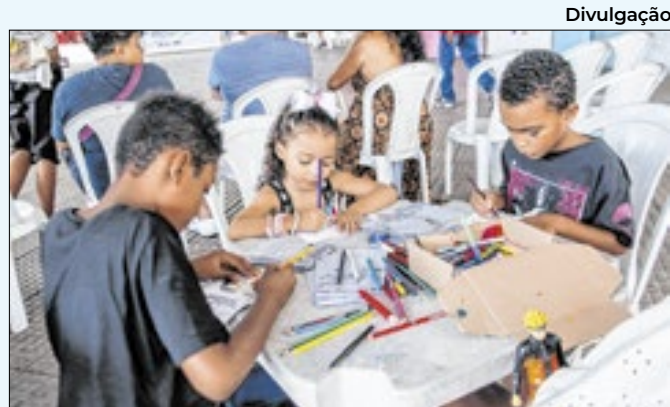
Evento acontecerá no Memorial Zumbi

tações do DJ Dirty Death e das bandas Mau Hábito, formada em São Paulo, Língua Ácida e a estreante Minissaia - ambas formadas em Volta Redonda.