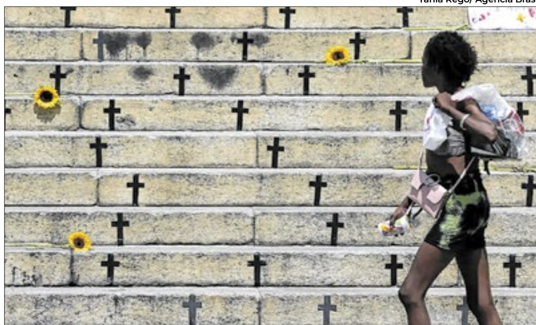
Campanha leva em consideração a dupla vulnerabilidade da mulher negra

Todo esse sufocamento gera uma série de problemas relacionados à violência contra o grupo em diversas camadas sociais. Em 2023, de acordo com os dados do Fórum Brasileiro de Segurança Pública, cresceram todos os tipos de violência contra a mulher. O levantamento