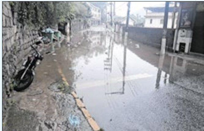
Algumas regiões registraram mais de 45mm de chuva