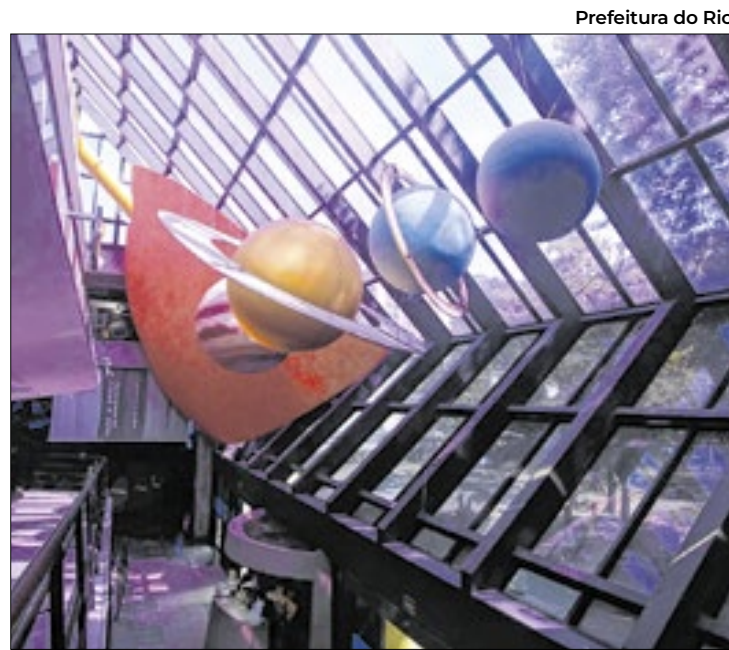
Aniversariante, Planetário preparou programação intensa