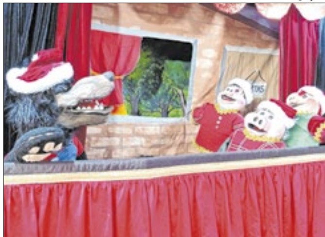
Teatro de bonecos, conta com aventura e magia