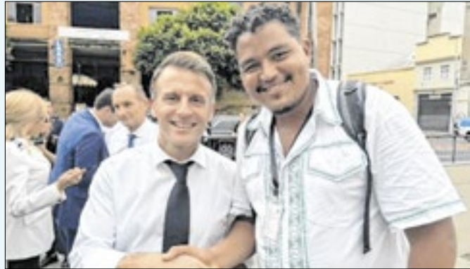
Do êxtase à decepção, é o que viveu guia afro-brasileiro