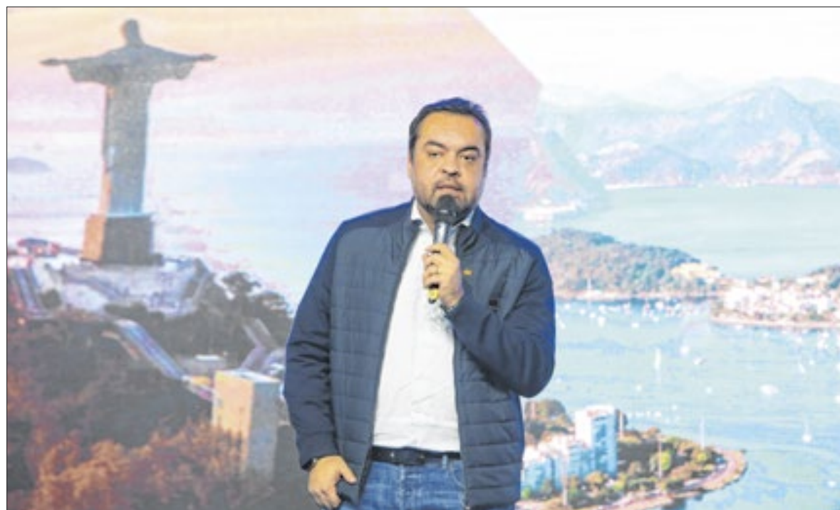
Governador destacou diálogo entre os integrantes do Consórcio para avançar em discussões de interesse comum

O governador também reforçou sua defesa pela mudança na legislação penal, para fortalecer o combate ao crime organizado. Castro propôs estadualizar algumas regras e disse que esse será