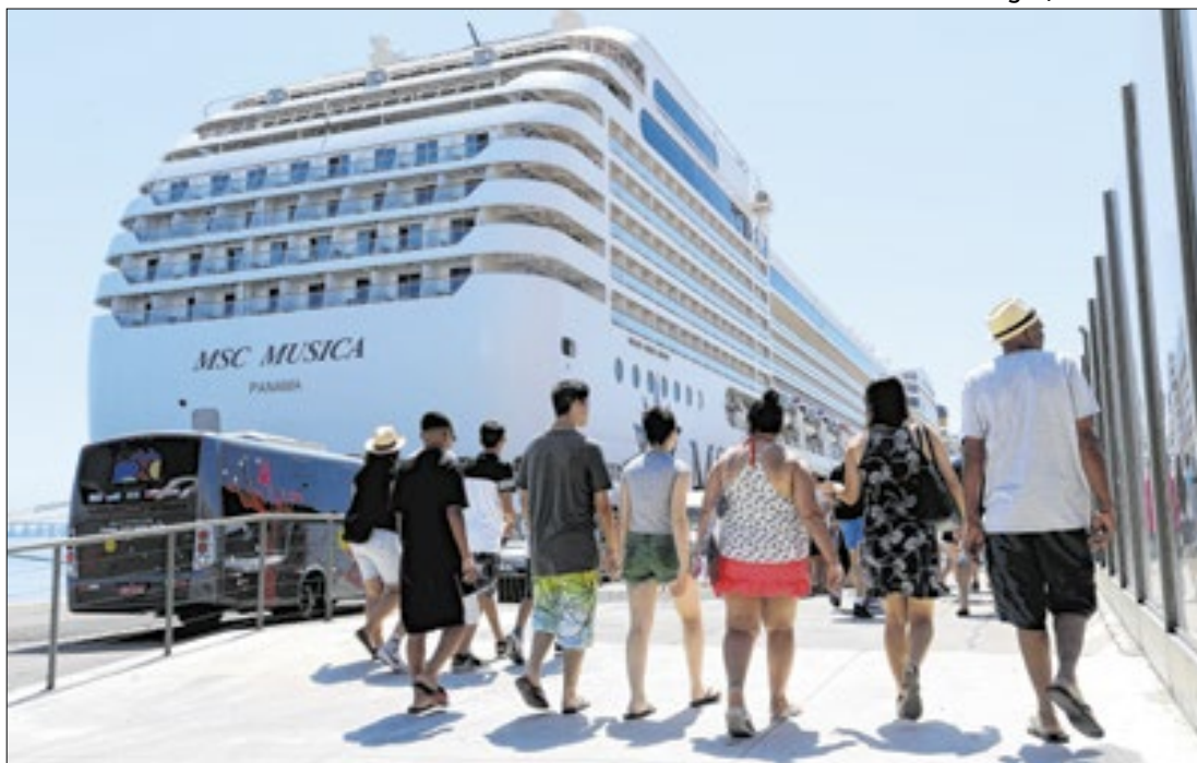
Secretaria de Turismo projeta encerrar 2024 com a marca de 1,5 milhão de turistas