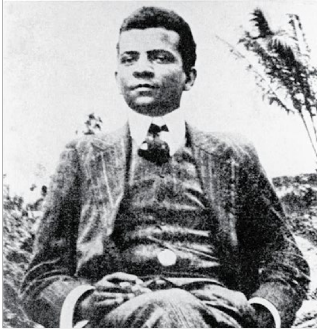
Autor incompreendido em seu tempo, Lima Barreto traz a linguagem das ruas