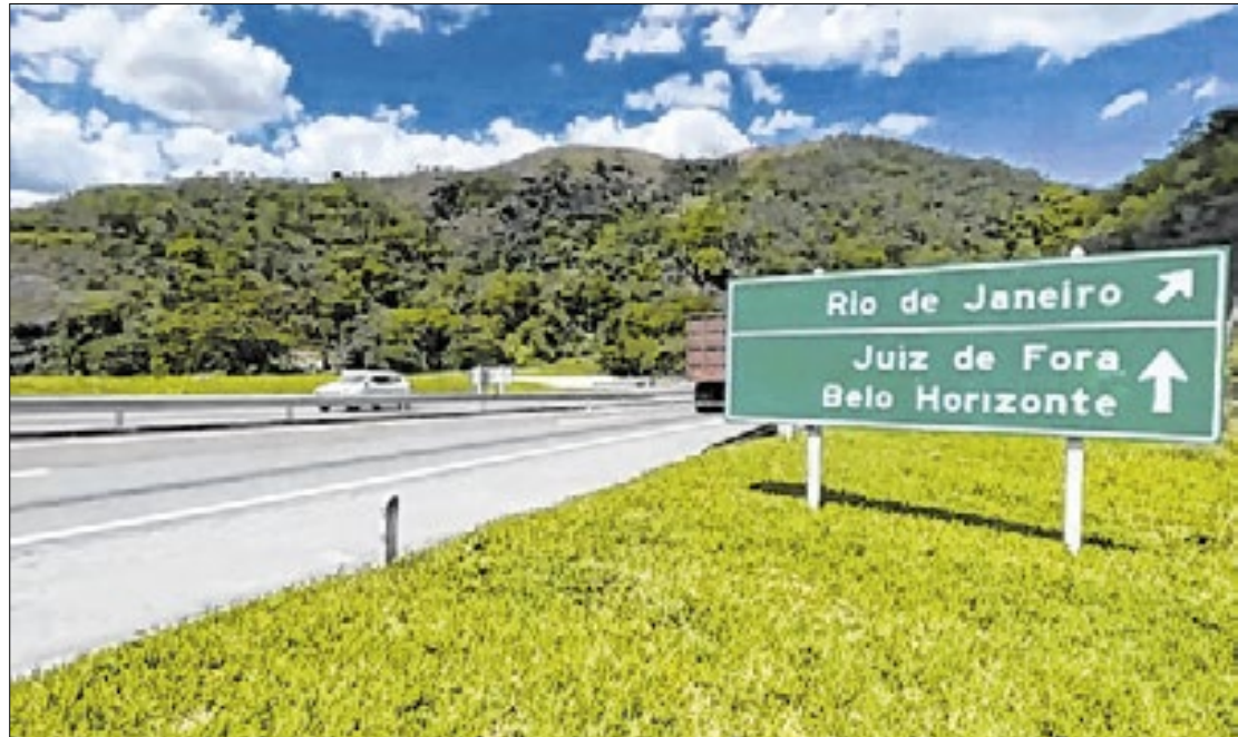
Rodovia é a principal ligação entre os estados do Rio de Janeiro e Minas Gerais

A análise do TCU segue as exigências da normativa 81 de 2018, que determina que, até 150 dias antes da publicação do edital, os órgãos responsáveis devem apresentar a descrição do objeto da licitação, previsão de investimentos, a relevância do projeto, a localização dos empreendimentos e o cronograma do processo licitatório. Além disso, até 90 dias antes, devem ser apresenta-