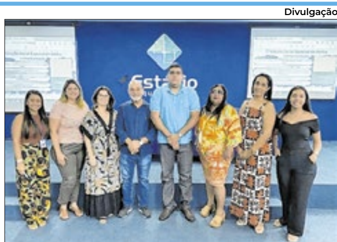
Encontro foi no auditório da Universidade Estácio de Sá