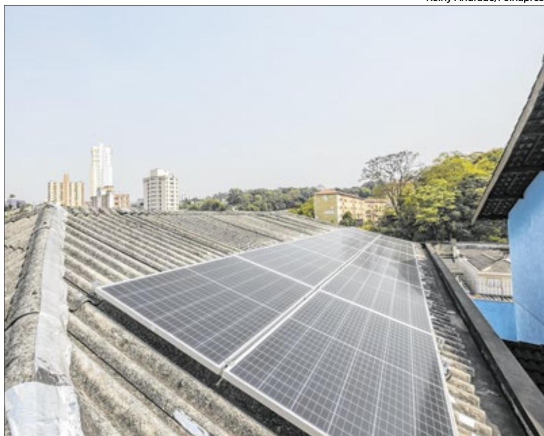
Placas solares ainda são o principal meio para ter energia renovável em casa