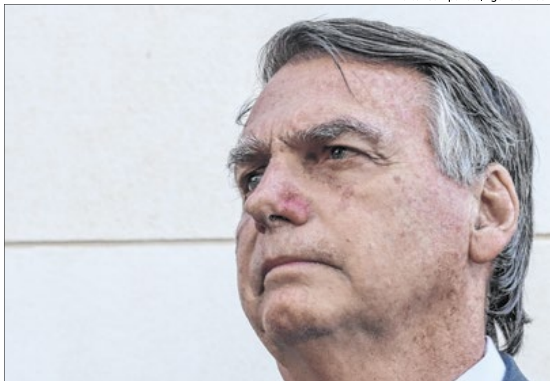
Inquérito foi enviado ao STF com o indiciamento de 37 pessoas

De acordo com a PF, as provas foram obtidas por meio de diversas diligências policiais realizadas ao longo de quase dois anos, com