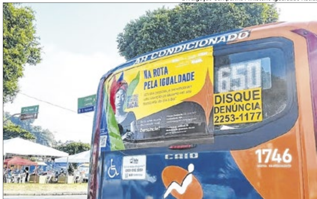
Colocação de cartazes com QR Codes facilita envio de denúncias contra racismo

Para reforçar a importância das denúncias, cartazes