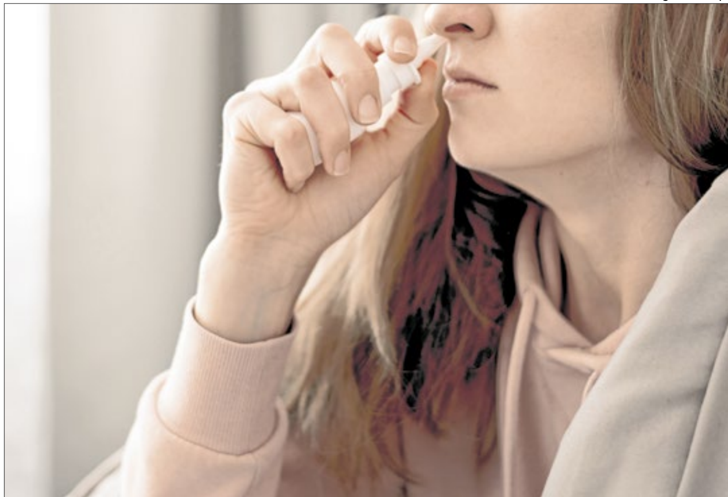
Vício de descongestionante nasal pode gerar sintomas semelhantes ao vício de drogas

A médica explica que esses medicamentos devem ser usa-