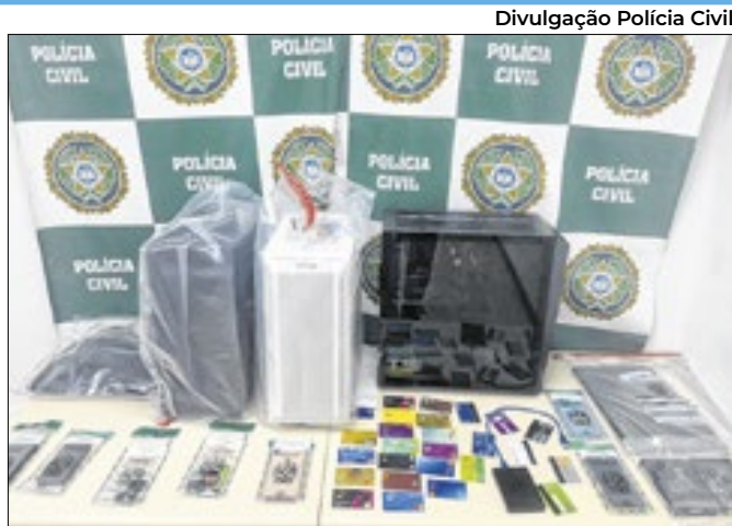
Operação apura fraudes no montante de R$ 40 milhões