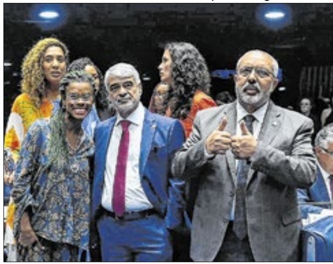
Após mudanças, texto alternativo voltou aos senadores