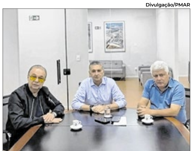
Jordão e Ferreti alinham detalhes do empreendimento

Uma nova reunião técnica entre representantes da Prefeitura e da Cetenco Engenharia está agendada para o dia 5 de de-