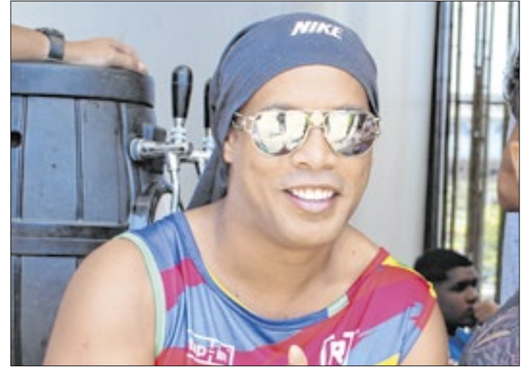
Ronaldinho foi eleito o terceiro melhor jogador do século XXI

A rádio também explica por qual motivo Ronaldo Fenômeno aparece tão abaixo no ranking. Grande parte de seu sucesso ocorreu antes da virada do século, com a conquista de dois prêmios de Melhor do Mundo antes dos anos 2000. Mas sua atuação na Copa do Mundo de 2002, por si só, já lhe garantiu um lugar na lista.