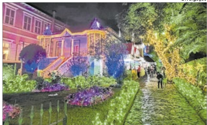
Vale Encantado: Um Natal iluminado conquista Petrópolis

I naugurado no dia 15 de novembro, o Vale Encantado já se consolidou como uma das principais atrações natalinas de Petrópolis. Milhares de visitantes têm sido transportados para um universo mágico, repleto de luzes, cores e encantamento.