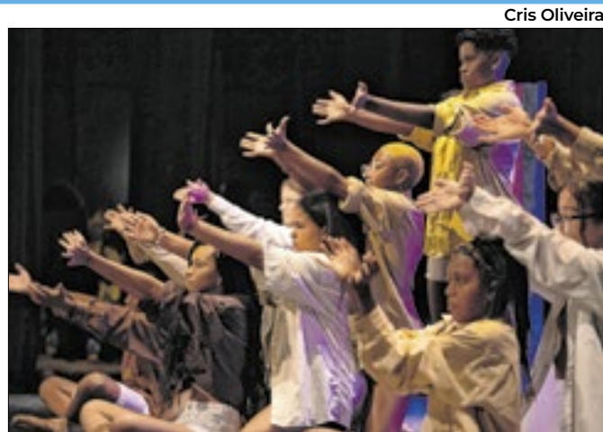
Apresentações acontecem no Teatro da Fevre