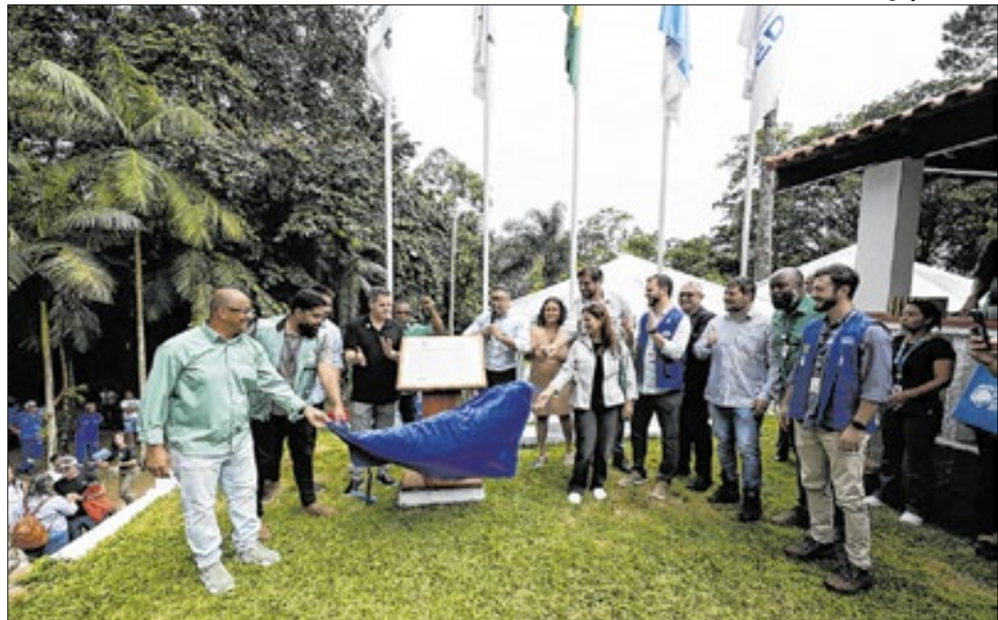
Estação fica localizada na Reserva Biológica do Tinguá, em Nova Iguaçu

A EESA possui ambientes internos e externos prontos para receber os visitantes. No lado de dentro, uma área dedicada à Cedae conta a história do Sistema Acari com exposição de fotos, maquete interativa e óculos de realidade virtual, com imagens desde a época do