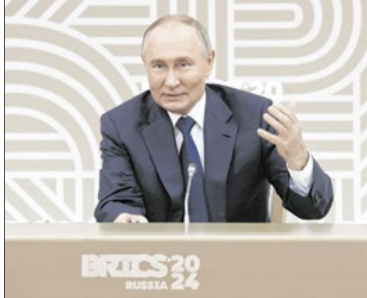
Putin disse que ataque foi uma resposta aos planos dos EUA

Ele repetiu a ameaça que já havia feito aos Estados Unidos e aliados da Otan antes. "Consideramos ter o direito de usar nossas armas contra alvos militares dos países que permitem que