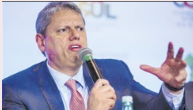
Gestão Tarcísio tem cinco dias para detalhamento