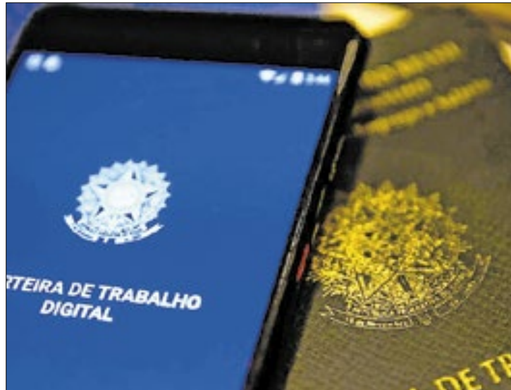
Média de efetivação no final de ano no Brasil é de 13,8%

A média de efetivação de trabalhadores temporários contratados no período de final de ano no Brasil é de 13,8%, dependendo das condições do mercado e do setor, segundo dados da Confederação Nacional do Comércio (CNC). Fatores