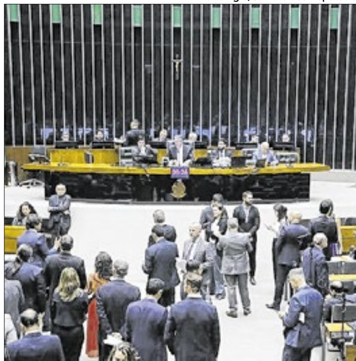
Plenário da Câmara na aprovação do projeto, em 19/11

As chamadas "emendas Pix", que somam R$8 bilhões em 2024, são um dos principais pontos abordados pelo texto. O modelo de transferência direta de recursos públicos, atualmente suspenso por decisão do Su-