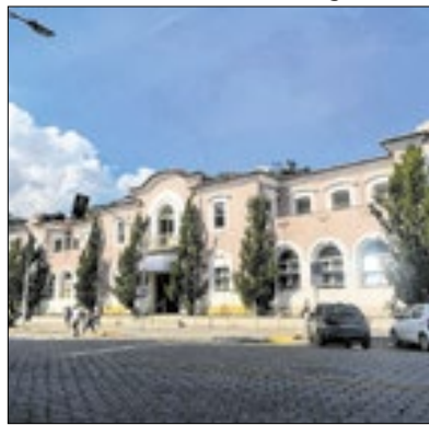
Prefeitura de Nova Friburgo

Realizado no final de 2023, o concurso público da Prefeitura de Nova Friburgo já empossou e colocou em atuação 1.618 profissionais em diversas áreas do município. Além de terem o maior número de vagas ofertadas, a