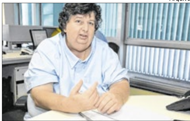
Neto falou sobre funcionamento da prefeitura no fim de ano