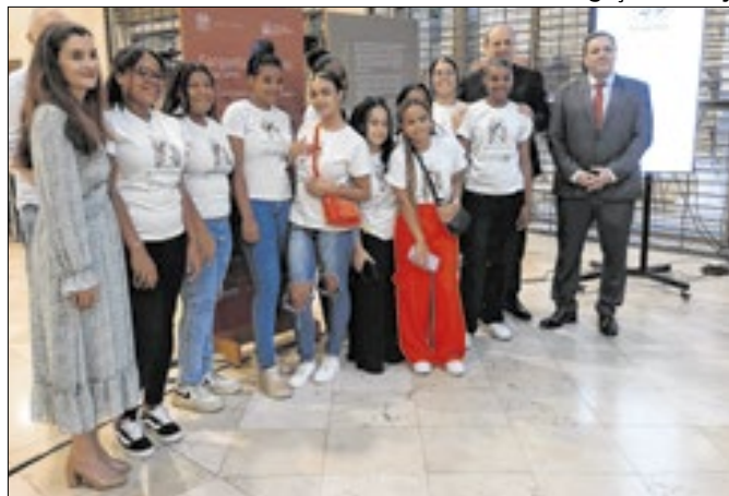
Projeto foi recentemente à Exposição Gargantas Urbanas