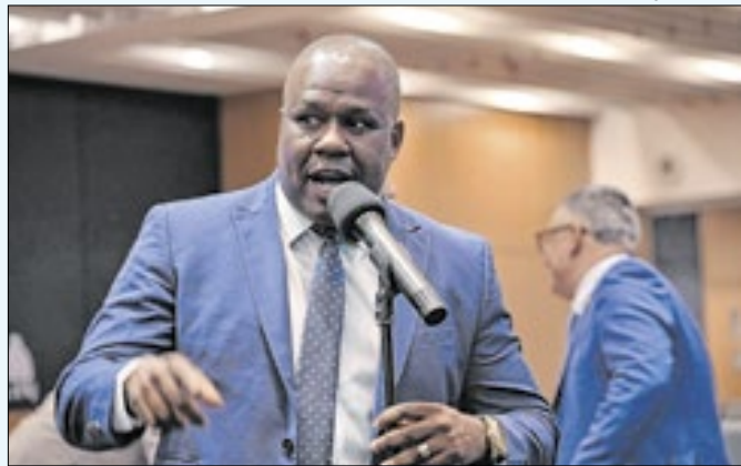
PL é de autoria do deputado Carlinhos BNH (PP)