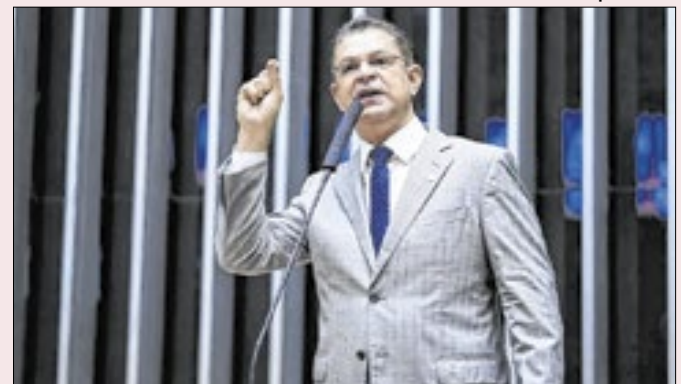
O deputado diz que as negociações estão avançadas