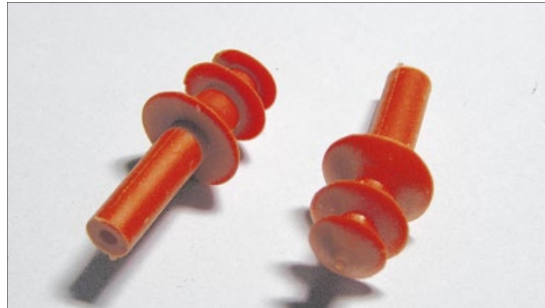
No exterior, frequentadores de festivais optam pelo acessório e apontam benefícios

No TikTok, a hashtag “earplugs” agrega mais de 16 mil vídeos. No fórum Reddit, um tópico com mais de 1.800 comentários discute o uso dos protetores