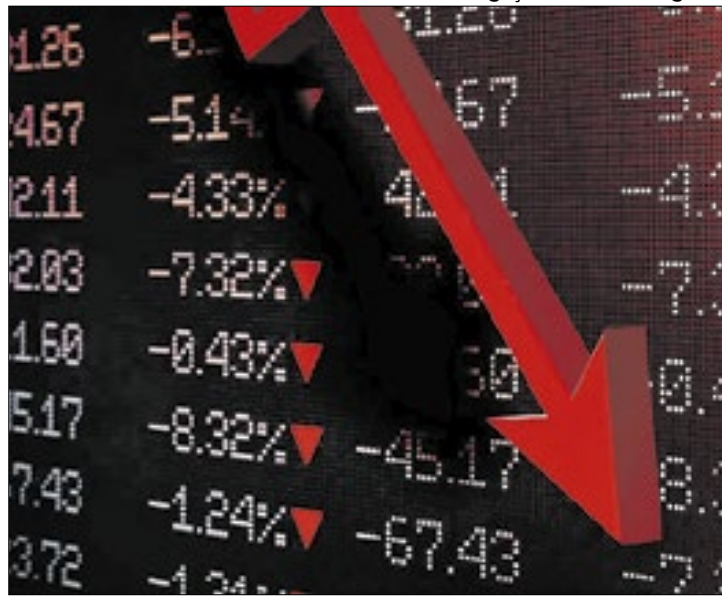
Bolsa 'derrete' pela demora do anúncio de corte de gastos