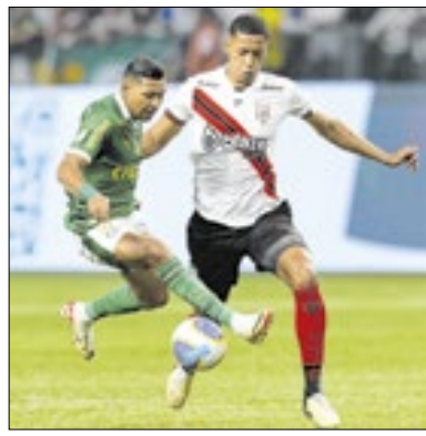
Jogo pode ter torcida única

O Ministério Público de Goiás (MPGO) recomendou à CBF que a partida entre Atlético-GO e Palmeiras, que será realizada no sábado (23), às 19h30, pela 35ª rodada do Brasileiro, tenha torcida única. A recomendação