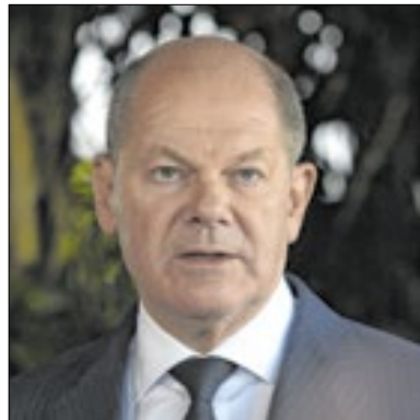
Olaf Scholz teme Putin e Trump

Se o ucraniano Volodimir Zelenski é um dos líderes com mais a temer após a vitória de Donald Trump nas eleições dos EUA, o alemão Olaf Scholz também tem motivos de preocupação. No comando da maior economia da Europa, parte crucial da Otan e aliada de primeira hora de Kiev, o primeiro-ministro corre o risco de ver a aliança militar ser enfraquecida pelo republicano e a Rússia ficar em posição fortalecida se Trump costurar um acordo favorável a Moscou.