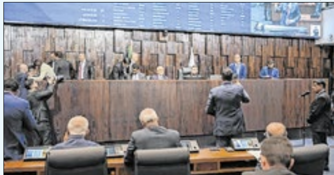
Plenário da Assembleia Legislativa do Rio de Janeiro