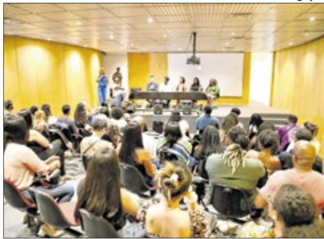
Encontro foi realizado no auditório do MAC