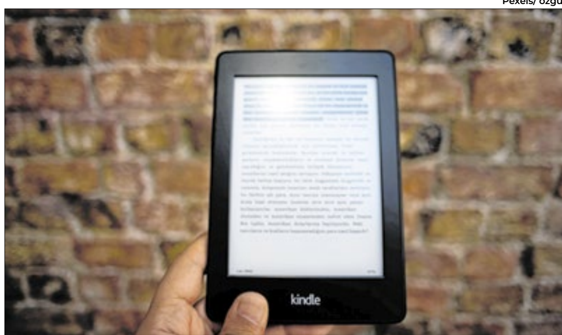
Ferramentas como o Kindle ajudam pessoas com TDAH na hora da leitura

“Recentemente, também comecei a ouvir livros bíblicos, porque eles têm uma linguagem mais arcaica. Normalmente,