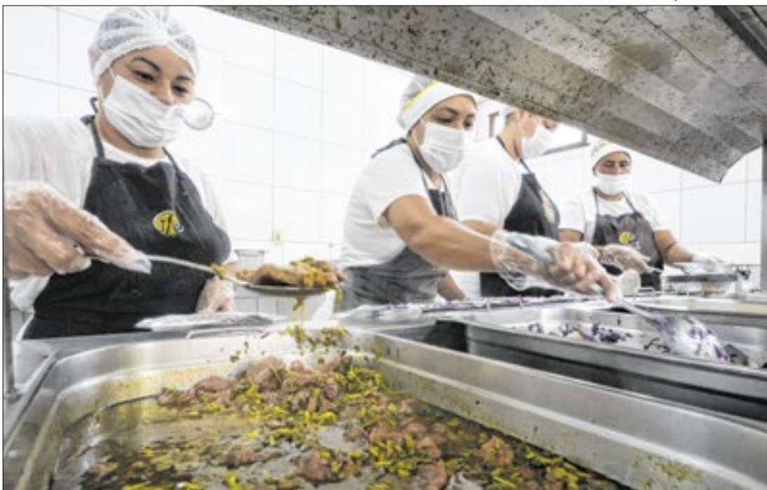
Programas do Governo do Estado oferecem, juntos, cerca de 53 mil refeições por dia

especial nos setores do turismo, esportes radicais e da pesca artesanal, além de proteger paisagens e atrativos naturais fluviais de beleza cênica notável configurada por leitos pedregosos, meandros, cachoeiras, corredeiras, rochas emersas e submersas.