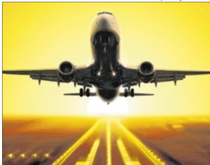
Movimento de passageiros no setor aéreo bate recorde