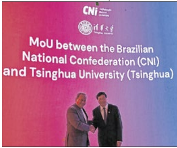
Cooperação tecnológica é vital para avanço da indústria

A iniciativa também pretende ampliar a colaboração entre as instituições para incentivar programas de mobilidade, formação de especialistas