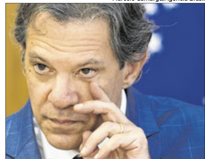
Ministro abre o olho para evitar perdas