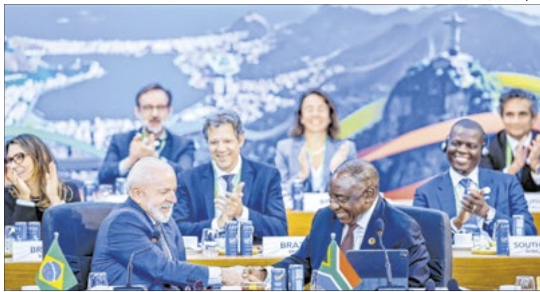
Brasil “passa o bastão” para a África do Sul

De acordo com as autoridades, em um artigo enviado à Folha de São Paulo, a Aliança Global para Energia Limpa visa triplicar a capacidade de produção de ener-