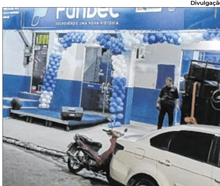
Fundec com período de matrículas aberto

Para a realização dos cursos na Academia Fun-