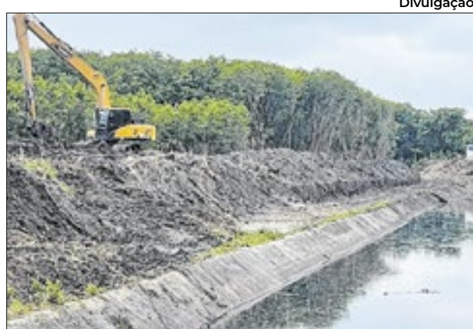
Programa de combate a enchentes prossegue na cidade