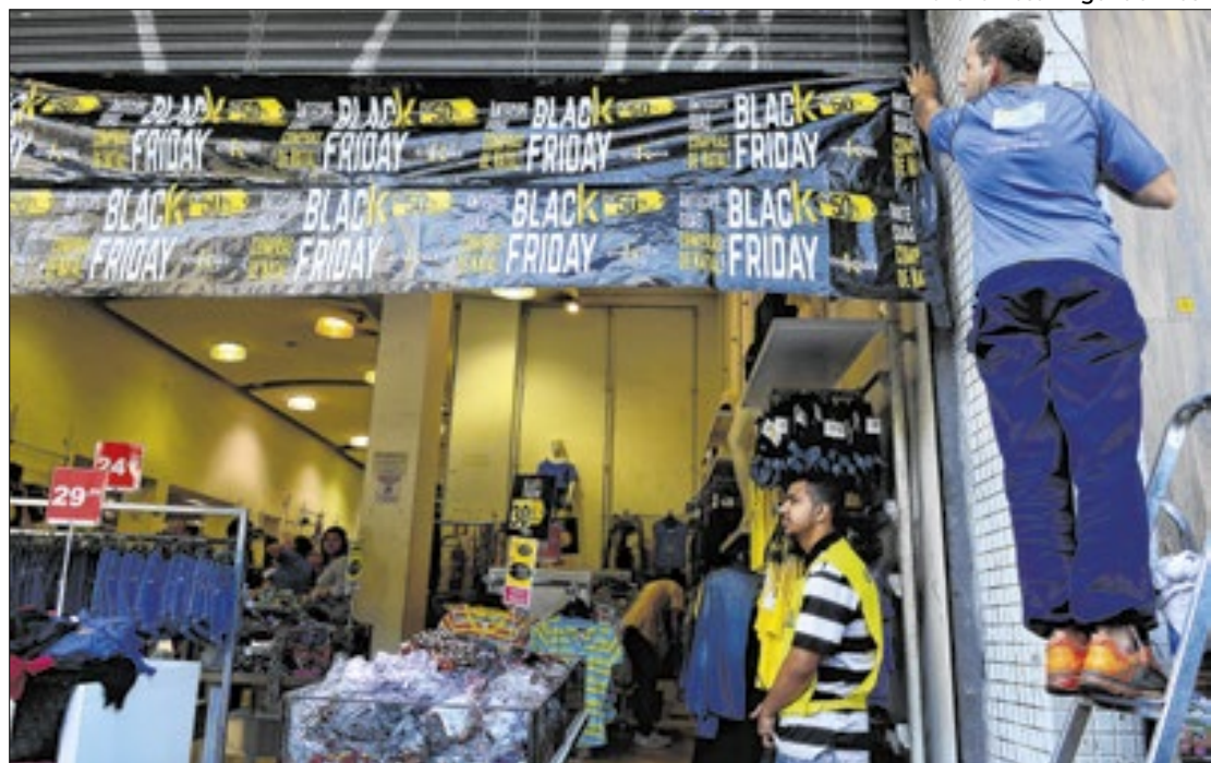
Black Friday: todo cuidado é pouco para evitar dissabores futuros na conta

Atenta às tentações promocionais, que escondem 'esperanças' financeiras de lojistas, a Secretaria de Estado de Defesa do Consumidor (Sedcon) e o Procon-RJ lançaram um 'alerta'