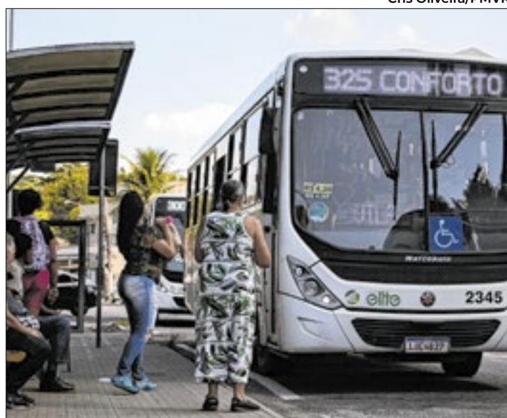
As linhas sob intervenção são a 415 e 450/450A

Um levantamento da STMU feito há poucas semanas mostrou que a Viação Pinheiral precisava ter 31 veículos - 28 para operar as linhas sob sua responsabilidade e três de reserva. A empresa,