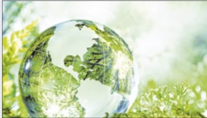
Contrato enfatiza financiamento de projetos estratégicos