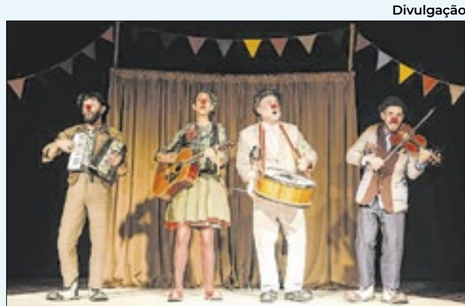
Temporada brinca com clássicos da literatura

inclui a campanha de vacinação contra a doença, exclusivamente para crianças e adolescentes de 10 a 14 anos. No sábado (23), a Superintendência de Vigilância Ambiental, Vetores e Zoonoses (SVAVZ) promove mutirões de combate ao mosquito Aedes aegypti , nos quatro distritos.