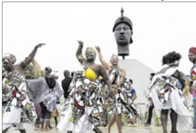
Apresentações marcaram primeiro feriado nacional da raça