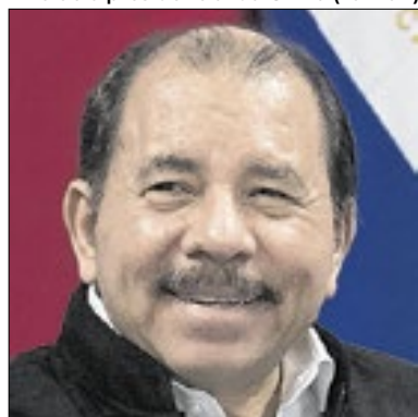
Ortega quer mudar a Constituição

O ditador da Nicarágua, Daniel Ortega, apresentou uma proposta de reforma da Constituição que busca expandir seu poder para outras áreas do regime. Ele prevê estender o mandato presidencial de cinco anos para seis; aumentar o controle do Estado sobre os meios de comunicação de modo a "impedi-los de serem submetidos a interesses estrangeiros"; e alterar formalmente o nome do cargo de vice-presidente para copresidente.