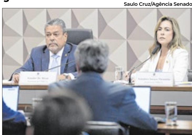
CPI examina o impacto dos patrocínios de plataformas de apostas esportivas

A apuração envolverá personalidades famosas. Nomes famosos na internet e nas redes sociais como Deolane Bezerra, Wesley Safadão, Jojo Todynho e Tirulipa estão entre os influenciadores convocados para prestar esclarecimentos. De acordo com a relatora da CPI, senadora Soraya Thronicke (Podemos-MS), os convocados terão direito ao silêncio e à assistência jurídica durante os depoimentos. A parlamentar também declarou esperar que o Supremo Tribunal Federal (STF) não conceda habeas corpus que impeçam os convocados de comparecer às oitivas, medida já adotada em outras investigações.