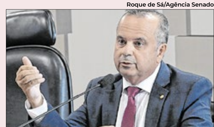
Senador admite que setores queriam “ação invasiva”

A agenda da comissão inclui novas oitivas com representantes do governo, da polícia e do setor privado. Além disso, os senadores pretendem aprofundar a investigação sobre a expansão das apostas online no Brasil e suas conexões internacionais. A CPI foi instalada em 12 de novembro e tem prazo de funcionamento até abril de 2025.