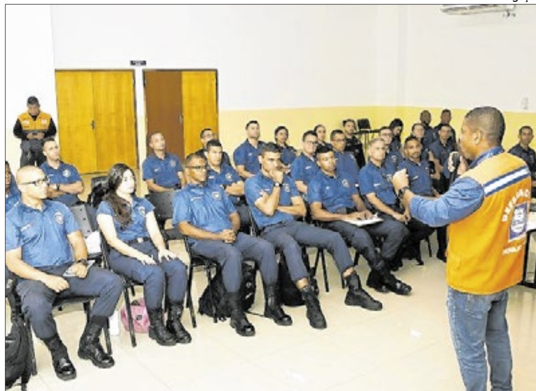
Objetivo é fazer com que a Guarda Municipal possa auxiliar todos os órgãos da Defesa Civil

Criada pela atual gestão do Poder Executivo, a GM, que teve suas duas primeiras turmas formadas este ano, se juntará aos agentes da Defesa Civil e também de outros setores, como a Secretaria Municipal de Assistência Social (SEMAS) na atuação em situações de possíveis desastres na cidade. Para isso, 61 guardas estão passando pelo Programa de Capacitação para Emergências em Desastres, promovido pela Prefeitura de Nova Iguaçu, por meio da Defesa Civil. O objetivo é fazer com que a Guarda Mu-