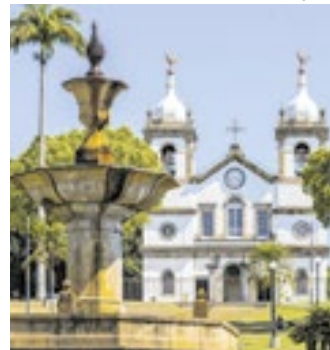
Centro de Vassouras