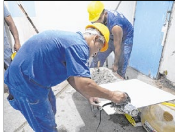
Unidades de saúde terão acessibilidade e climatização