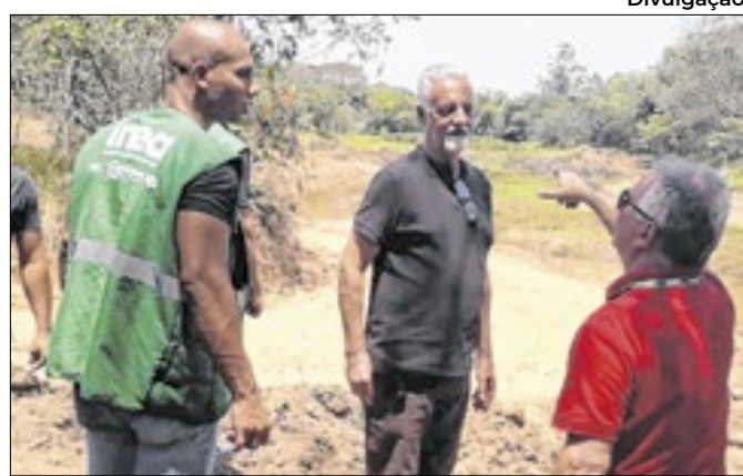
Município recebeu a visita da equipe do estado