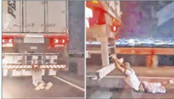
Imagens da web flagram cena insólita na Ponte