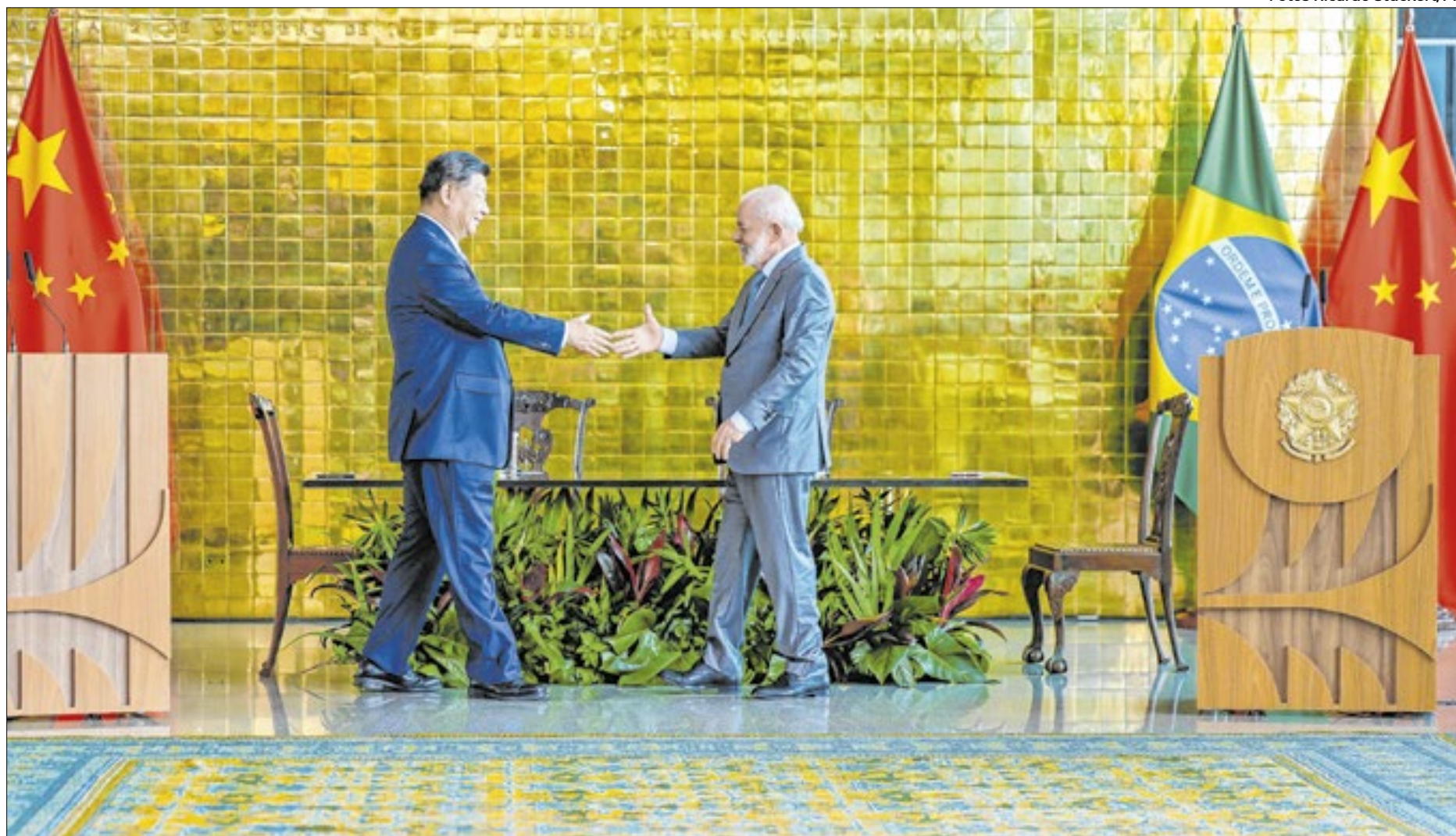
Presidente brasileiro, Luiz Inácio Lula da Silva, recebeu o presidente da China, Xi Jinping, nesta quarta-feira, no Palácio do Alvorada, em Brasília

"Estamos determinados a alicerçar nossa cooperação pelos próximos 50 anos em áreas como infraestrutura sustentável, transição energética, inteligência artificial, economia digital, saúde e aeroespacial. Por essa razão, estabeleceremos sinergias entre as estratégias brasileiras de desenvolvimento, como a Nova Indústria Brasil (NIB), o Programa de Aceleração do Crescimento (PAC), o