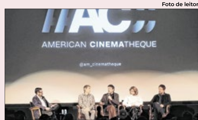
Equipe de “Ainda estou aqui” em Los Angeles

O longo tempo de cadeia determinado pelo STF tem sido um dos principais argumentos pela anistia. A mudança favorecerá os condenados, mas pouco aliviaria a situação de Bolsonaro, que, ao que tudo indica, receberá penas pesadas, por diferentes crimes.