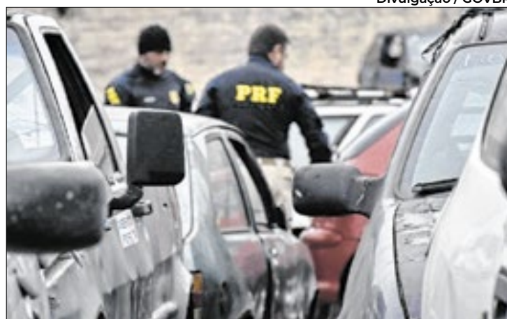
PRF realiza quarto leilão de veículos retidos de 2024 no RN