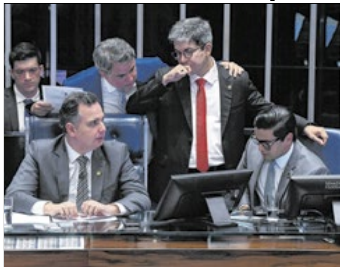
Votação aconteceu com a análise de destaques