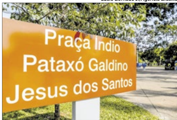
Praça foi reinaugurada em homenagem a indígena

sobre a história e o legado afro-brasileira, entendemos a importância de gerar emprego, renda e riqueza para a nossa comunidade”, reiterou.