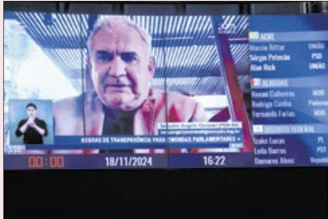
Relator pediu celeridade para liberação das emendas