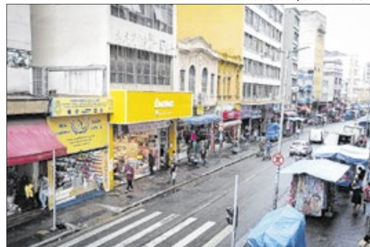
Estado registrou 6 meses com mais de 30 mil empresas abertas

Desenvolvimento Econômico, Jorge Lima, medidas como o acesso facilitado ao crédito e programas de apoio a micro e pequenos negócios têm sido fundamentais para consolidar o estado como o epicentro do empreendedorismo brasileiro. “São Paulo tem um potencial enorme para atrair novas empresas por vários motivos: boa logística, mercado consumidor potente, ambiente de negócios favorável, entre outros. Queremos desburocratizar cada vez mais este processo, como determina o governador Tarcísio de Freitas, para que os empreen-