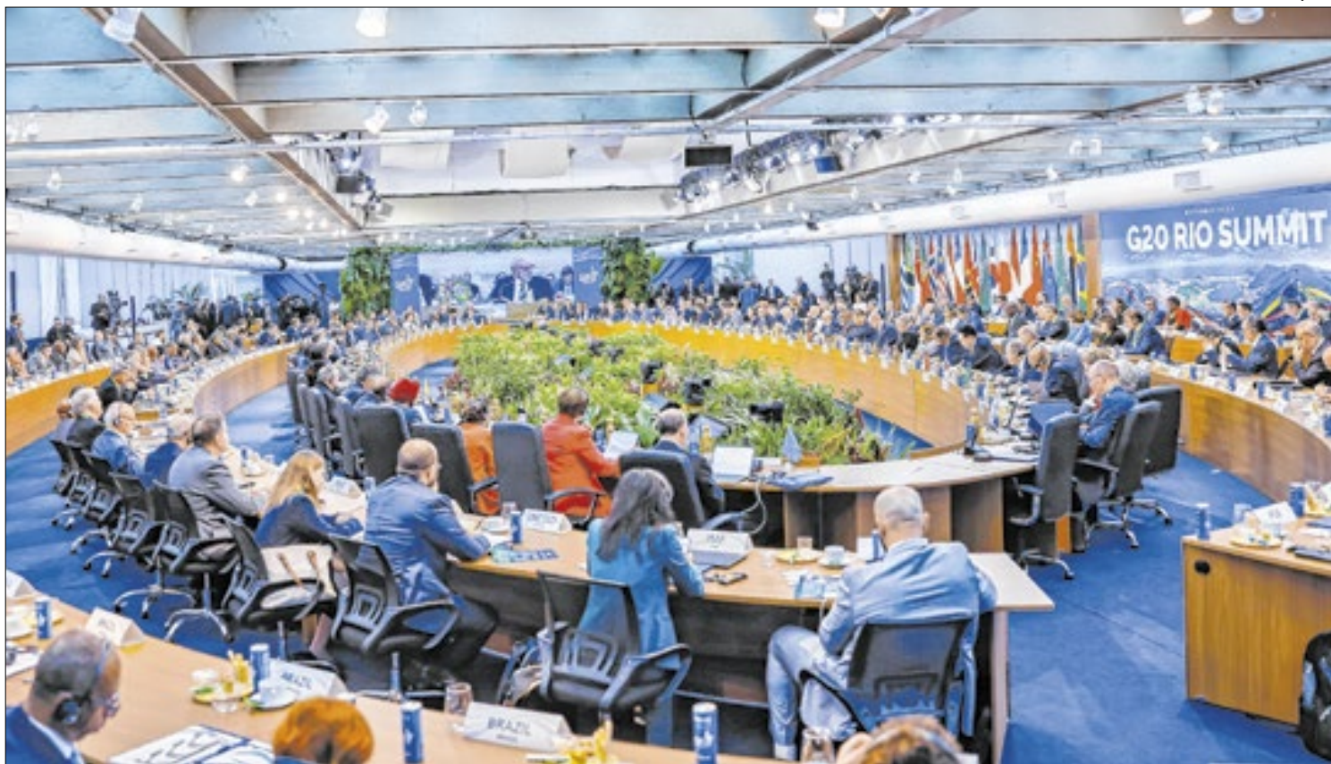
Das autoridades convidadas, apenas o presidente da Rússia não compareceu

o novo sistema de emendas ajude a garantir maior controle e transparência sobre o uso dos recursos destinados aos parlamentares, enquanto mantém a flexibilidade necessária para atender às demandas de diferentes regiões do país.