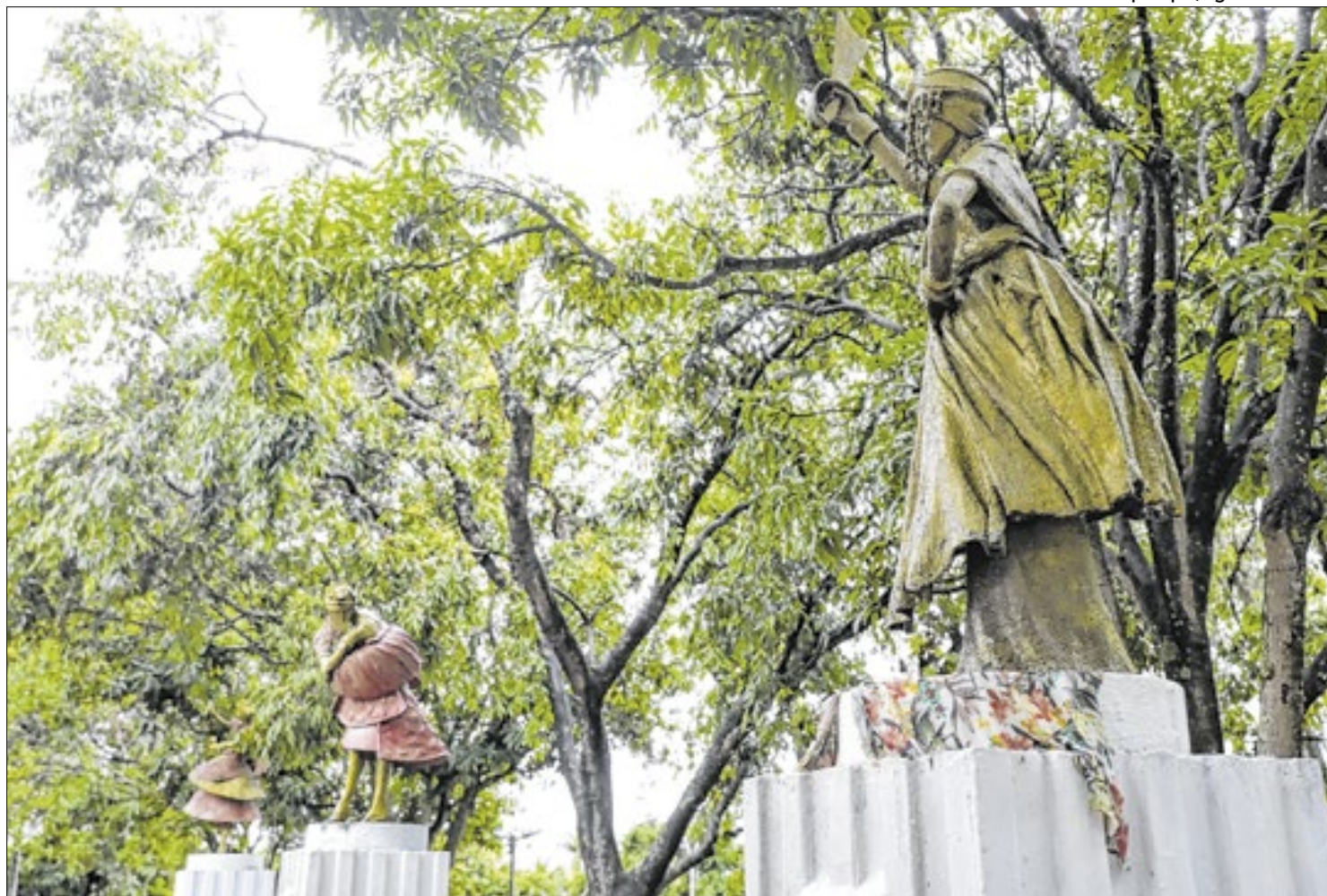
Praça dos Orixás é destaque em rota de afroturismo no DF

“Esse tipo de turismo oferece uma oportunidade de resgate e celebração das heranças culturais afrodescendentes, destacando a riqueza e a diversidade das contribuições da população negra para a construção da sociedade em diferentes regiões. Ao visitar locais de importância histórica e cultural, como quilombos, museus de cultura afro, comunidades e eventos ligados à tradição de matriz africana, os visitantes conseguem compreender de forma mais profunda a resistência, a luta por direitos e a resiliência do povo negro ao longo dos séculos”, completou.