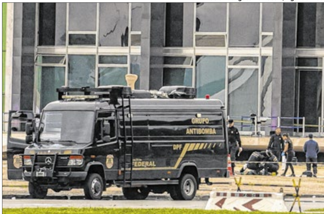
Policiais, do grupo antibomba da PF, periciando o corpo em frente do Supremo

Segundo o cientista político, o ataque afetou diretamente o debate sobre o PL da Anistia (PL 2858/2022), que perdeu força com o ocorrido. Ele acredita que não haverá mais discussões e votações sobre o projeto neste ano.