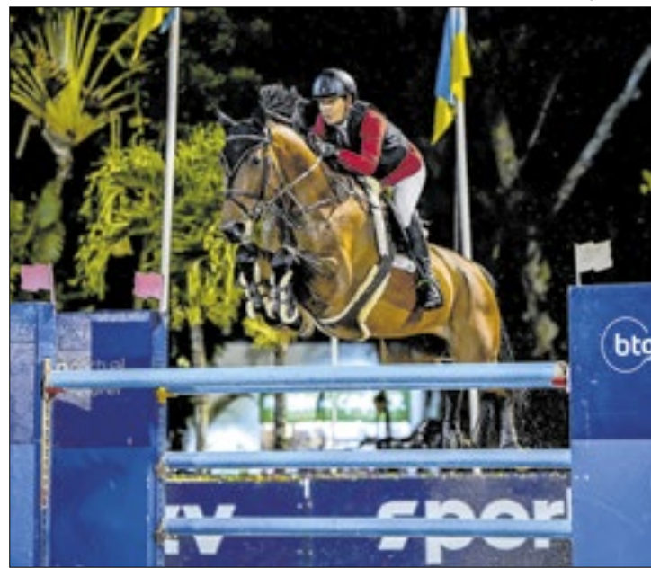
Estrela do salto, Luciana Lóssio se juntará aos atletas no evento

e Luciana Lóssio se somarão aos "cavaleiros da casa" (SHB), como os multicampeões Rodrigo Lima, Thiago Mattos, Tiago Mesquita, entre outros destaques do hipismo de saltos no Rio de Janeiro.