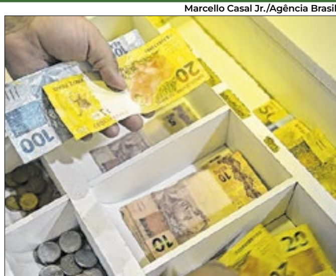
A Bahia na Região Nordeste teve variação positiva

O destaca está no aumento dos rendimentos das famílias rurais