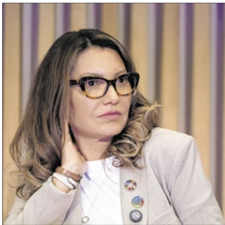
“Fuck you, Elon Musk”, dispara Rosângela Lula da Silva

Durante uma mesa de debates sobre combate à desinformação, realizada no evento CRIA G20, a primeira-dama