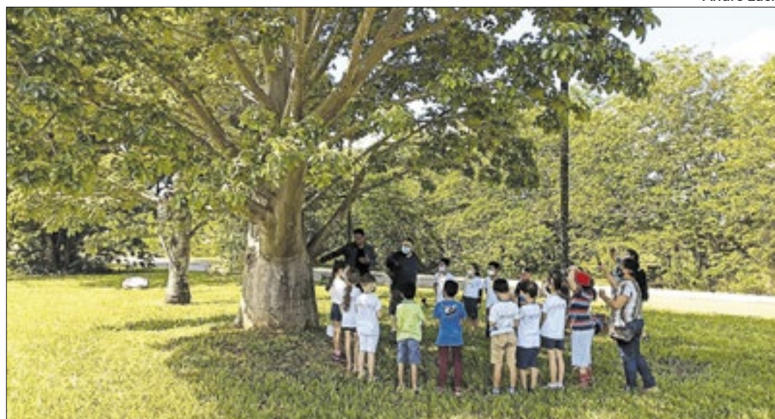
Baobás são árvores sagradas para o povo africano