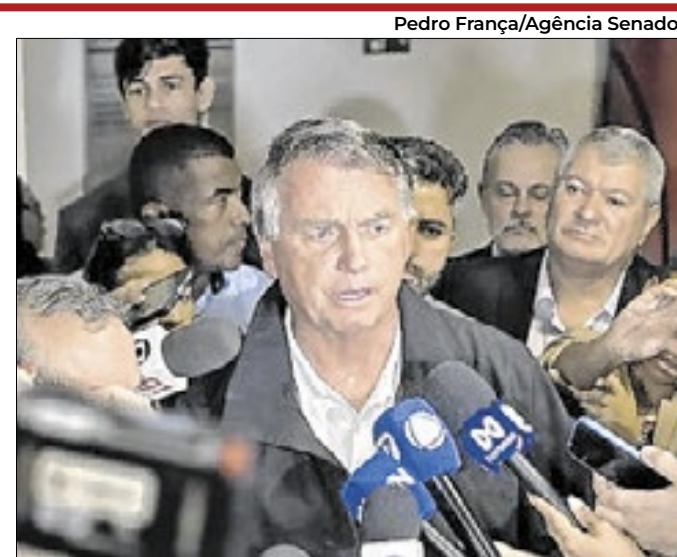
Em outubro, Bolsonaro foi ao Senado discutir anistia