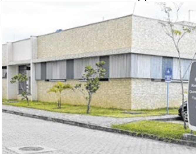
Bloco de Oncologia do Hospital Regional do Litoral Norte