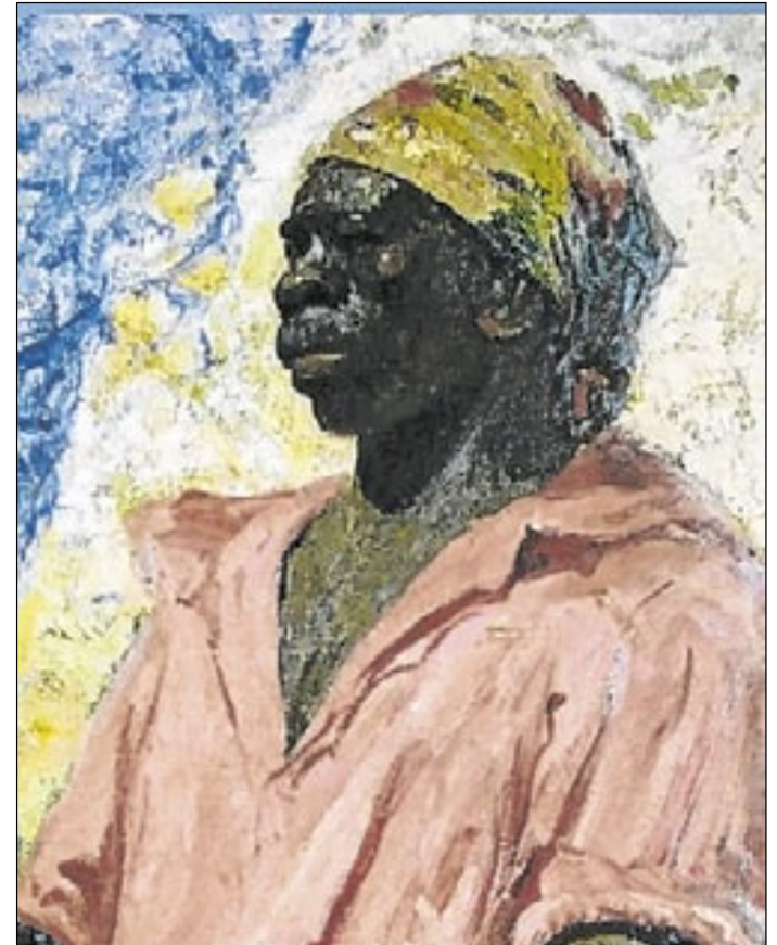
Detalhe da obra “Zumbi”, de 1927. Pintura de Antônio Parreiras em óleo sobre tela

o certificado de abertura aos domingos e feriados, a fim de evitar penalidades. Todas as regras referentes ao trabalho em dia de feriado, como a jornada de trabalho e a remuneração dos funcio-