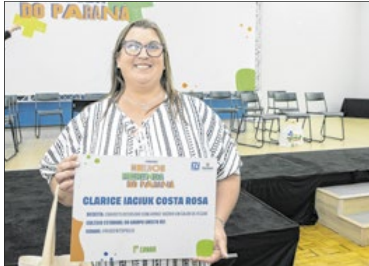
Paraná premia o Concurso 'A Melhor Merenda do Paraná'

Motivadas pela missão de servir da melhor maneira possível os alunos da rede estadual de ensino, quatro cozinheiras foram premiadas nesta segunda-feira (18) no Concurso da Melhor Merenda Escolas do Paraná. Mesmo com histórias de vida e inspirações diferentes, todas têm em comum a dedicação à profissão e a criatividade para elaborar receitas inovadoras com ingredientes nutritivos e saborosos para os estudantes paranaenses.