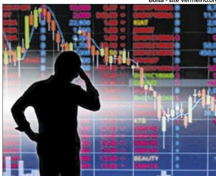
Bolsa - site Vermelho.org

O principal índice da B3 fechou aos 127.768,19 pontos (-0,02%), após máxima de 128.277,27 pontos (+0,38%) e mínima de 127.226,37 pontos (-0,44%). O giro financeiro foi de R$ 22,6 bilhões.