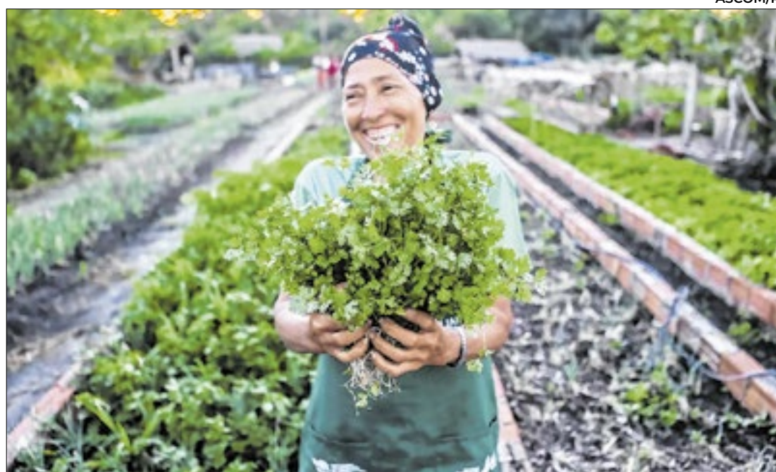
O levantamento aponta que o Piauí é o estado mais rural do Brasil

A PetroRecôncavo anunciou um investimento de US$ 60 milhões (R$ 340 milhões) em uma nova Unidade de Processamento de Gás Natural em Miranga, Pojuca, na Bahia. O aporte faz parte de um total de R$ 4 bilhões para revitalizar campos maduros de petróleo no estado.