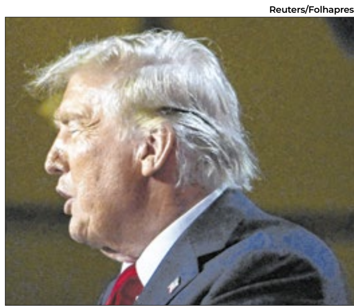
Donald Trump vai cumprir sua promessa de campanha

O republicano já afirmou que o plano de expulsar imigrantes do país será uma de suas prioridades à frente do governo. Ele também indicou que irá