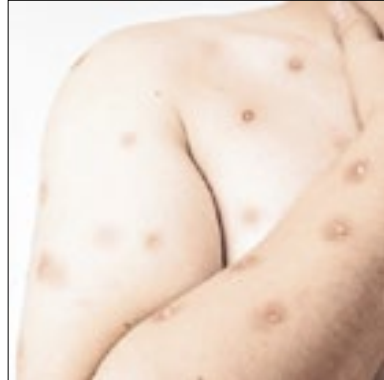
OMS quer reavaliar o Mpx

Um comitê para avaliar a situação mundial da Mpx foi convocado pela OMS (Organização Mundial da Saúde) para a próxima sexta (22). A reunião pretende mensurar a dimensão da doença no mundo.