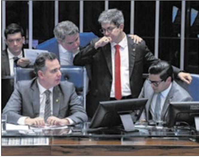
Votação aconteceu com a análise de destaques