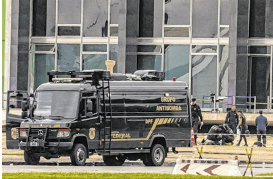
Policiais, do grupo antibomba da PF, periciando o corpo em frente do Supremo

Segundo o cientista político, o ataque afetou diretamente o debate sobre o PL da Anistia (PL 2858/2022), que perdeu força com o ocorrido. Ele acredita que não haverá mais discussões e votações sobre o projeto neste ano.