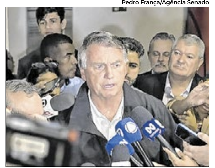
Em outubro, Bolsonaro foi ao Senado discutir anistia