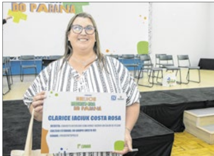
Paraná premia o Concurso 'A Melhor Merenda do Paraná'

Motivadas pela missão de servir da melhor maneira possível os alunos da rede estadual de ensino, quatro cozinheiras foram premiadas nesta segunda-feira (18) no Concurso da Melhor Merenda Escolas do Paraná. Mesmo com histórias de vida e inspirações diferentes, todas têm em comum a dedicação à profissão e a criatividade para elaborar receitas inovadoras com ingredientes nutritivos e saborosos para os estudantes paranaenses.