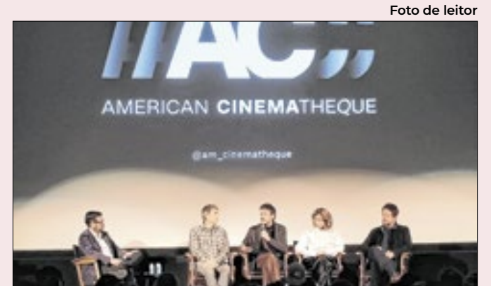
Equipe de “Ainda estou aqui” em Los Angeles

O longo tempo de cadeia determinado pelo STF tem sido um dos principais argumentos pela anistia. A mudança favorecerá os condenados, mas pouco aliviaria a situação de Bolsonaro, que, ao que tudo indica, receberá penas pesadas, por diferentes crimes.