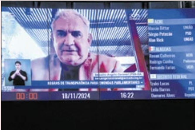
Relator pediu celeridade para liberação das emendas