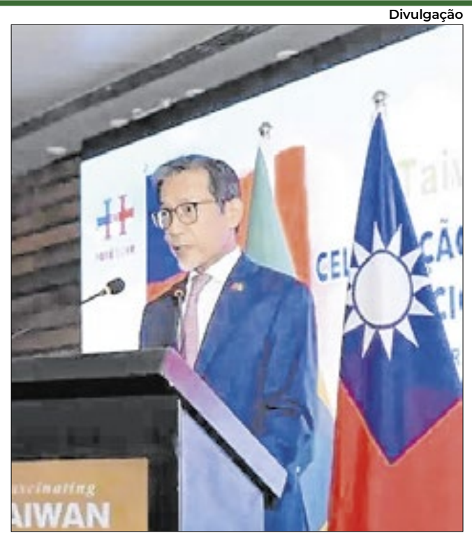
Compromisso de Taiwan por um mundo mais resiliente