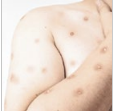
OMS quer reavaliar o Mpx

Um comitê para avaliar a situação mundial da Mpx foi convocado pela OMS (Organização Mundial da Saúde) para a próxima sexta (22). A reunião pretende mensurar a dimensão da doença no mundo.