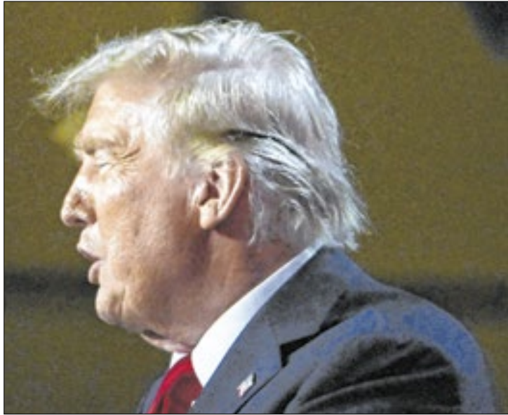
Donald Trump vai cumprir sua promessa de campanha

O presidente eleito Donald Trump insinuou que pode declarar estado de emergência e usar militares para pôr em prática seu plano de deportar imigrantes em situação irregular nos Estados Unidos.