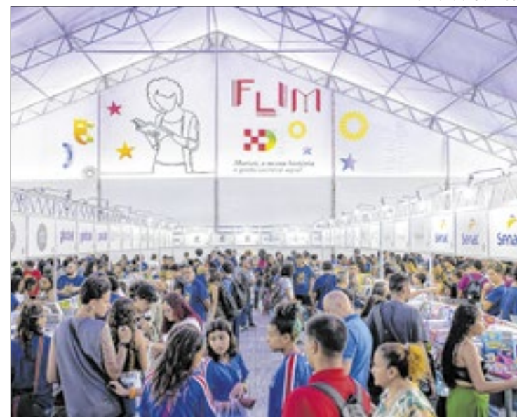
Feira teve aumento de 35% de público em relação a 2023