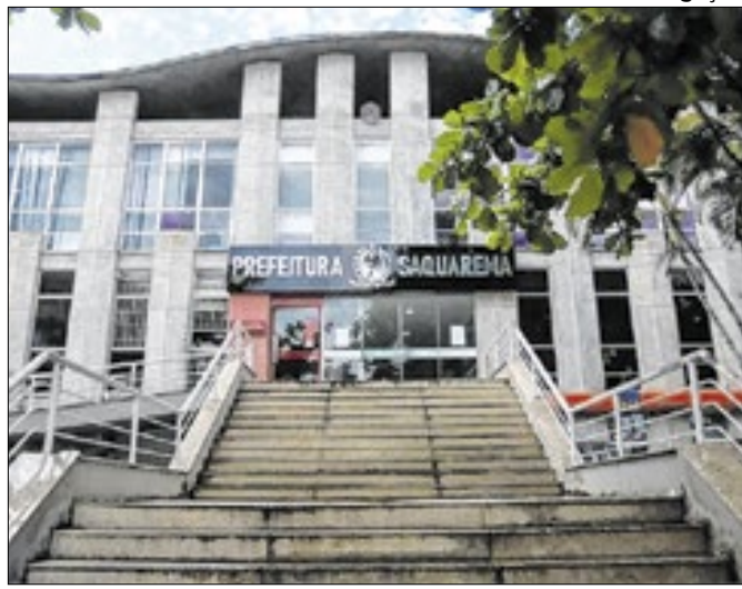
Sede da Prefeitura Municipal de Saquarema