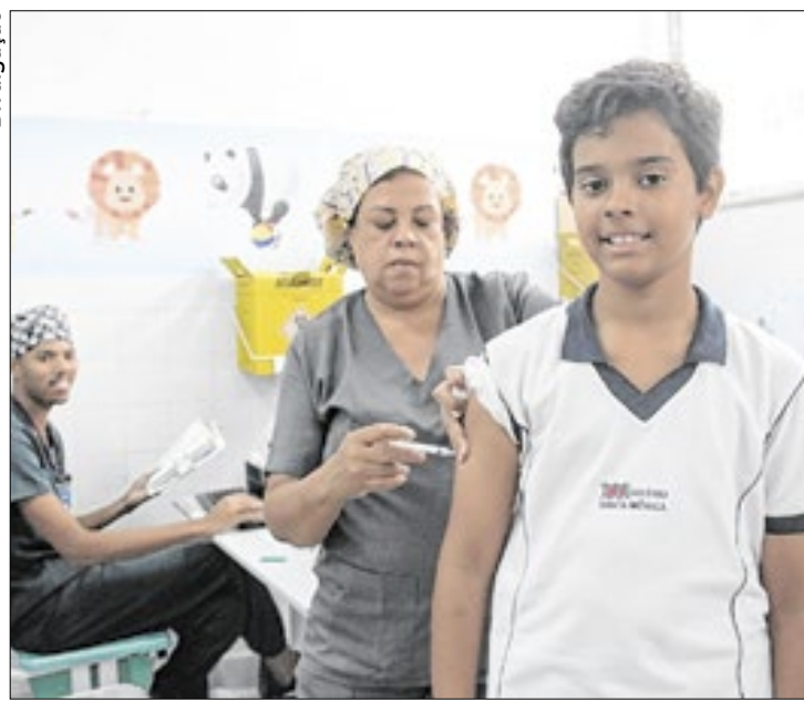
Imunizante está disponível em 38 pontos de atendimento

Por meio da Secretaria de Educação, a Prefeitura investiu mais de R$ 12 milhões no incentivo à leitura: 60.800 pessoas, entre alunos, professores, aposentados da rede pública de ensino e beneficiários dos programas educacionais do município, receberam as "Mumbucas Literárias", vouchers de R$ 200 para a compra de livros. Cada beneficiário ganhou a oportunidade de adquirir, pelo menos, quatro obras literárias.