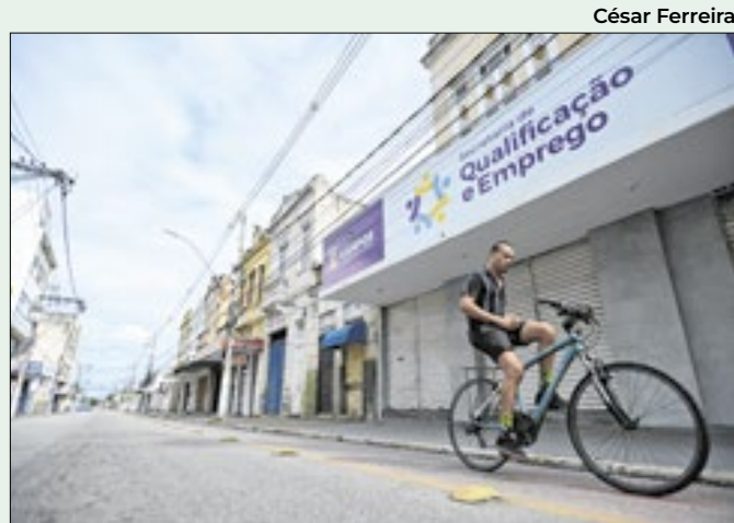
Secretaria agora conta com novo endereço

líderes das maiores economias do mundo. O G20 Social é um evento inédito que tem como objetivo ampliar a participação não-governamental nas atividades e nos processos decisórios do Grupo dos 20 e que visa garantir espaço para as diferentes vozes e reivindicações.