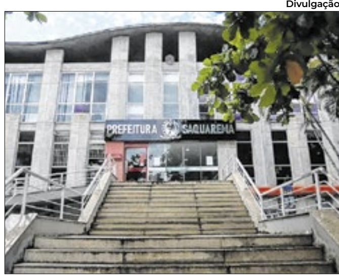
Sede da Prefeitura Municipal de Saquarema