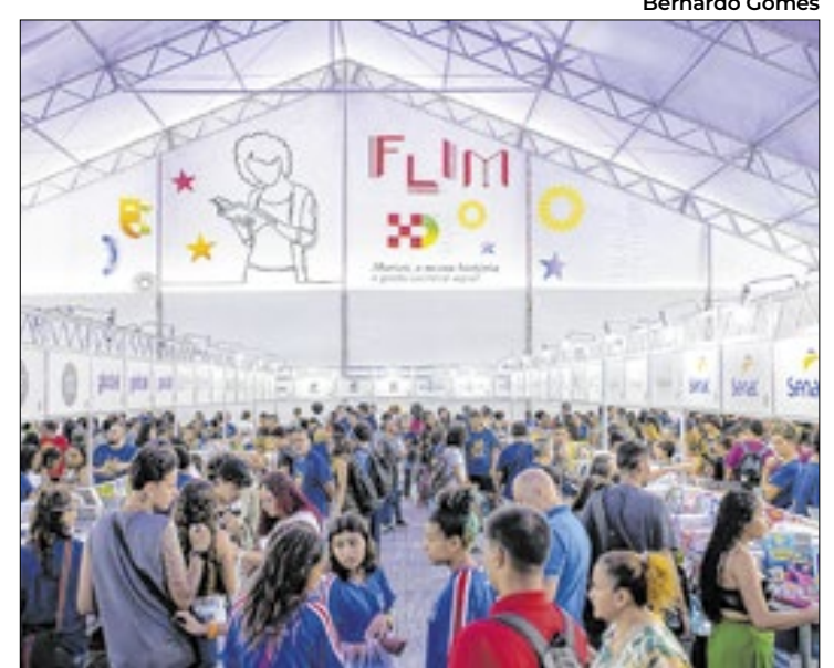
Feira teve aumento de 35% de público em relação a 2023