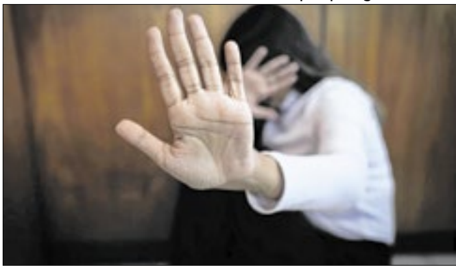
Campanha reúne mulheres e profissionais do município