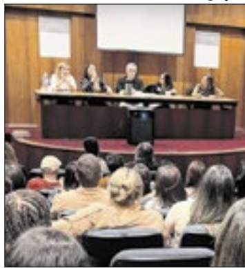
Foco em saúde mental

A Rede de Atenção Psicossocial, órgão da Secretaria de Saúde da Prefeitura de Nova Friburgo, recebeu os participantes do Fórum Regional da Região Serrana na última quinta-feira (14), no auditório da Secretaria Municipal de Educação, no centro da cidade.