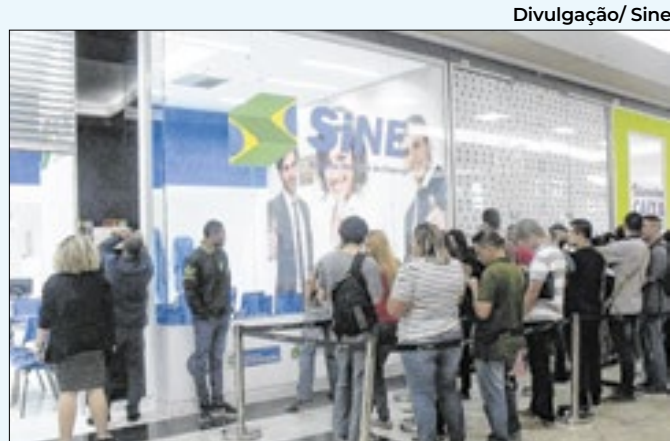
Mais de dez vagas são oferecidas à população

Auxiliar de serviços gerais. Os interessados em participar do processo seletivo devem enviar seus currículos para o e-mail: bancodedadosgreco@gmail.com .