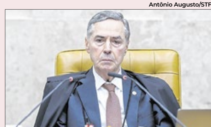
Barroso classificou de criminosas falas contra urna

“O ‘chip da beleza’ não é utilizado apenas para fins estéticos, mas também tem sido prescrito por médicos em casos de tratamentos hormonais específicos, a exemplo do hipogonadismo, puberdade tardia e transtornos sexuais hipotativos em mulheres. Nesses contextos, a literatura científica reconhece a eficácia e a segurança dos tratamentos hormonais, embora enfatize que isso não deva justificar o uso indiscriminado dos implantes para objetivos estéticos. A proibição irrestrita pode gerar descontinuidade em tratamentos legítimos, prejudicando pacientes que dependem desses implantes para melhorar sua qualidade de vida”, defendeu o senador.