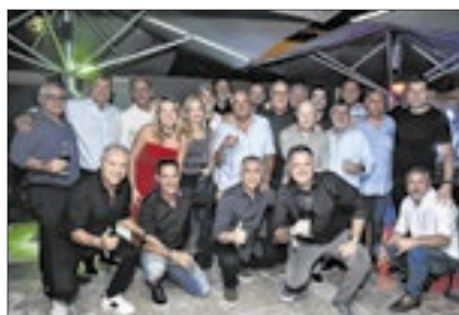
Turma da Cúpula, representando o turismo, estiveram presente