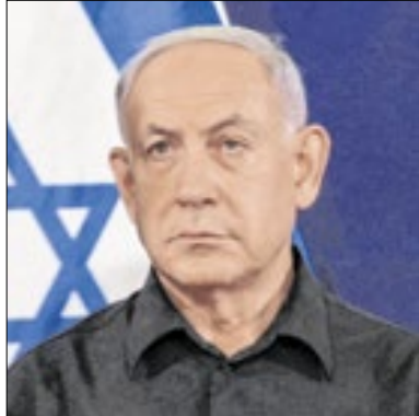
Sinalizadores atingiram a casa

Três pessoas foram presas após dispararem sinalizadores perto da residência do primeiro-ministro de Israel, Benjamin Netanyahu, na noite deste sábado (16). Os artefatos caíram na área externa da residência de Benjamin Netanyahu