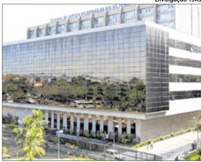
Decisão da Justiça garante funcionamento da universidade