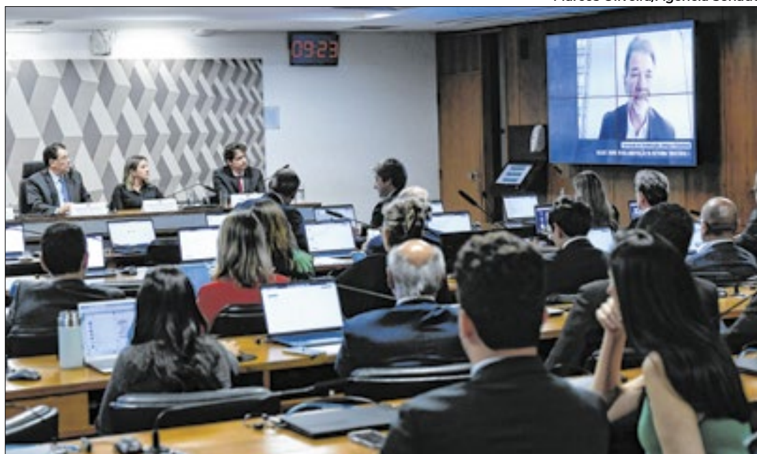
CCJ debate impactos no setor imobiliário, Zona Franca de Manaus e para MEIs

Ainda nesta segunda, a Comissão de Constituição e Justiça (CCJ) do Senado Federal realiza, às 14h30, uma nova audiência para discutir o projeto de lei