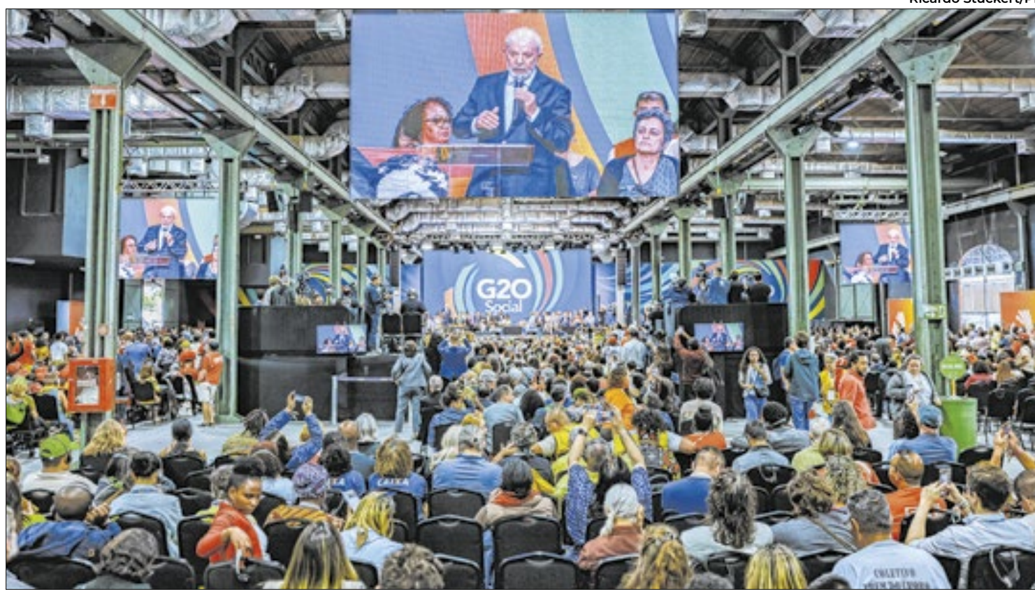
Presidente Lula durante a sessão de encerramento do G20 Social

O G20 Social, uma inovação implementada pelo governo brasileiro, integrou movimentos sociais e organizações não governamentais à agenda