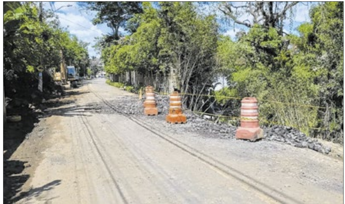
Em decorrência da chuva, um trecho da Avenida Ayrton Sena, em Resende, cedeu

No sábado (16), ele acompanhou o trabalho das equipes da prefeitura, entre Defesa Civil, Agência do