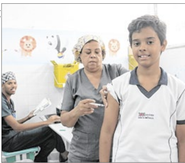
Imunizante está disponível em 38 pontos de atendimento