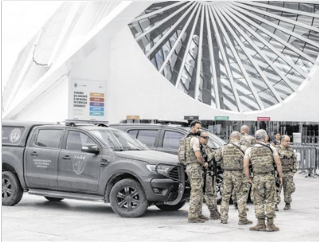
Esquadrão Antibomba da Coordenadoria de Recurso Especiais (CORE)