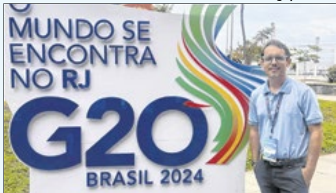
Concurso fez parte da programação do evento no Rio