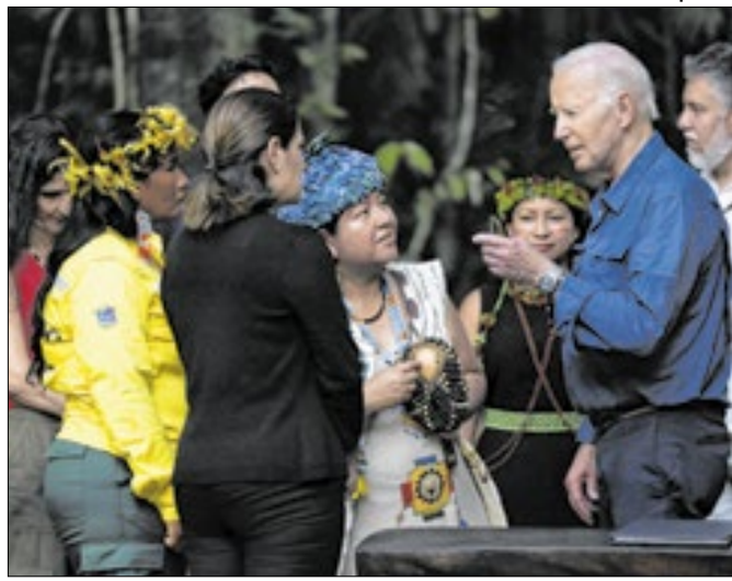
Presidente dos EUA, Joe Biden, em Manaus