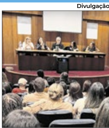
Foco em saúde mental

A Rede de Atenção Psicossocial, órgão da Secretaria de Saúde da Prefeitura de Nova Friburgo, recebeu os participantes do Fórum Regional da Região Serrana na última quinta-feira (14), no auditório da Secretaria Municipal de Educação, no centro da cidade.