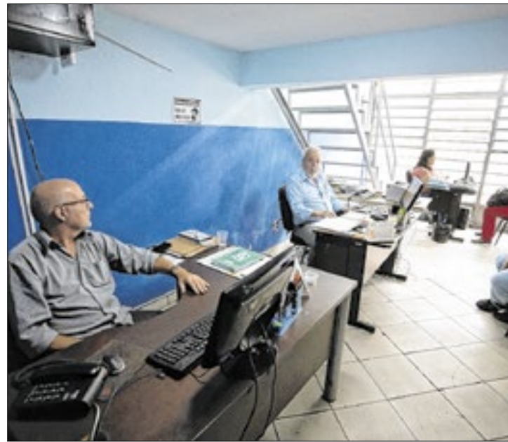
Campanha do órgão municipal visa ajudar consumidores

Entre as principais recomendações do Procon-VR,