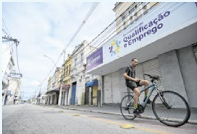
Secretaria agora conta com novo endereço