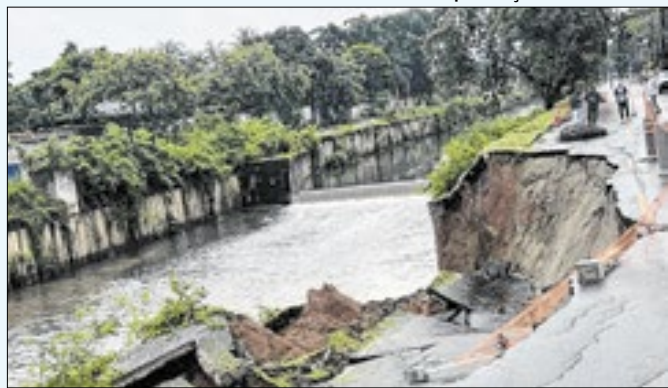
Excesso de chuvas causou desmoronamento de contenção