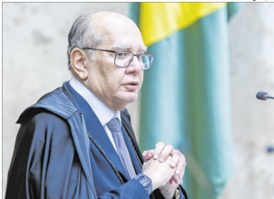
Atualmente, o placar está 4 a 1 para manter a prisão

“O STJ, no exercício de sua competência constitucional, deu cumprimento à Constituição e às leis brasileiras, aos acordos firmados pelo Brasil em matéria de cooperação internacional e às normas que regem a matéria, com especial