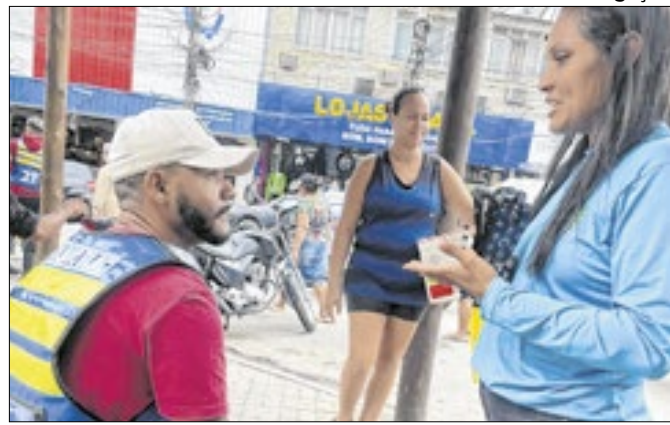
Ação aconteceu na Praça Vereador Wendel Coelho