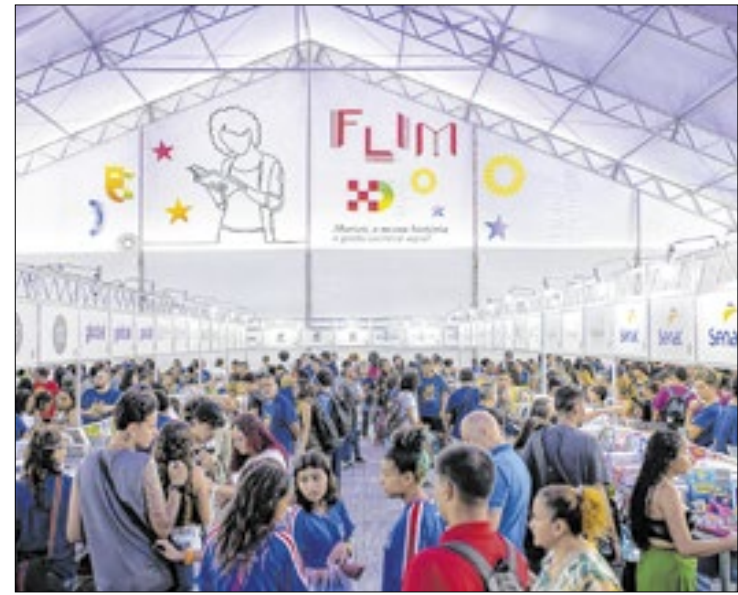
Feira teve aumento de 35% de público em relação a 2023