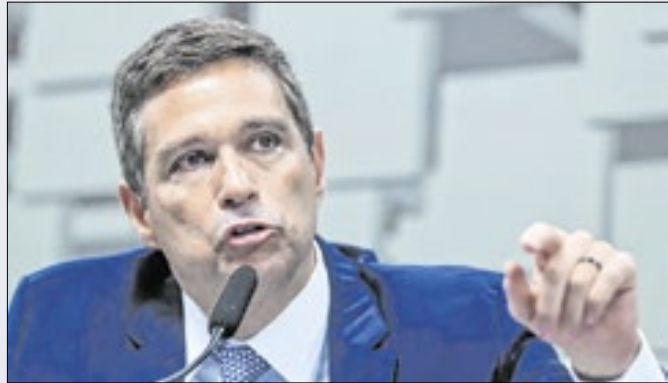
Chefe do BC sugere 'corte de gastos na carne' em 2025