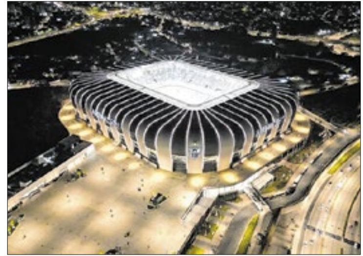
Arena MRV, casa do Atlético-MG, foi interditada pelo STJD

A decisão exige que o Atlético-MG realize seus jogos como mandante em outro estádio e com portões fechados até comprovar a implementação de medidas de segurança.