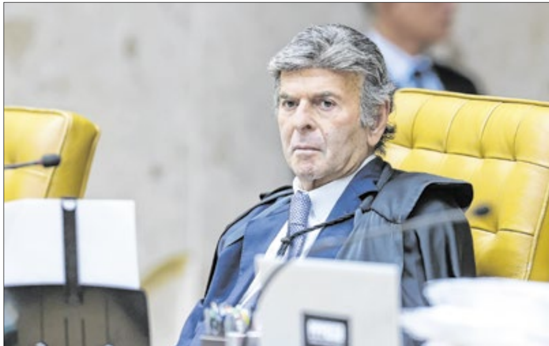
Decisão de Fux foi referendada pela Corte

Os demais ministros da Corte — Alexandre de Moraes, Edson Fachin, Cristiano Zanin, Cármen Lúcia, Gilmar Men-