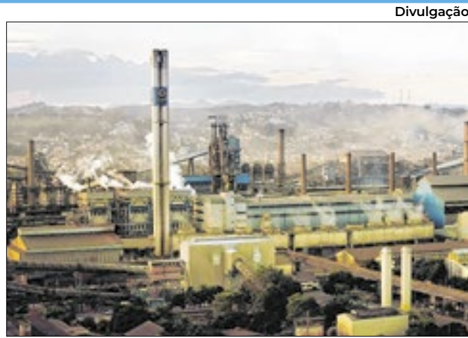
Cadastro pode ser feito no portal da companhia