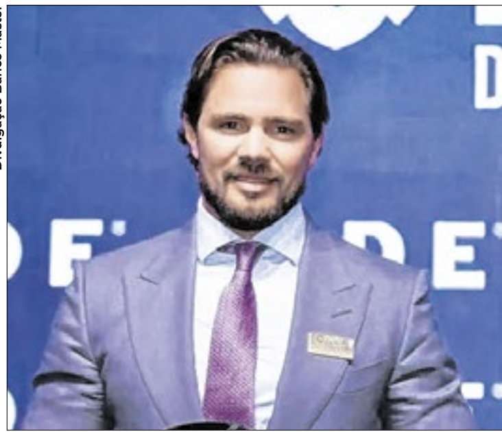
Vorcaro: após 'grau de investimento', meta é captação externa