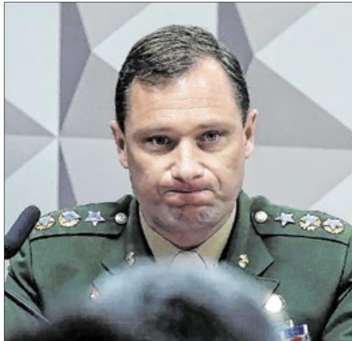
Militar pode perder benefícios da delação premiada

O tenente-coronel foi preso pela primeira vez em 3 de maio