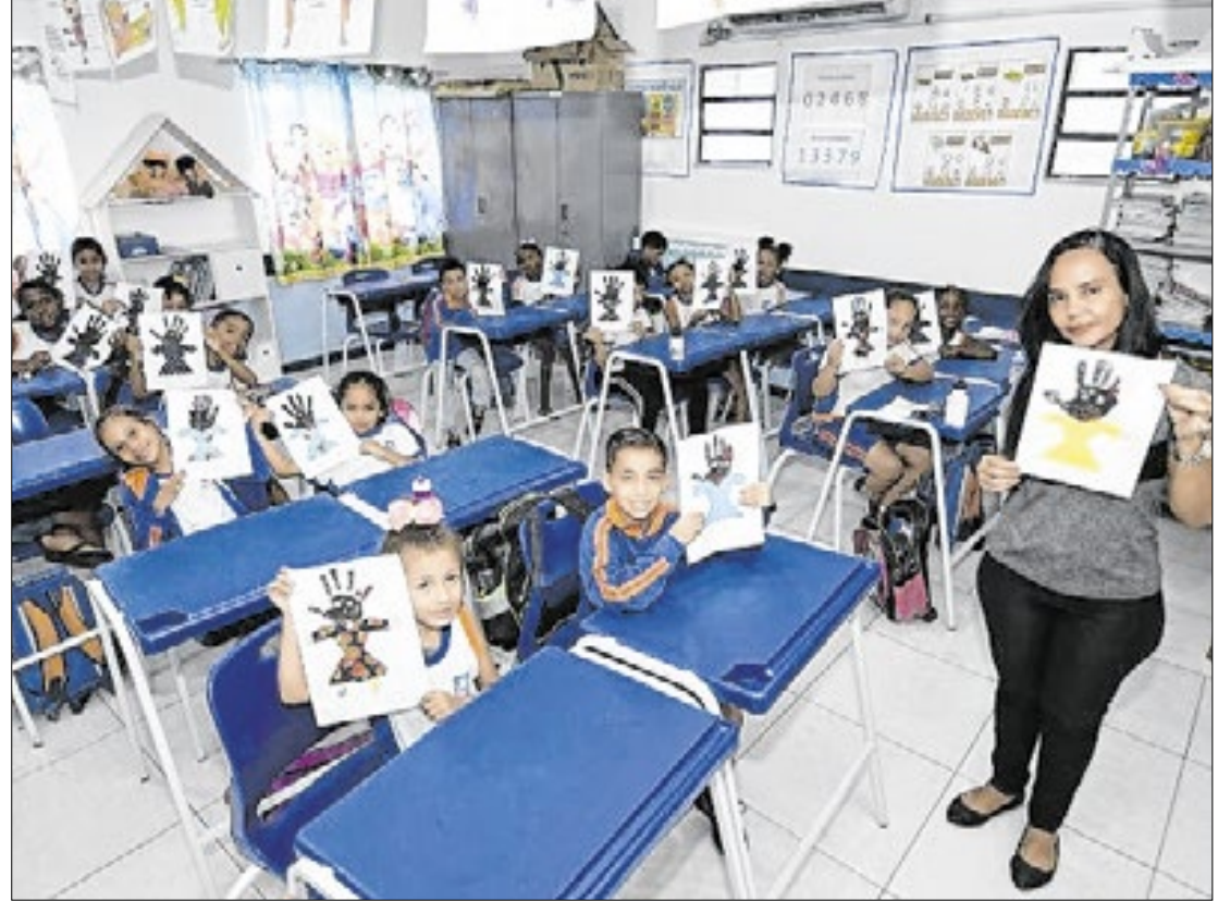
Escola Municipal Maria Eliondas dos Santos é uma das 148 da rede municipal de ensino