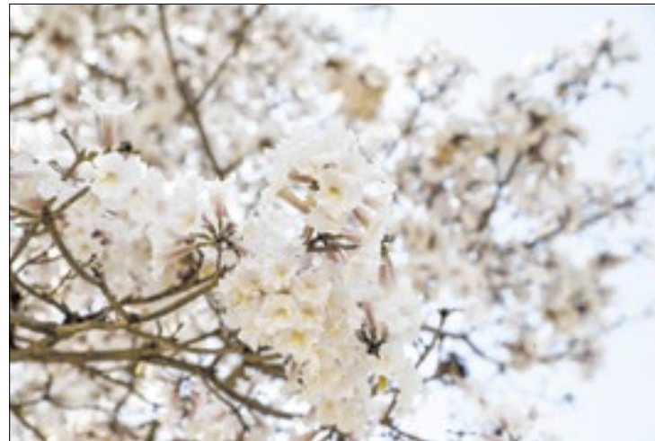
Variações climáticas potencializam o risco de transmissão