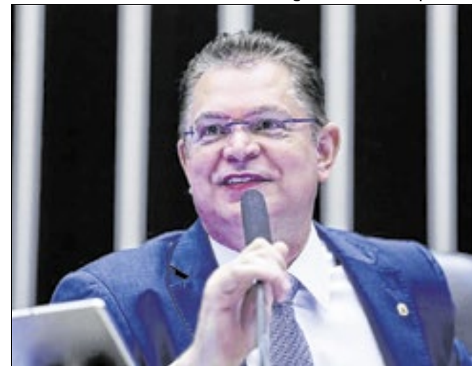
Para Sóstenes, é preciso deixar o tema esfriar