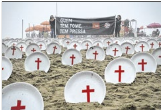
Manifestação serve para realçar tamanho da dívida global