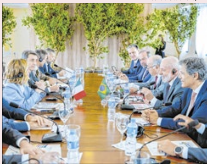
Reunião aconteceu neste domingo, no Rio