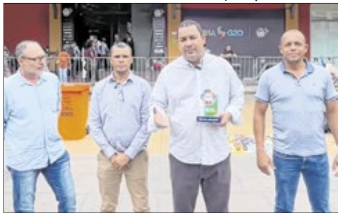
Paraty recebeu premiação por saneamento básico