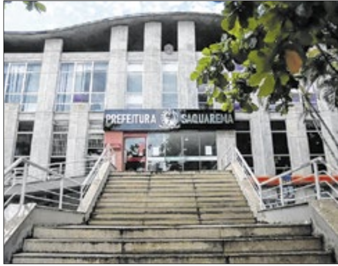
Sede da Prefeitura Municipal de Saquarema