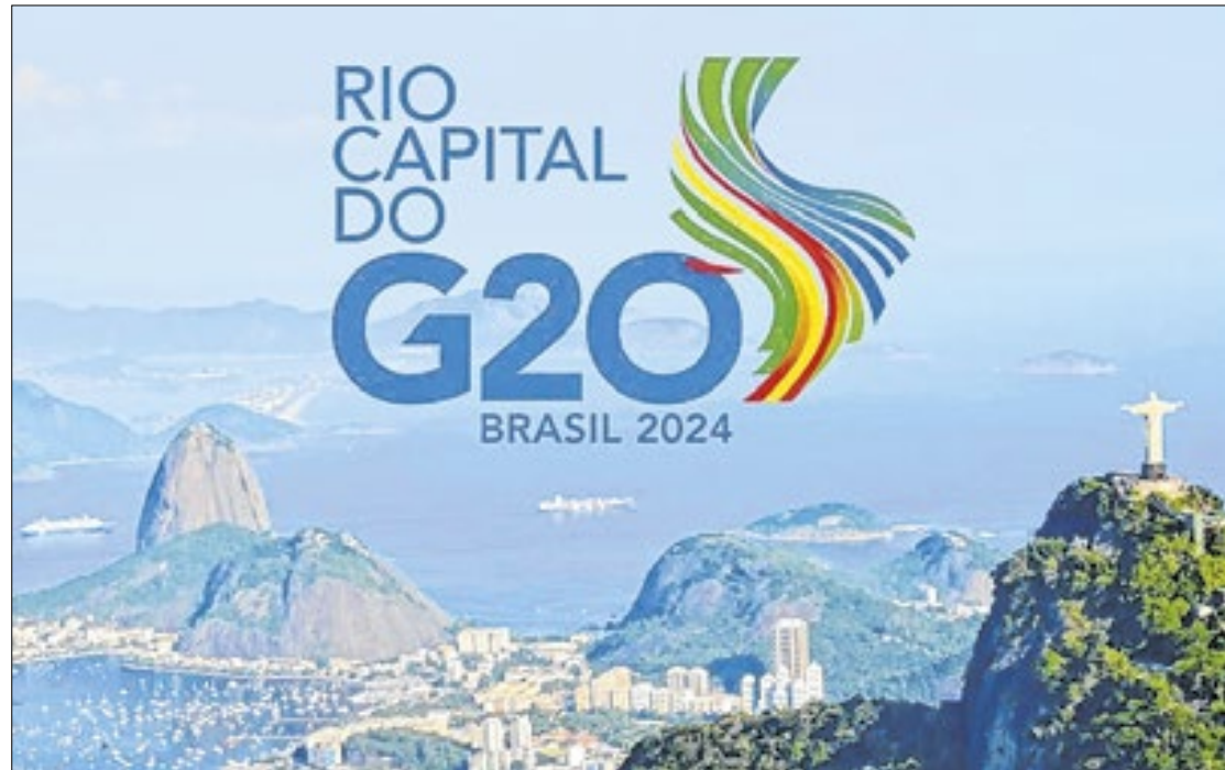
Maior evento internacional do ano demandará mobilização militar histórica

cia Rodoviária Federal (PRF) vai dispor de 430 motociclistas, que servirão de batedores, durante o deslocamento das autoridades, além de manter policiais nas principais vias de acessos e nos locais do evento. Ao todo, a corporação contará com 924 policiais envolvidos em ações, munidos de câmaras. A operação compreenderá, ainda, 105 viaturas, dez caminhões, cinco ambulâncias e dois helicópteros.