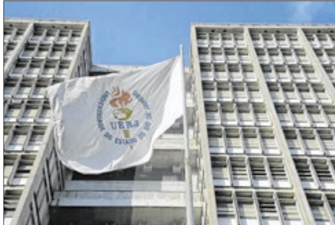
Carência de alternativa energética afeta universidade