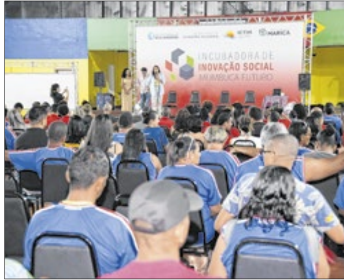
Evento reuniu estudantes e empreendedores