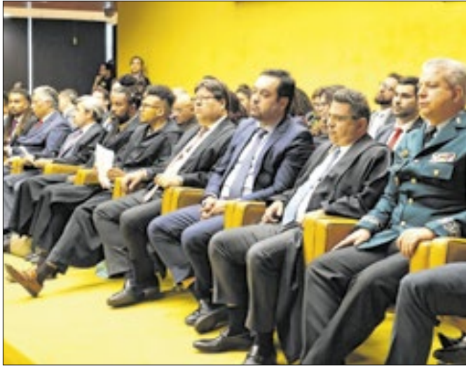
Governador acompanhou início do julgamento da ação