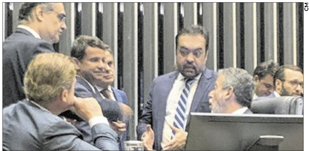
O governador Cláudio Castro em jornada de corpo a corpo no Congresso Nacional. Ele tem falado diariamente com o presidente da Câmara, Arthur Lira, sobre segurança nacional e acompanhará, no STF, a votação da ADPF 635, que restringe a atuação da polícia nas comunidades. No Senado, o corpo a corpo foi também sobre segurança.