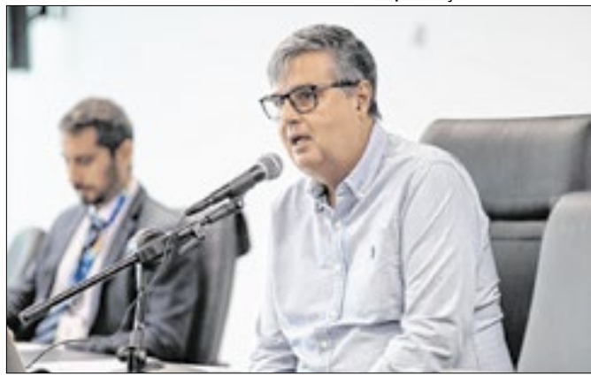
Parlamentar comemorou resultado nas redes sociais