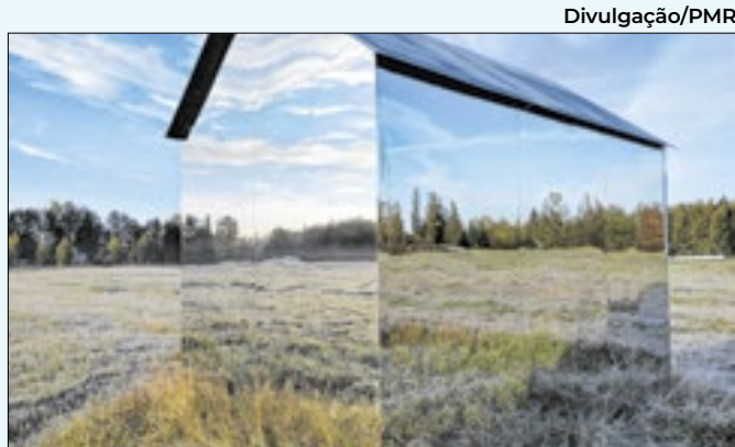
Mostra fica disponível até o dia 20 de dezembro

zes de construir desafios de ensino através do celular; e o "Bengala Inteligente", com uma bengala funcional com sensores que trazem benefícios únicos para pessoas com deficiência.