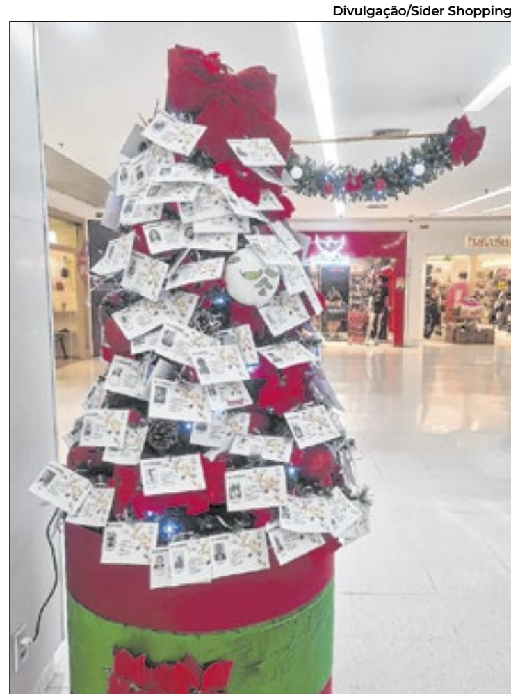
Campanha beneficia pessoas e animais em vulnerabilidade

- Queremos proporcionar um Natal mais acolhedor e solidário. Ver as pessoas e famílias se unindo para ajudar é inspirador, e isso faz parte do nosso com-