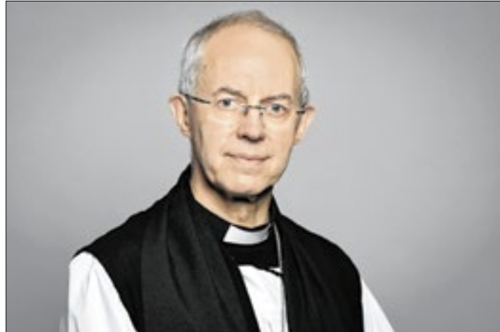
O arcebispo da Cantuária, Justin Welby, renunciou ao cargo

O arcebispo da Cantuária, Justin Welby, renunciou ao cargo de chefe da Igreja Anglicana nesta terça-feira (12). O anúncio foi feito dias depois que um relatório criticou a atuação do religioso no que é considerado o pior caso de abuso infantil dentro da instituição.