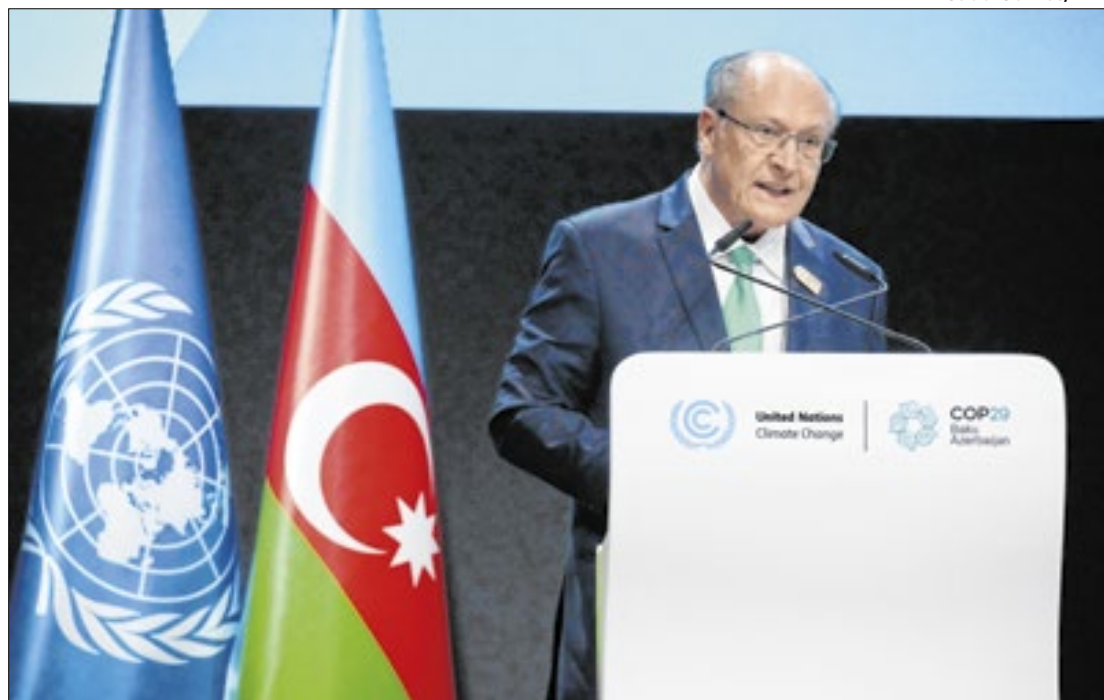
Vice-presidente liderou a delegação brasileira no evento

Durante sua fala, o vice-presidente classificou como "ambiciosa" a nova Contribuição Nacional Determinada (NDC) sobre a meta do Brasil para a redução de gases de efeito estufa (GEE). A meta prevê uma redução de 59% a 67% das emissões até 2035, em comparação aos níveis de 2005. O governo brasileiro apresentou a proposta na última sexta-feira (8), com a expectativa de que as emissões totais de GEE variem entre 850 milhões e 1,05 bilhão de toneladas. O anúncio oficial será feito nesta quarta-feira (13),