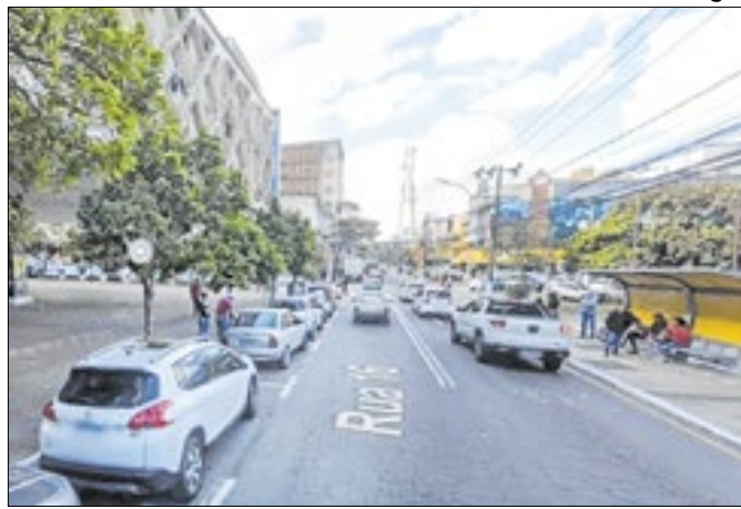
Obra terá duração de pelo menos três dias