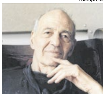
Frank Auerbach faleceu aos 93 anos