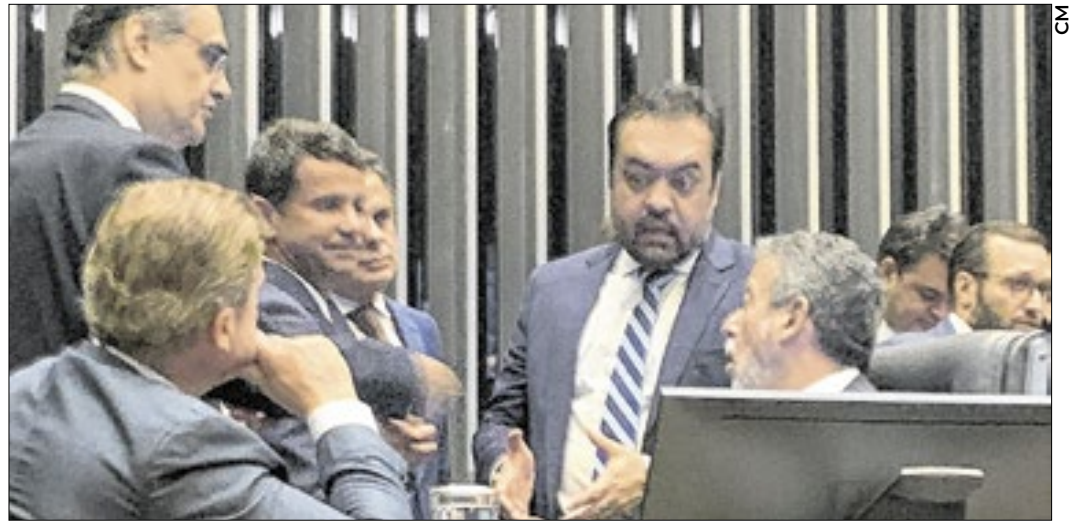
O governador Cláudio Castro em jornada de corpo a corpo no Congresso Nacional. Ele tem falado diariamente com o presidente da Câmara, Arthur Lira, sobre segurança nacional e acompanhará, no STF, a votação da ADPF 635, que restringe a atuação da polícia nas comunidades. No Senado, o corpo a corpo foi também sobre segurança.