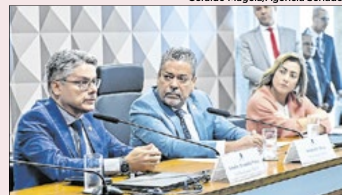
Instalação da CPI das Bets no Senado

A medida estende o benefício a partidos políticos e suas fundações, sindicatos de trabalhadores e instituições de educação e de assistência social sem fins lucrativos. Isso amplia a isenção de escolas particulares ligadas a instituições religiosas, quase todas sem fins lucrativos.