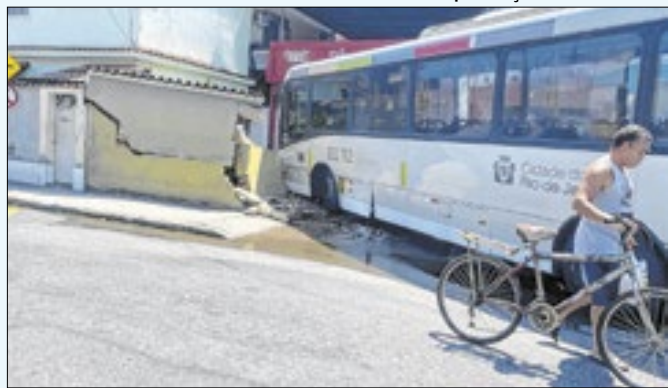
De causa desconhecida, coletivo invadiu residência