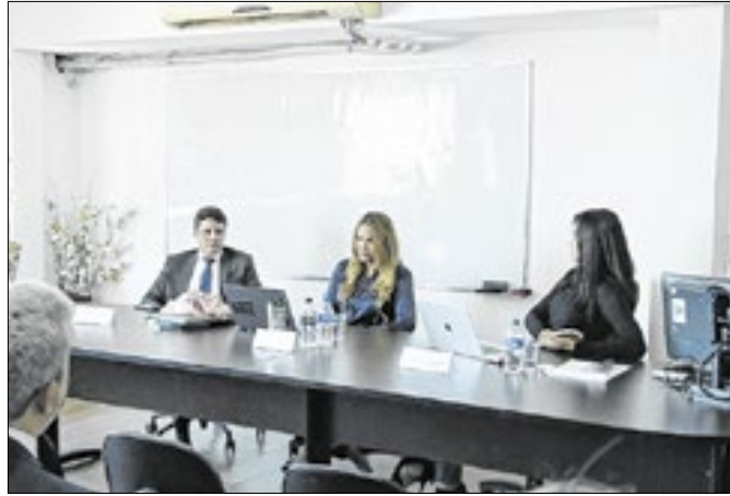
PGMNI deu início a um ciclo de palestras sobre gestão