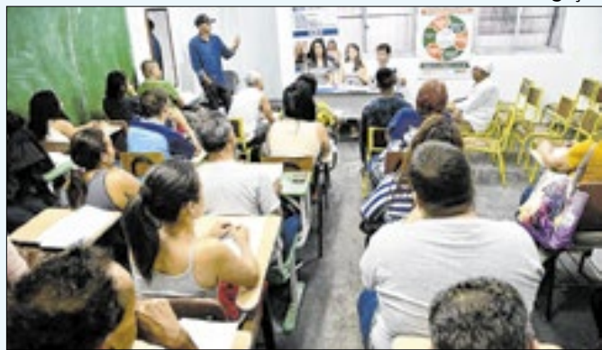
Cursos gratuitos com inscrições abertas em Nilópolis