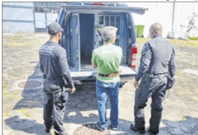
Bicheiro já saiu algemado de Bangu 1, rumo ao MS