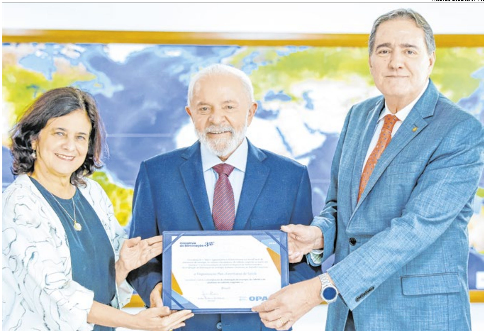
Lula com o Diretor da Organização Pan-Americana da Saúde (OPAS) e Diretor Regional da OMS para as Américas, Jarbas Barbosa, e a ministra Nísia

Devido às baixas coberturas vacinais e ao intenso fluxo