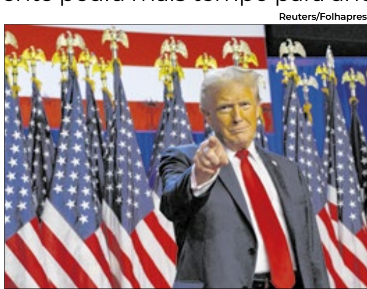
Defesa de Trump terá mais uma semana para argumentar

Segundo a CNN, o adiamento ocorreu para que os advogados de Trump possam