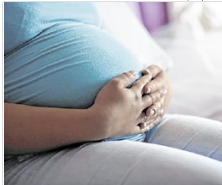
Assistência deverá ser indicada após avaliação profissional