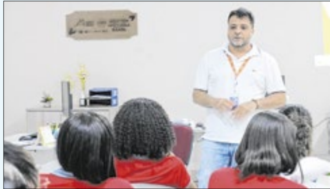
O objetivo foi capacitar empreendedores da cidade