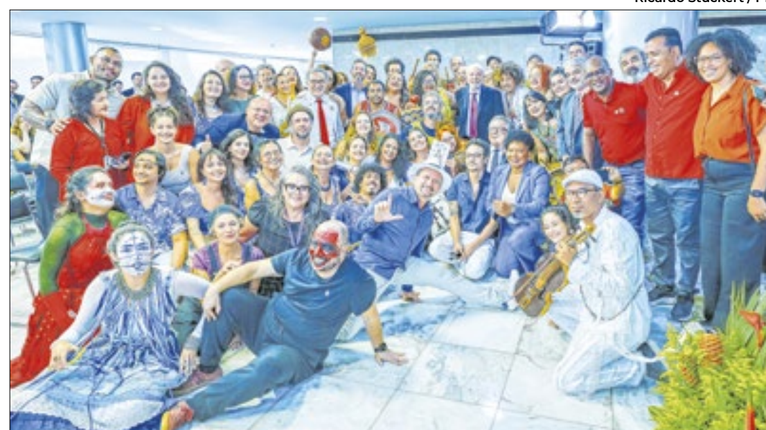
Cerimônia de sanção do PL foi realizada no Palácio do Planalto

A ministra da Cultura, Margareth Menezes, também destacou a importância da sanção do projeto de lei. "Esse dia é um marco que nos convida a celebrar, preservar e valorizar essa manifestação rica da história de resistência e identidade. O maracatu é muito mais do que