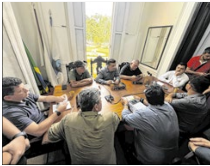
Reunião foi realizada na sede da CMP, nesta terça-feira (12)