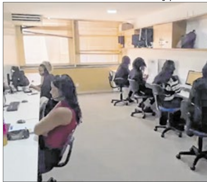
Polícia 'estourou' call center do 'golpe do consignado'

Como exemplo, a cartilha permitia aos fraudadores ensaiar o contato com as vítimas potenciais, com os seguintes diálogos: "Alô, bom dia, Dona Fulana? Aqui quem fala é .....,