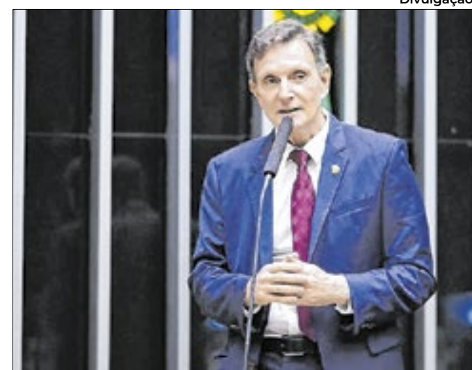
Bispo da Universal, Crivella é o autor da PEC