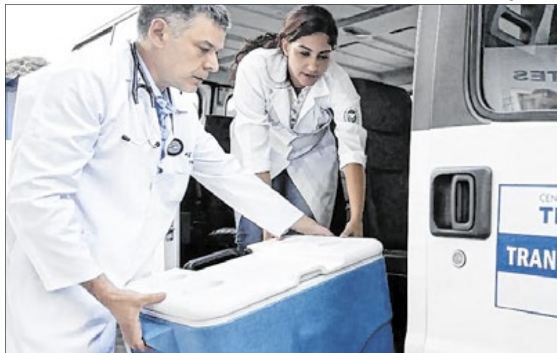
Por prevenção, MPRJ recomenda a revisão completa de todos os exames de sorologia

A orientação do MPRJ é de que as secretarias adotem "ações concretas voltadas a assegurar que os usuários do SUS cuja esfera jurídica possa ter sido afetada por erros de diagnóstico em exames realizados em unidades públicas de saúde pelo Laboratório PCS Saleme tenham resguardo o direito ao refazimento gratuito e com prioridade, a ser agendado via regulação, das análises clínicas e patológicas com suposto erro de resultado". Além desses termos, a instituição orientou tais órgãos a divulgarem, por meio de vias oficiais de comunicação e sites institucionais, quais são os meios pelos quais os pacientes atendidos pelos SUS poderão refazer seus exames em suas respectivas redes de saúde. Por fim, o MPRJ acrescenta que, no