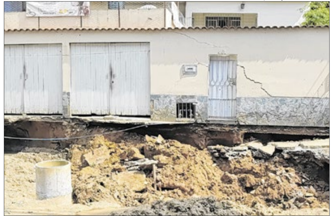
Fotos registraram uma casa que ficou sem calçada devido a obra há duas semanas