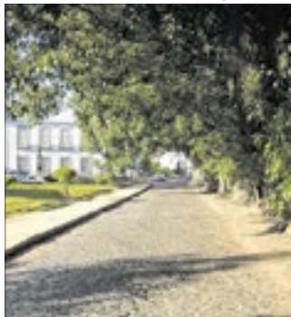
Cidade de Vassouras