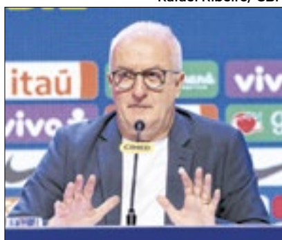
Dorival quer aproveitar chances