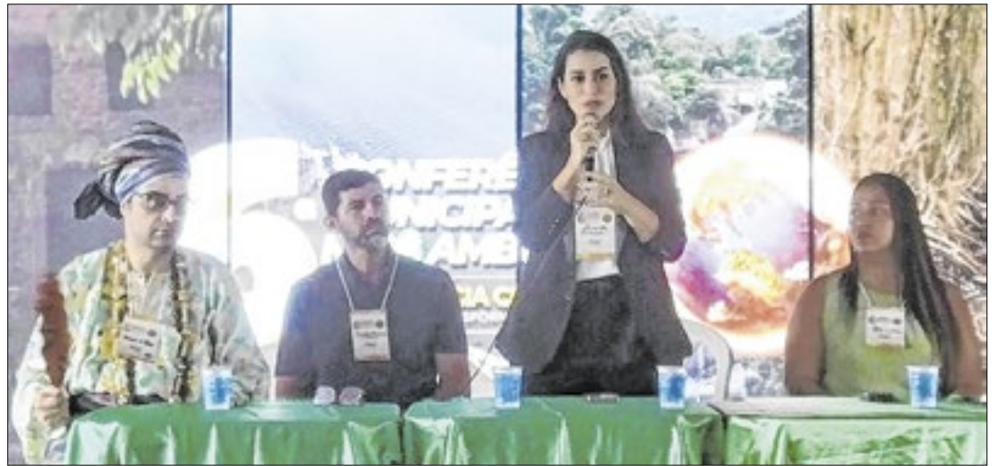
Evento é preparatório para as Conferências Estadual e Nacional no próximo ano

No último dia 9 de novembro, com o tema "Emergência climática: o desafio da transformação ecológica", a Prefeitura de Magé, por meio da Secretaria de Meio Ambiente, realizou a VI Conferência Municipal de Meio Ambiente. O evento, essencial para a formulação de políticas ambientais locais e para o fortalecimento do diálogo entre diferentes setores da sociedade, aconteceu no Magé Tênis Clube e contou com a participação de cerca de 150 pessoas, incluindo representantes da sociedade civil e do poder público.