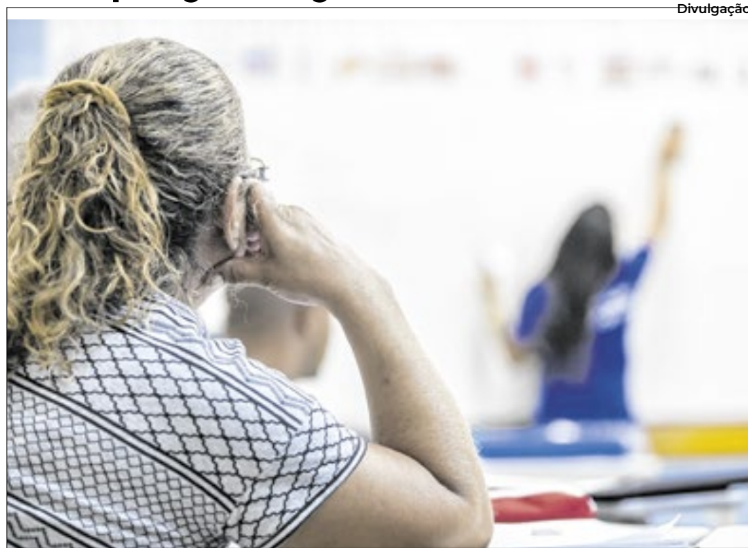
Programa possibilita oportunidade gratuita para aprender a ler e escrever

Para mudar essa realidade, o Programa de Alfabetização e Letramento de Jovens e Adultos promovido pelo Instituto Yduqs, em parceria com a Estácio, oferece aulas gratuitas com todo o material didático necessário e uma metodologia de ensino própria para, em cerca de quatro meses, transformar a vida de pessoas que não tiveram a oportunidade de estudar no seu tempo regular.