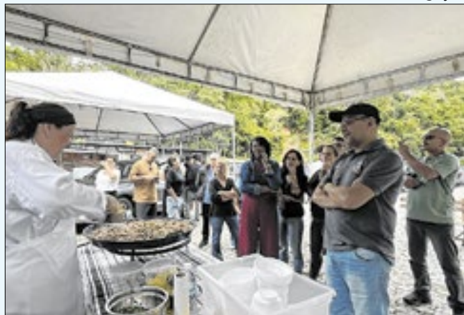
Festival é realizado pelo Petrópolis Convention