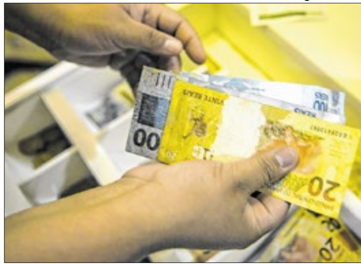
Objetivo é renegociar o pagamento de contas atrasadas

Volta Redonda vai sediar na próxima semana o primeiro "Feirão Limpa Nome", promovido pelo Poder Judiciário do Estado do Rio de Janeiro por meio do Centro Judiciário de Solução de Conflitos e Cidadania (Cejusc) – que integra o Núcleo Permanente de Métodos Consensuais de Solução de Conflitos (Nupec), por meio da juíza Carolina Martins Medina. O objetivo é renegociar o pagamento de contas atrasadas e viabilizar a exclusão do nome dos cadastros restritivos. O evento acontece nos dias 21 e 22 de novembro (quinta e sexta-feira) no estacionamento da Câmara de Dirigentes Lojistas (CDL), na Rua Simão da Cunha Gago, nº 19, no Atterrado, das 9h às 17h.