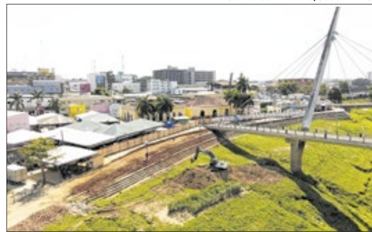
Passarela Joaquim Macedo passa por obras emergenciais