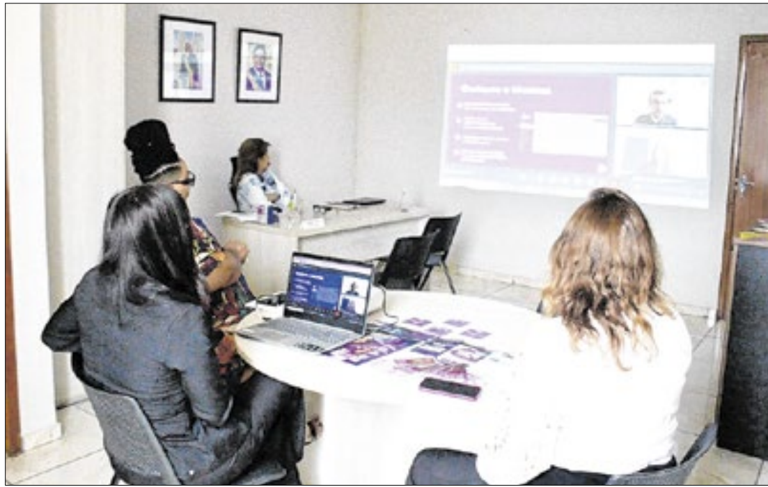
No Piauí, ainda está na etapa de apresentações, visando seu possível lançamento

A plataforma permite que vítimas e testemunhas de violência preencham um formulário online de forma rápida e segura, descrevendo os incidentes por texto ou áudio, e anexando evidências como fotos e laudos médicos. O sistema assegura o sigilo das informações, protegendo as vítimas ao mesmo tempo em que otimiza a coleta de dados essenciais para as investigações. A ferramenta também gera estatísticas que orientam a criação e o aprimoramento de políticas públicas