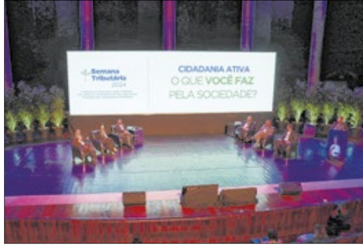
Importância e desafios na V Semana Tributária

Por isso mesmo, a educação fiscal foi o ponto central da sequência de palestras e discussões acompanhadas por centenas de pessoas tanto de forma remota, pela internet, quanto presencialmente no auditório do Canal da Música, em Curitiba. A partir de apresentações interativas, os painéis discutiram justamente as várias formas como essa