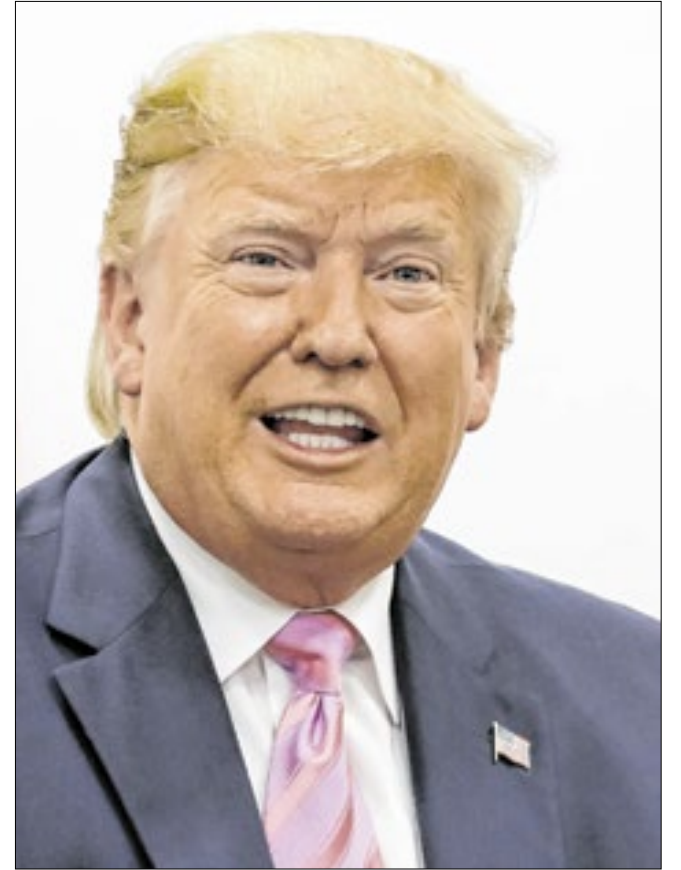
Donald Trump volta ao poder nos EUA