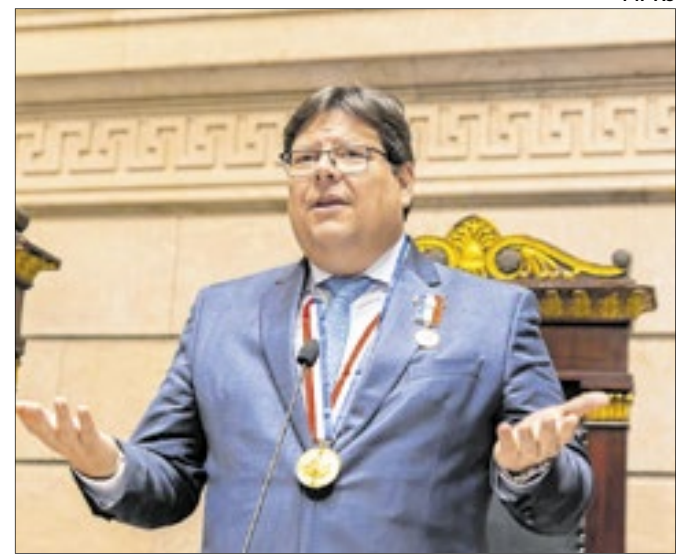
O procurador-geral de Justiça do Rio, Luciano Mattos, recebeu, nesta terça-feira (12), no plenário da Câmara de Vereadores do Rio de Janeiro, o título de Cidadão Honorário do Município do Rio de Janeiro e a Medalha Pedro Ernesto