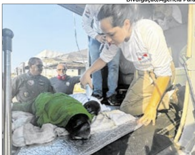
Animais foram transportados de Monte Alegre e Portel