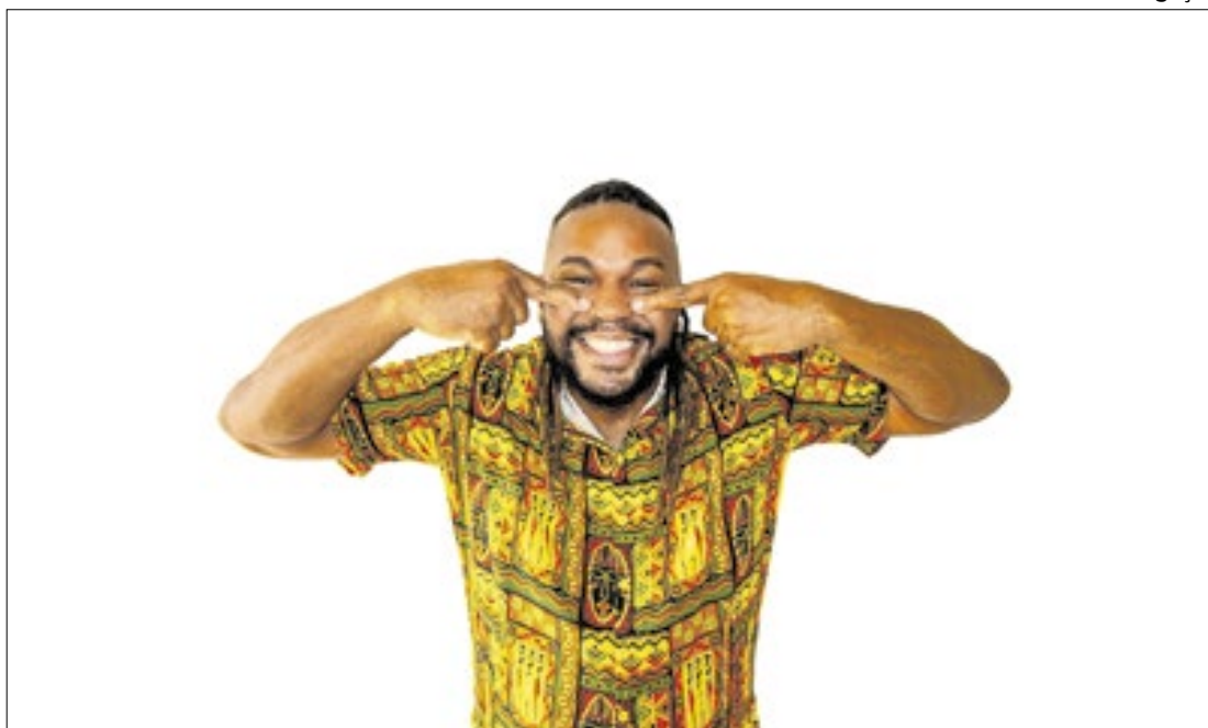
Divulgação Na programação do fim de semana, Oficina Musical Antirracista e Oficina Voz (en)Canto

Espaço cultural celebra a Consciência Negra com boa música