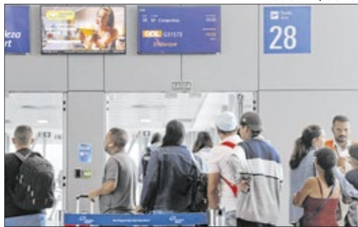
O Aeroporto de Fortaleza contará com 16 voos extras