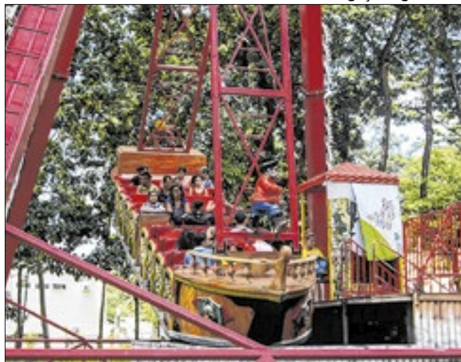
Importância cultural do parque é reconhecida