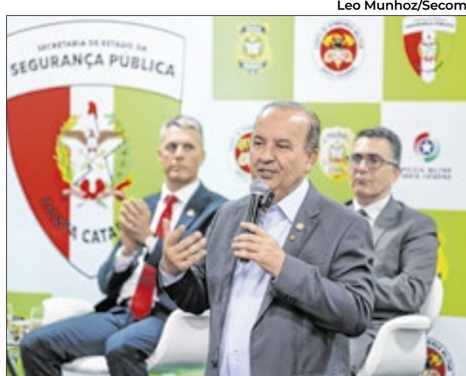
89 anos da Secretaria da Segurança Pública