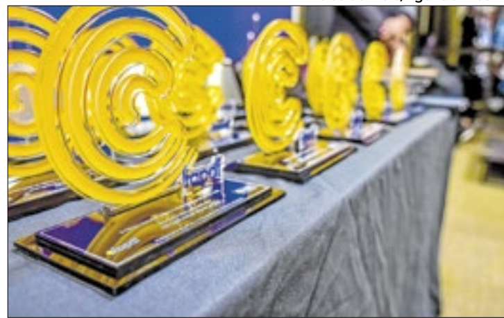
Cerimônia reconhece iniciativas de inovação e pesquisa