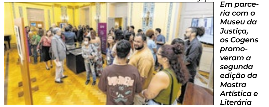
Em parceria com o Museu da Justiça, os Cogens promoveram a segunda edição da Mostra Artística e Literária