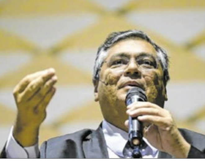
Decisão do ministro se deu após relatório da CGU