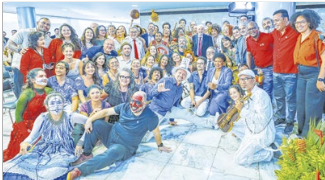
Cerimônia de sanção do PL foi realizada no Palácio do Planalto

A ministra da Cultura, Margareth Menezes, também destacou a importância da sanção do projeto de lei. "Esse dia é um marco que nos convida a celebrar, preservar e valorizar essa manifestação rica da história de resistência e identidade. O maracatu é muito mais do que