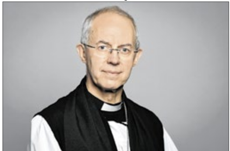
O arcebispo da Cantuária, Justin Welby, renunciou ao cargo

O arcebispo da Cantuária, Justin Welby, renunciou ao cargo de chefe da Igreja Anglicana nesta terça-feira (12).