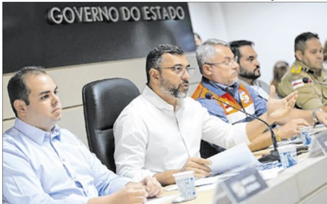
O governo planeja manter as ações para atender as comunidades ribeirinhas e rurais

Além de alimentos, segundo o que foi divulgado na Agência Amazonas, a operação incluiu a distribuição de mais de 4 mil caixas d'água para armazenamento em comunidades isoladas e a instalação de 41 purificadores de água, buscando garantir o abastecimento em áreas atingidas pela seca. Desde 2019, o governo implementou 600 microssistemas de abastecimento de água, por meio do projeto Água Boa, que ajuda no fornecimento regular de água potável para comunidades dis-