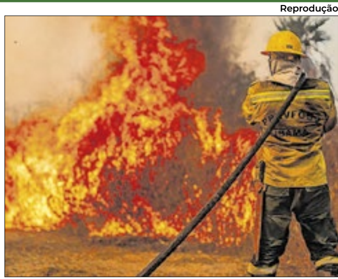
Reprodução Atuação busca recuperação de quase oito mil hectares