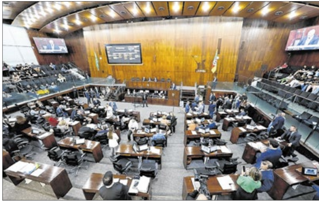
LOA aprovada no parlamento prevê um total de R$ 4,3 bilhões em investimentos

No plenário, os parlamentares ainda aprovaram, por unanimidade, depois da aprovação de requerimento de preferência