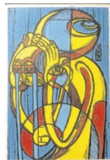
Trabalhos da exposição ‘Ponto de Partida’