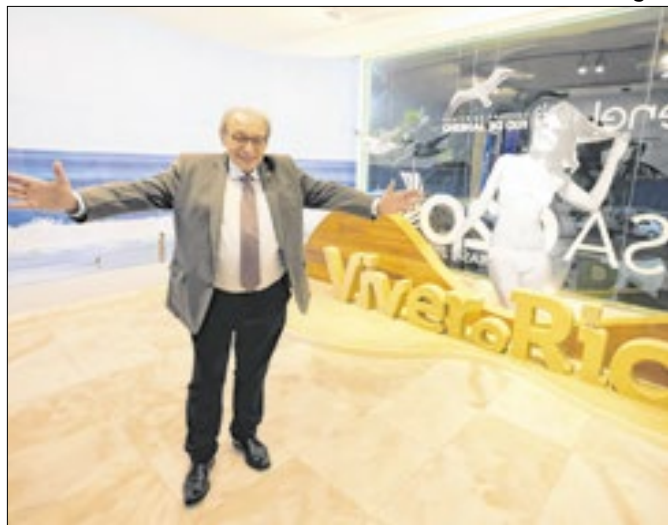
Curadoria da exposição é de Ruy Castro e Heloisa Seixas