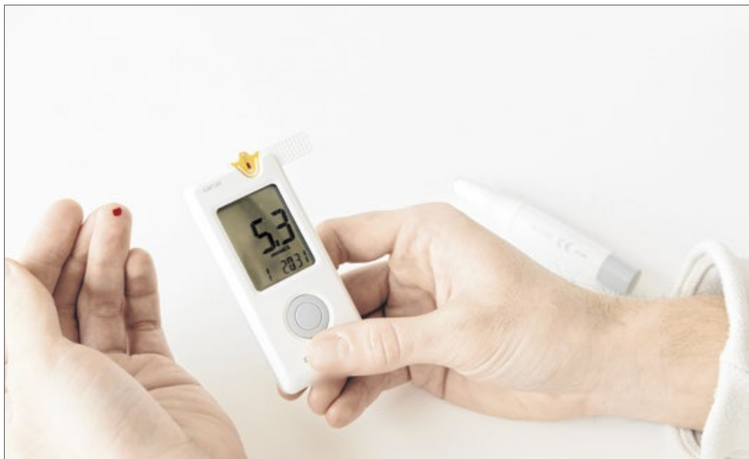
Doença potencializa o risco de AVC, que pode deixar seqüelas ou levar à morte

De acordo com o estudo Golden Burden of Disease, uma em cada quatro pessoas terá AVC ao longo da vida. Atualmente, 25% são vítimas fatais e 70% ficam com alguma seqüela. O mesmo estudo, porém, aponta que 90% dos AVCs poderiam ser evitados com hábitos saudáveis e cuidados básicos com a saúde. “É uma condição que pode levar à morte ou deixar graves seqüelas, mas que poderia ser evitada, portanto precisamos aproveitar cada campanha, cada oportunidade para