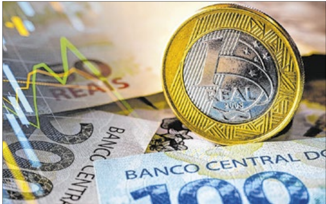
Previsão de deterioração da dívida coincide com o fim do mandato presidencial

No mesmo rol de dívidas preocupantes, o Fundo apontou os Estados Unidos, França e Itália. De modo diferenciado, especialistas entendem que há fatores limitantes do nível dos débitos brasileiros, sem que haja maiores riscos para a eco-