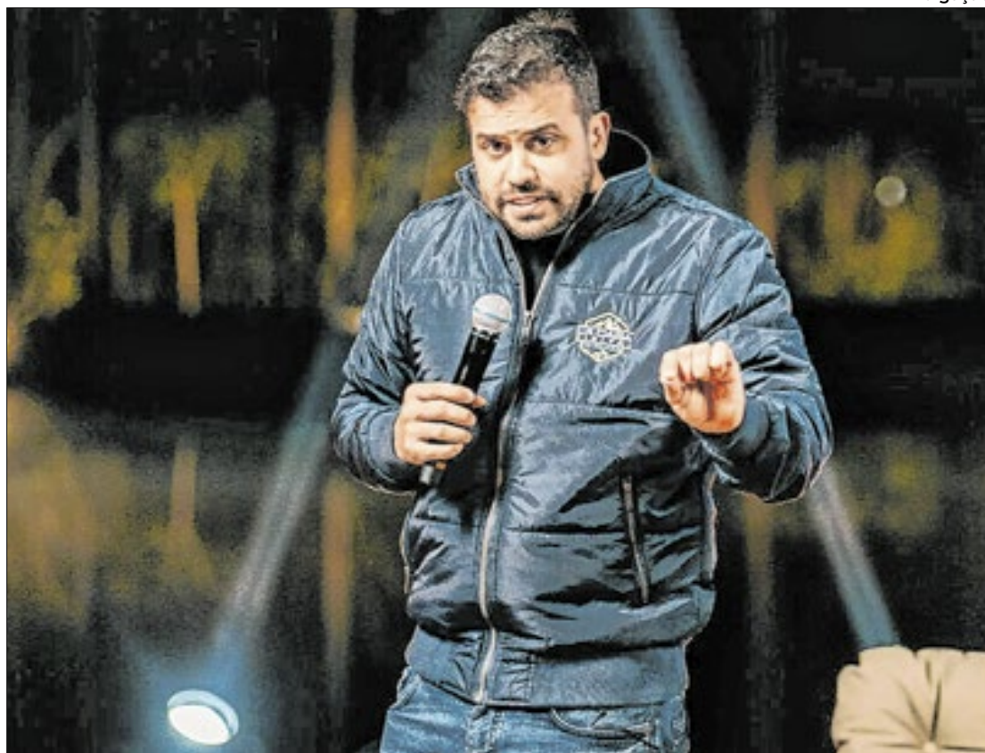
Marçal é acusado de usar laudo falso para acusar Boulos de usar cocaína

“Isso tem uma dupla face: Pablo Marçal vai ter que ‘comer o pão que a justiça vai amassar’ de um lado, e, do outro, isso pode fortalecê-lo junto aos seus adeptos e eleitores, que acreditam que esse tipo de episódio é uma das coisas mais lindas do mundo”, afirmou o advogado.