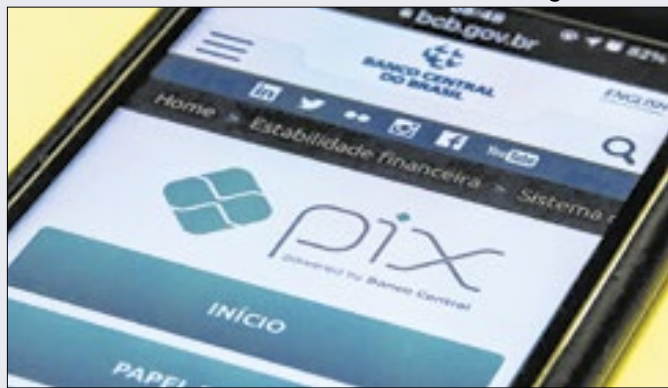
BC continua devendo uma solução para vazamentos