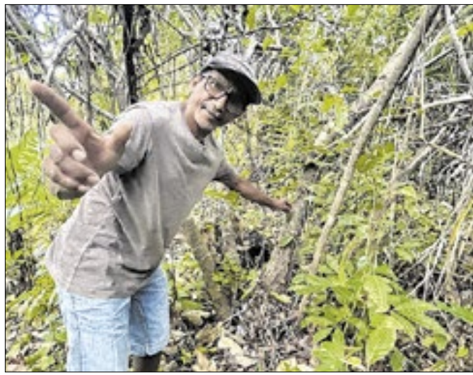
Ação incentiva o envolvimento das comunidades locais