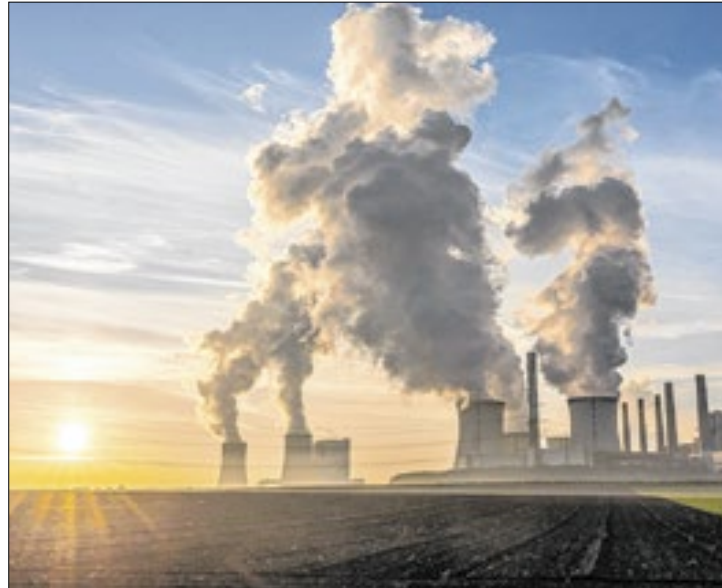
País pode ser líder na redução da emissão de poluentes

Entre as propostas apresentadas, 43 se referem a combustíveis de aviação, totalizando R$ 120 bilhões. Outras 33 são voltadas em combustíveis marítimos, envolvendo R$ 47