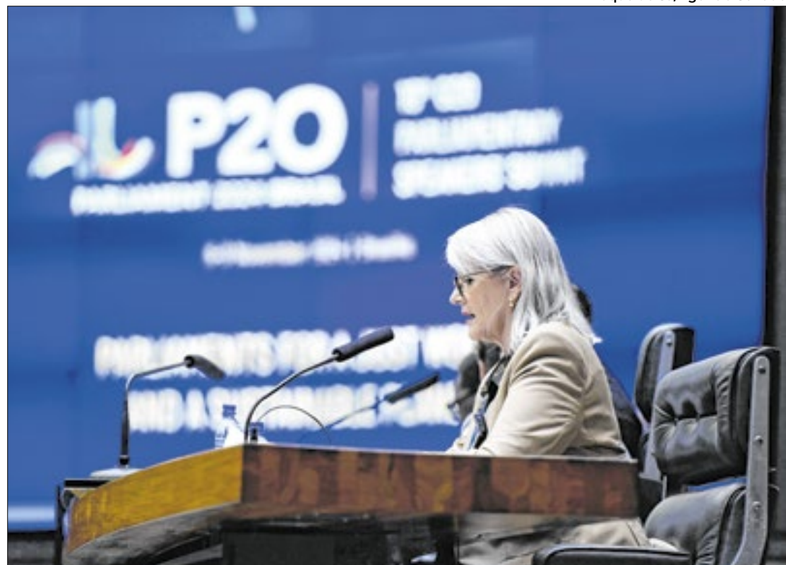
Annelie Lotriet, vice-presidente da Assembleia da África do Sul; país sediará G20 em 2025

No último dia da Cúpula do P20, na sexta-feira (8), os convidados discutiram a importância do “Parlamento na construção de uma governança global adaptada aos desafios do século XXI”. A declaração final do P20, homologado na sexta,