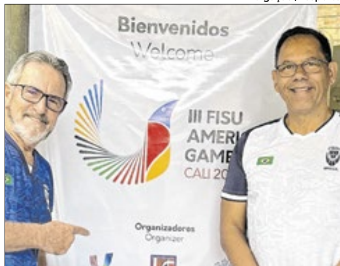
Presidente da Fesporte destaca presença