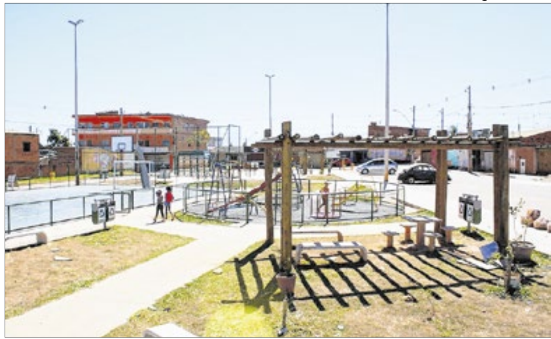
Praça na região residencial do Sol Nascente. Parece favela?

Em menos de 10 anos, Samambaia se tornou uma cidade com 100% de saneamento, linha de metrô, asfaltada. Hoje, 35 anos depois, está se expandindo horizontal e verticalmente como novo polo de moradia para a classe média.