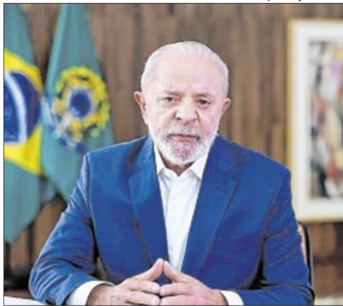
Presidente não viajou para a Rússia para o Brics