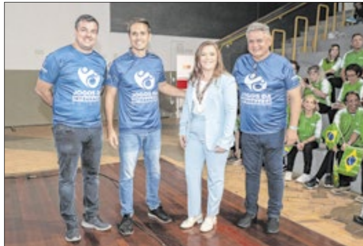
Séries ouro e prata em Guaratuba e Pontal do Paraná

O Governo do Estado, por meio da Secretaria da Mulher, Igualdade Racial e Pessoa Idosa (Semipi) e da Secretaria de Estado do Esporte (SEES), iniciou oficialmente nesta sexta-feira (08), em Pontal do Paraná, a 18ª edição dos Jogos da Integração do Idoso (JIIDO), com mais de 2,4 mil participantes. As atividades vão até 12 de novembro.