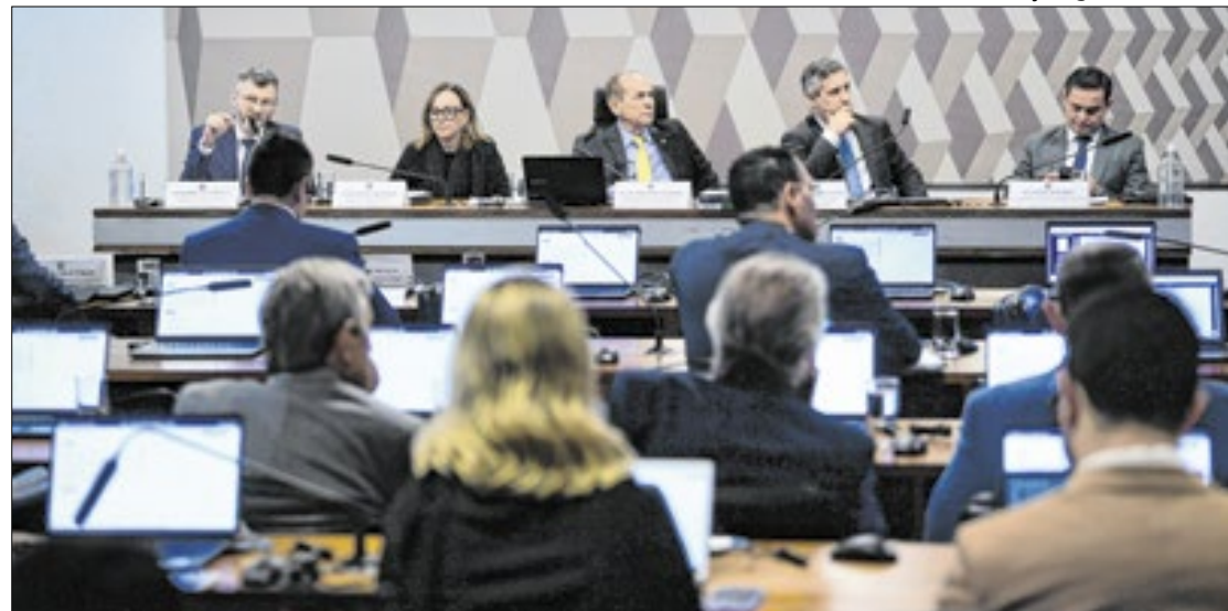
CCJ do Senado corre para votar PLP 68 até dezembro

Nesta terça-feira (12), às 10h está agendada uma audiência pública para discutir as mudanças que a reforma tributária implicará no setor da saúde. Mais tarde no mesmo dia, às 14h30, será debatido o “regime