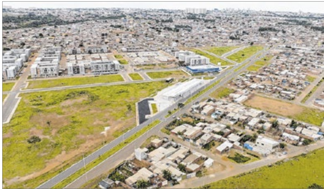
Vista aérea de parte do Sol Nascente, "a segunda maior favela do Brasil", segundo o IBGE

Causa espanto ver no noticiário nacional que o Distrito Federal tem três das maiores favelas do país em área ocupada e a segunda mais populosa, perdendo apenas por 1.100 habitantes para a Rocinha, no Rio de Janeiro. Esse é o resultado do Censo 2022, divulgado na última sexta-feira (8) pelo IBGE.