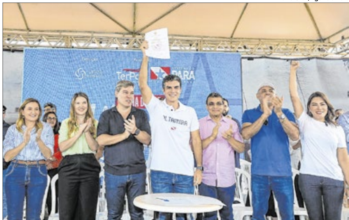
A estrutura terá um teatro, oficinas, piscina, quadras, academia ao ar livre e playground.

O projeto prevê a construção de dois prédios principais, denominados Usina e Assistência, que irão abrigar os diversos serviços. Entre as ofertas estão atendimento médico, emissão