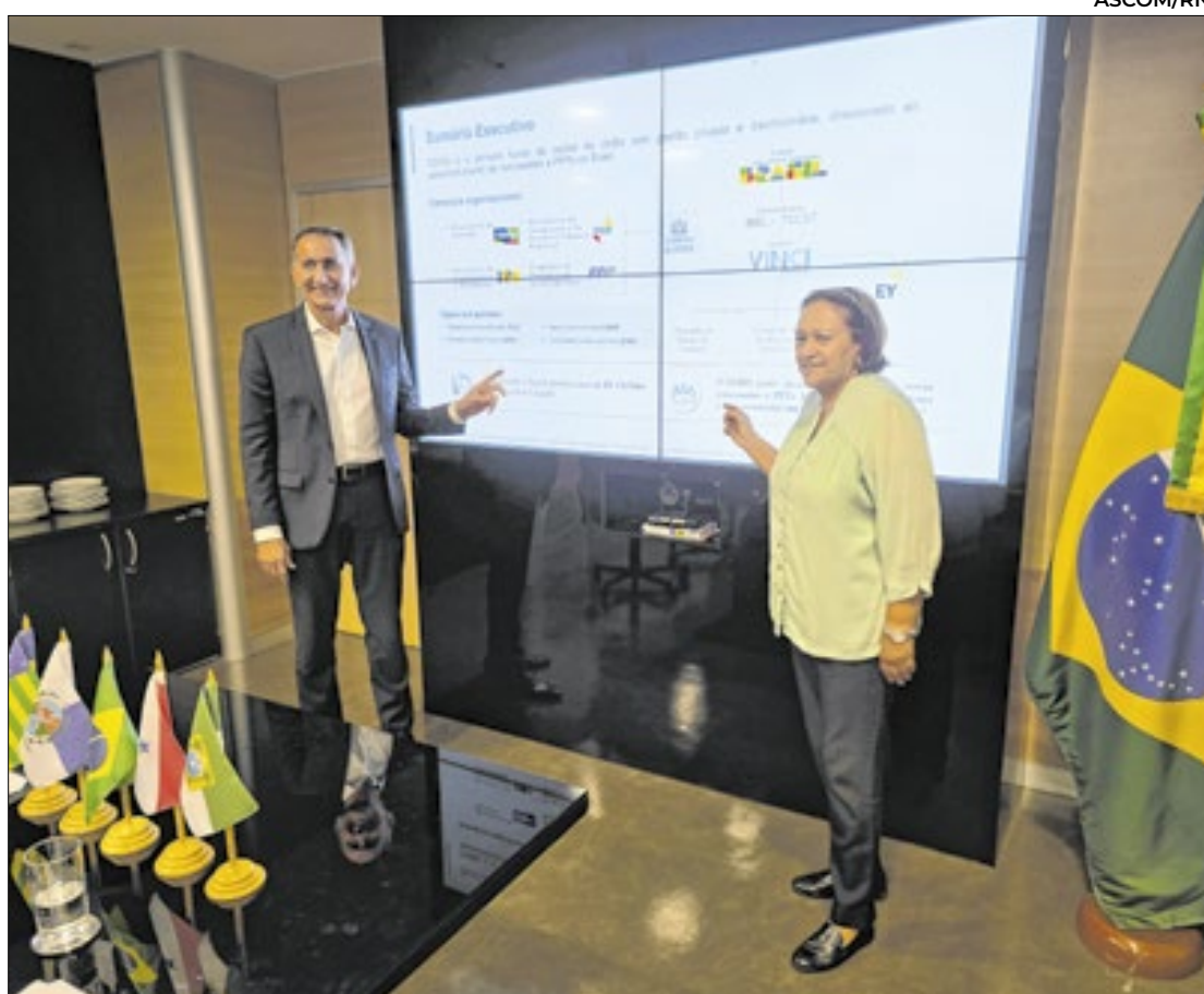
Governadora Fátima Bezerra debate financiamento de PPPs em Brasília

Com cerca de R$ 1 bilhão de patrimônio líquido, ele também poderá investir em Fundos de Investimentos e atuar em projetos de grande impacto social e econômico,