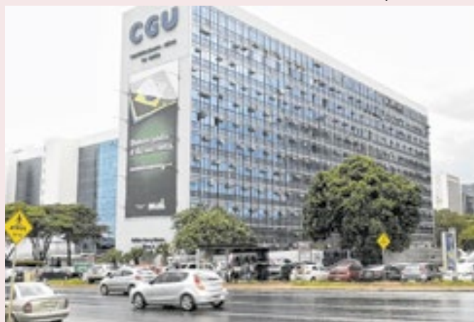
Análise da Controladoria focou em 20 ONGs