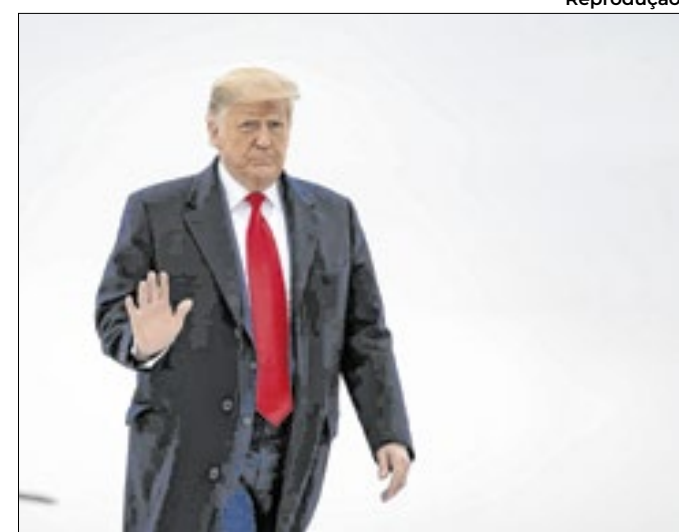
Minc prevê medidas duras contra o planeta