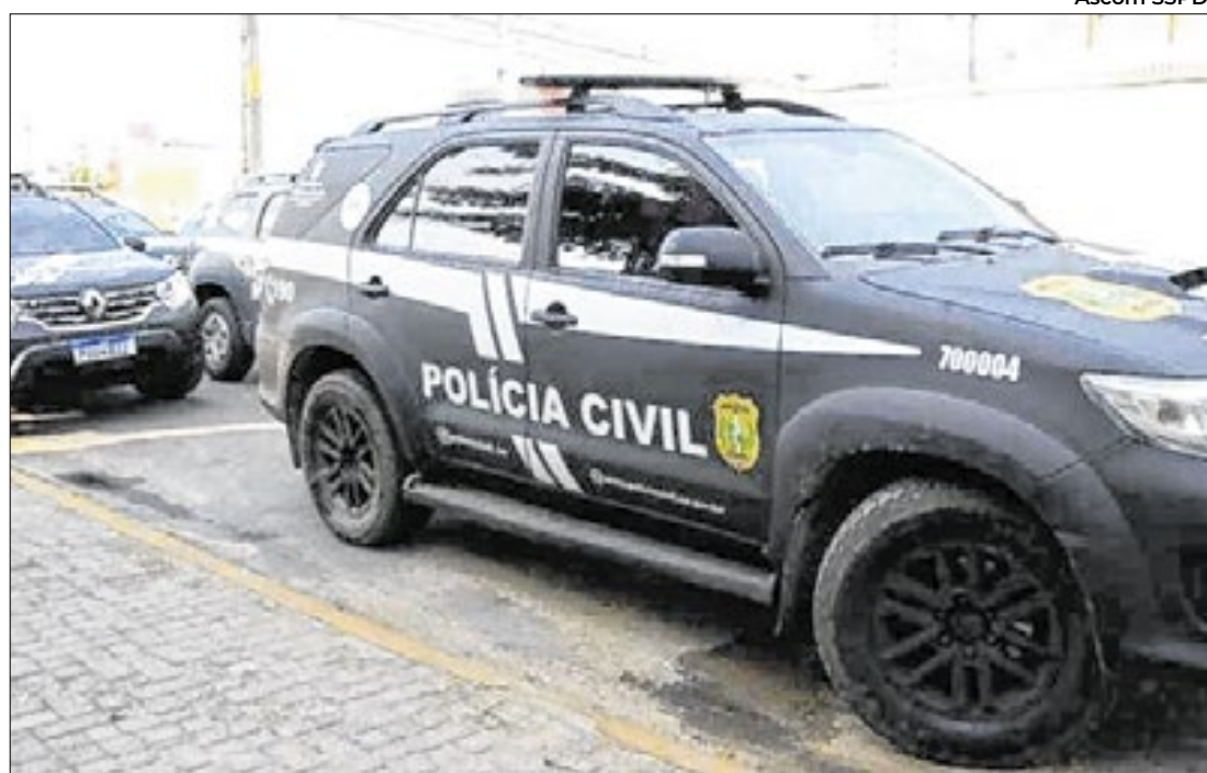
Capital teve 22,8% casos a menos e o Interior Norte teve 20,3% de redução

O Residencial Lindalma Soares, localizado na zona norte de Teresina, está sendo contemplado com calçamento em seis ruas, totalizando 11.664 m 2 de pavimentação e investimento de R$ 1,5 milhão. Os serviços são executados pela Secretaria das Cidades (Secid).