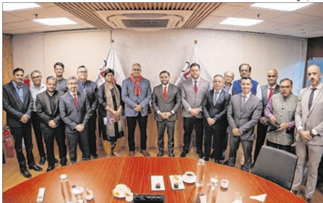
Vice-governador Gabriel Souza liderou missão com agendas em Mumbai e Nova Délhi

Gabriel avaliou que o objetivo da primeira missão organizada pelo governo estadual para a Índia foi cumprido, pois abriu as portas para a ampliação de mercados entre os dois países. "A Índia é um país maravilhoso, nós estamos muito contentes de ter conhecido uma série de oportunidades de negócios para empresas gaúchas, de produtores