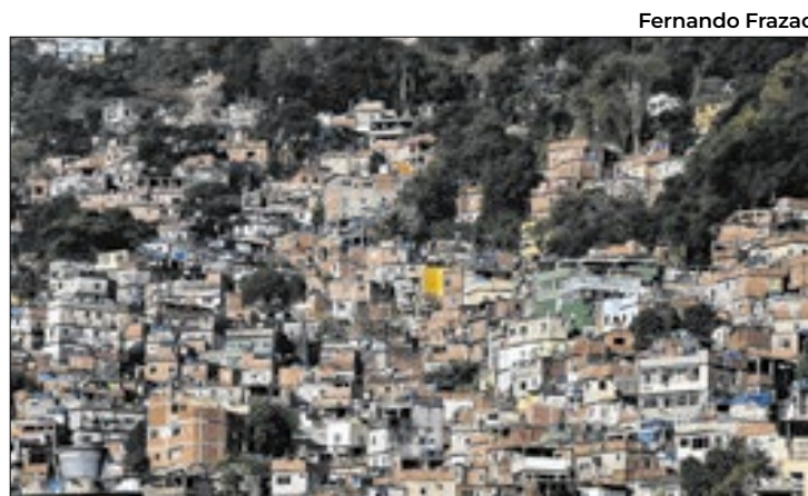
As 20 maiores favelas agrupam 858,6 mil moradores

Os programas Meu Celular e Moto Segura Ceará, iniciativas da SSPDS, têm sido apontados como fatores importantes na redução dos CVPs, ajudando a inibir crimes envolvendo aparelhos celulares e motocicletas. O programa Meu Celular permite o registro de dispositivos móveis pelo número do IMEI em uma plataforma específica da SSPDS.