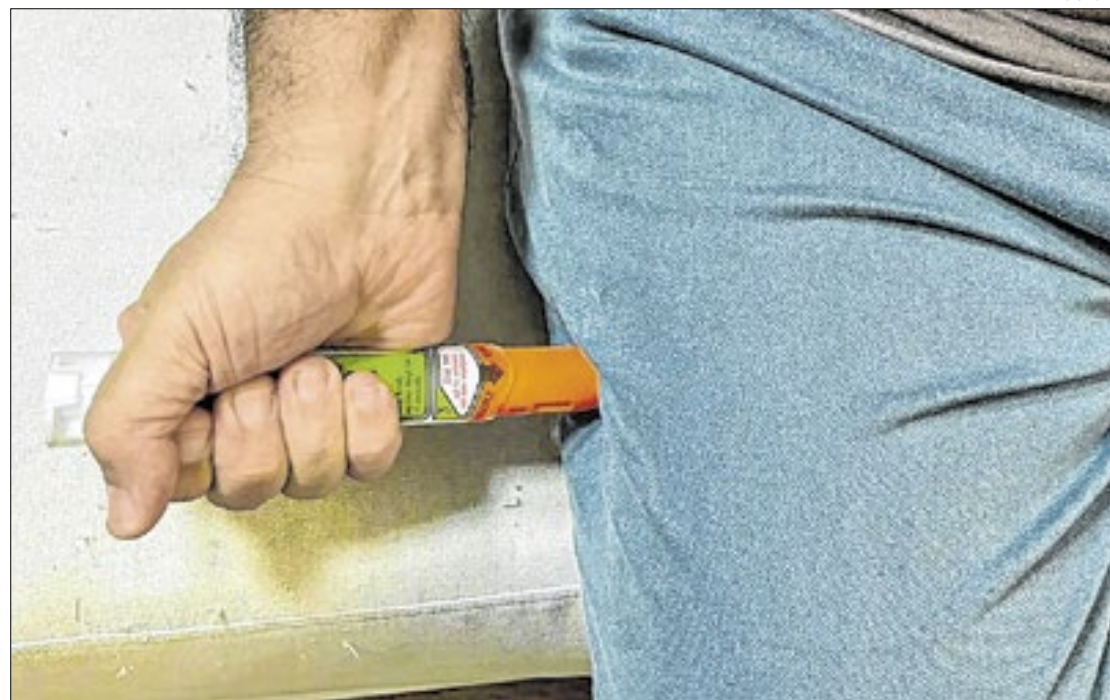
A medicação, nesse tipo de dispositivo, é aplicada pelo próprio paciente

"A grande pergunta é: por que demorou tanto tempo pra termos isso acontecendo no