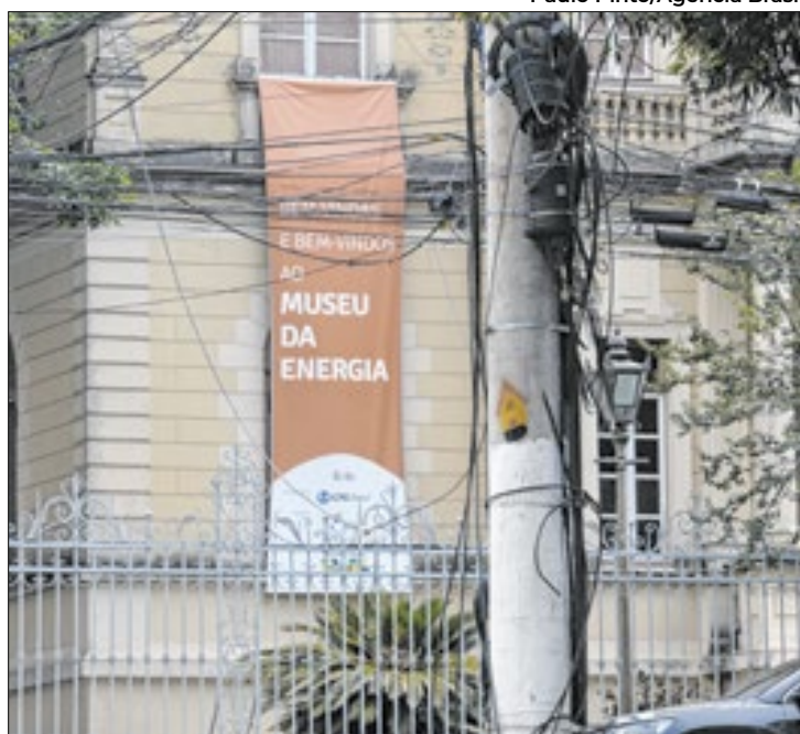
Enel afirma que está investindo para melhorar os serviços

Além disso, solicita indenizações individuais para as unidades consumidoras que ficaram mais de 24 horas sem energia elétrica. O valor mínimo estabelecido é de R$ 500 por dia de interrupção, por unidade. Com base em dados fornecidos pela Enel e pela Aneel (Agência Nacional de Energia