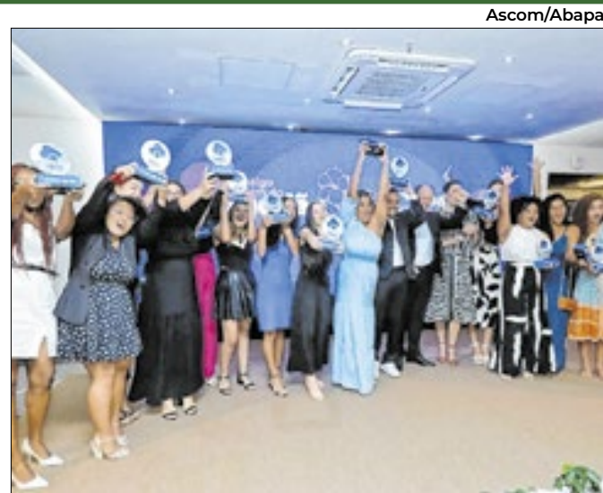
O Prêmio Abapa é dividido em duas categorias

A retração chegou a 34,3% no Interior Sul e 31,1% em Fortaleza