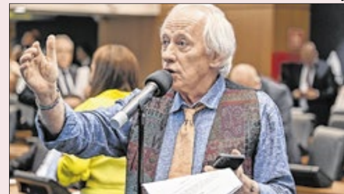
Deputado cobra investimentos de países ricos