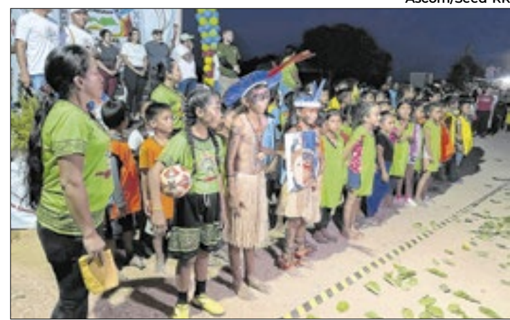
Evento reuniu 300 alunos e promoveu integração