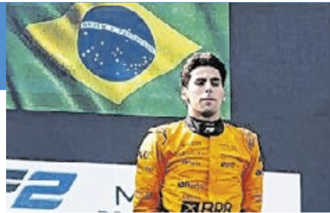
Gabriel Bortoleto é o primeiro brasileiro a competir na Fórmula 1, em sete anos