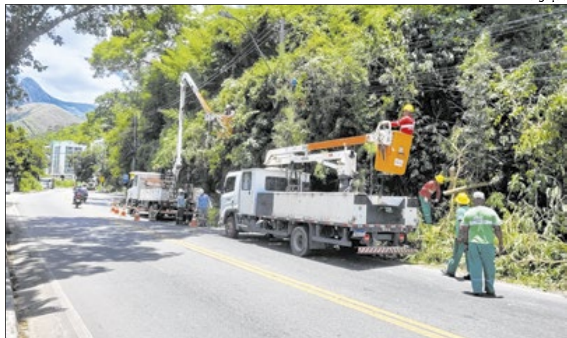
Preocupação especialmente em relação as regiões de grande fluxo turístico no município

A entidade também expressa preocupação com a poda de árvores e a limpeza de galhos e folhagens próximas à rede elétrica, uma