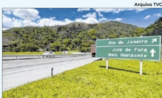
Rodovia é a principal ligação entre os estados do RJ e MG

dias 21 e 23 de dezembro. A Catedral São Pedro de Alcântara recebe no dia 23 de dezembro, a tradicional apresentação do Coral Integração. Também estão previstas exposições e corridas. O Natal Imperial vai até o dia 05 de janeiro de 2025. A programação completa será divulgada em breve pela Prefeitura de Petrópolis no site e nas redes sociais.