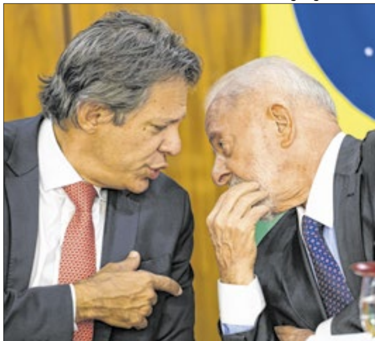
Nova conversa prevista para sexta-feira (8)

Gestão e da Inovação em Serviços Públicos, Esther Dweck.