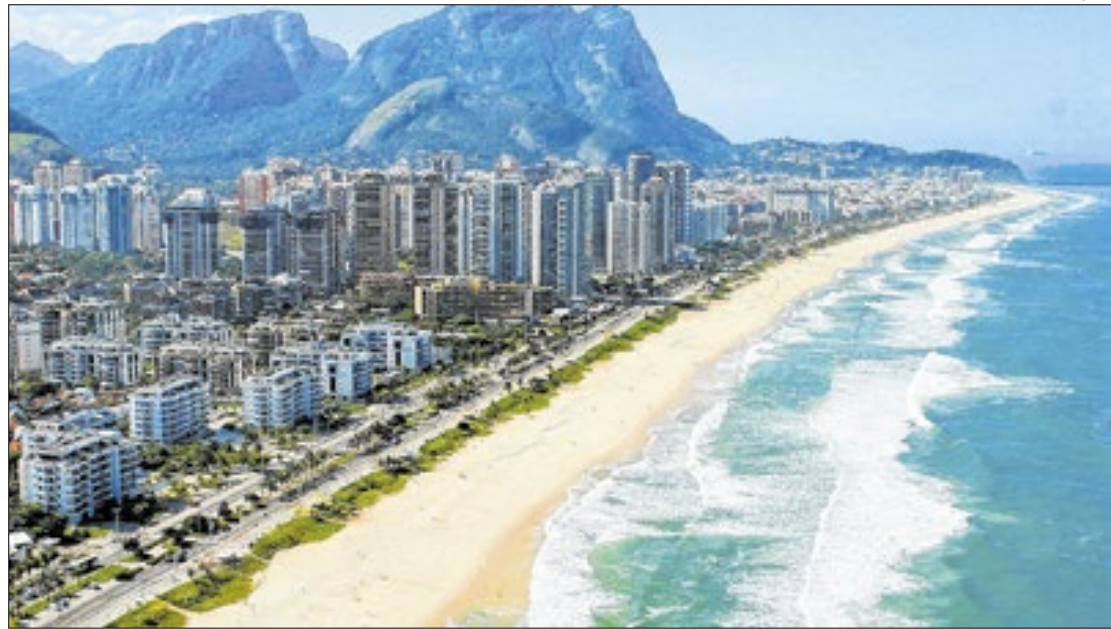
Expansão significativa do mercado de imóveis reflete aumento da renda

Já a vice-liderança neste quesito, no mesmo período