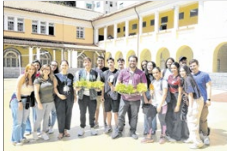
Canteiros do Colégio Estadual Dom Pedro II ganham vida com a implantação de horta

A implantação das hortas proporciona aos alunos uma experiência prática e educativa de como produzir e consumir alimentos de forma consciente. Os estudantes participam do processo de cultivo e observam de perto os benefícios desse hábito para a saúde e o meio ambiente, já que