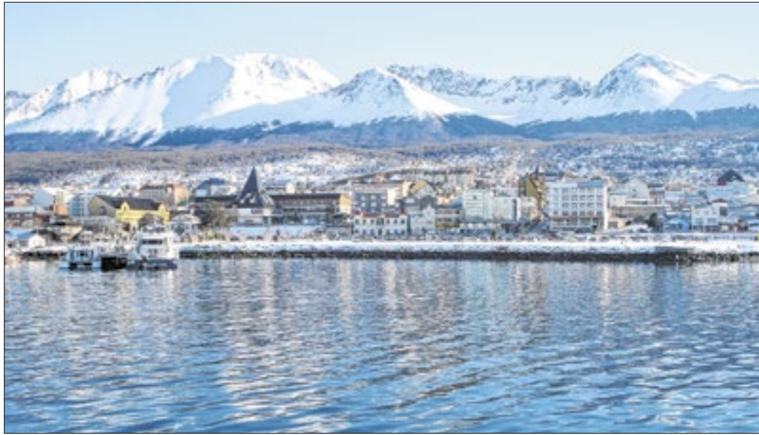
Entre os destinos da Rota Patagônia, está a região de Ushuaia, na Argentina

Com a marca “Visit South America”, os países buscam transformar o turismo na região em um motor de desenvolvimento, aproveitando o grande potencial natural e cultural desses locais. Confira, a seguir, as rotas turísticas: