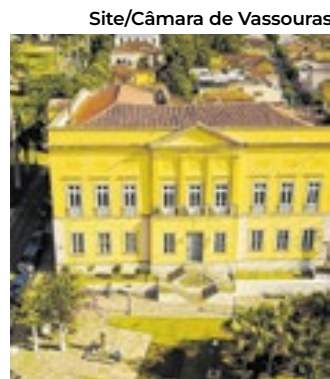
Câmara de Vassouras