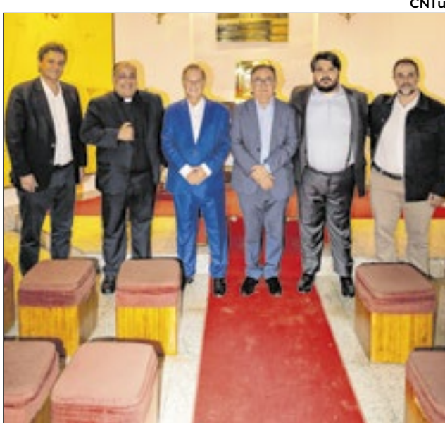
A nova gestão da CNTur também destacou como prioridade a criação de programas de qualificação da mão de obra e apoio aos pequenos e médios empreendedores do setor