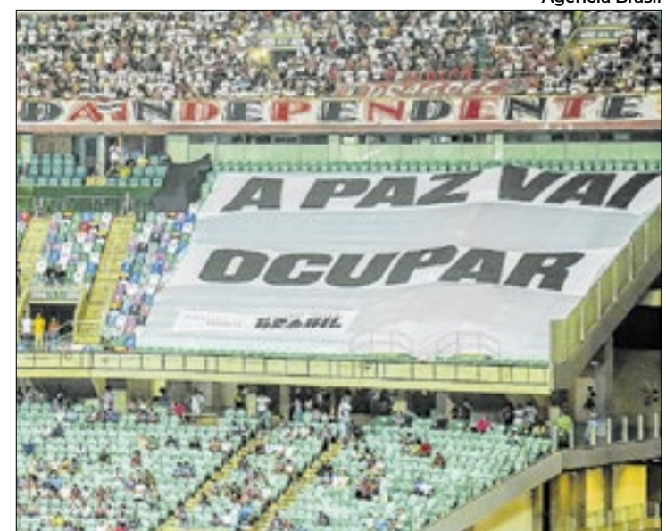
Ministério do Esporte quer promover a paz no futebol

A campanha Cadeiras Vazias será impulsionada nas redes sociais com diversos conteúdos que serão compartilhados por atletas, ex-atletas, clubes, torcidas organizadas, influenciadores e outras personalidades.