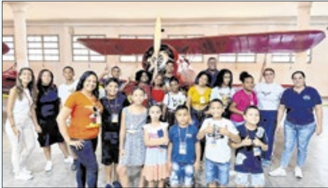
Jovens visitaram pela 1ª vez o Museu Aeroespacial