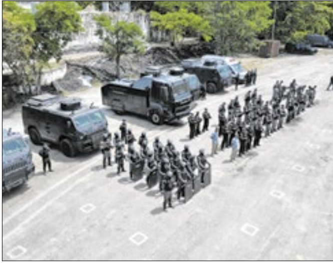
Agentes realizaram exercício tático para o G20