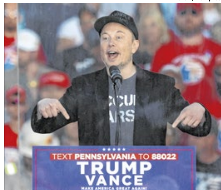
O bilionário Elon Musk apoiou a campanha de Donald Trump