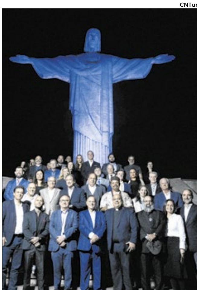
Cerimônia de posse da nova diretoria da Confederação Nacional de Turismo foi realizada no Santuário do Cristo Redentor