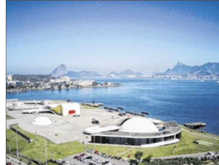
Festival acontece de 15 a 17 de novembro