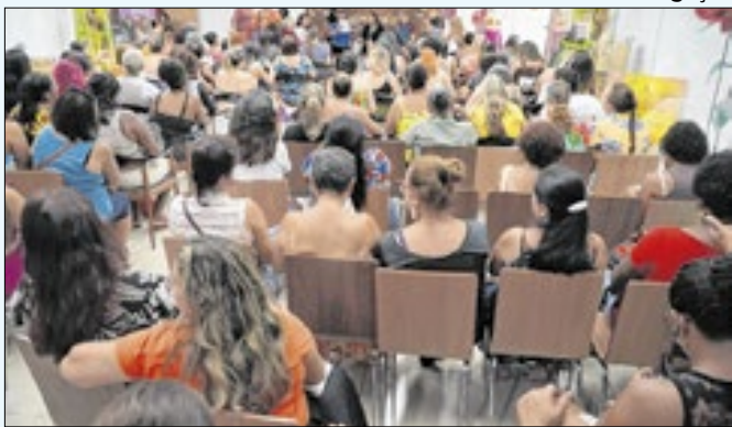
Workshop aconteceu no Centro do município