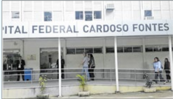
Não há previsão para reabertura de unidade de saúde