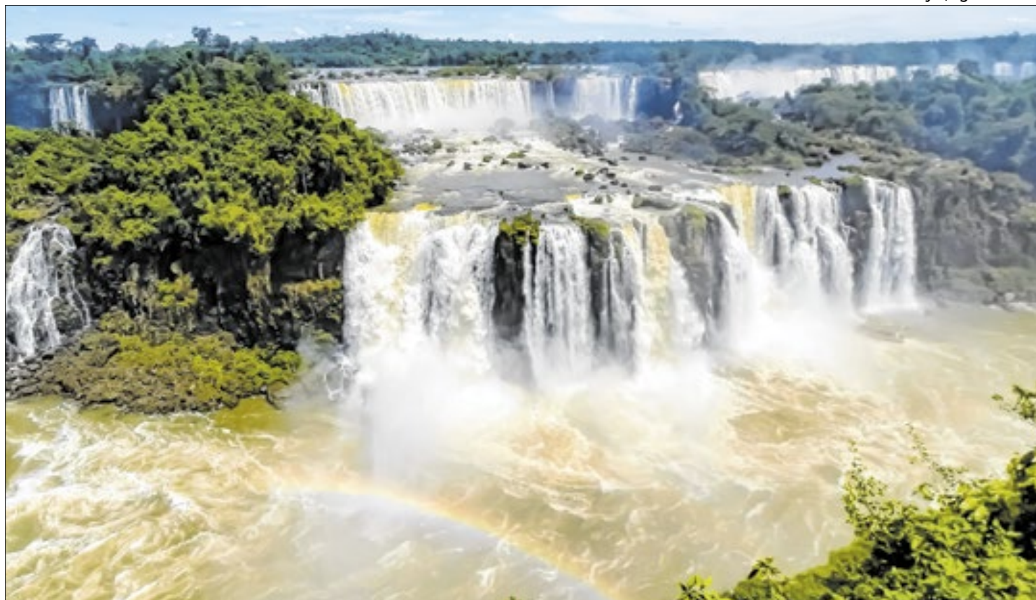
Cataratas do Iguaçu é um conjunto de cerca de 275 quedas de água localizada entre o Brasil e a Argentina

Conforme as informações divulgadas pelo Ministério do Turismo, a marca dá visibilidade aos atrativos, que vão desde aventuras ao ar livre, ecoturismo, religiosidade, cultura e gastronomia, até a rica história e natureza abundante da América do Sul. Para turistas que procuram mais do que paisagens, o site propõe uma verdadeira imersão nas tradições locais. O “Visit South America” ainda proporciona a valorização da sustentabilidade e a conexão com as comunidades, proporcionando experiências enriquecedoras e significativas que contribuem