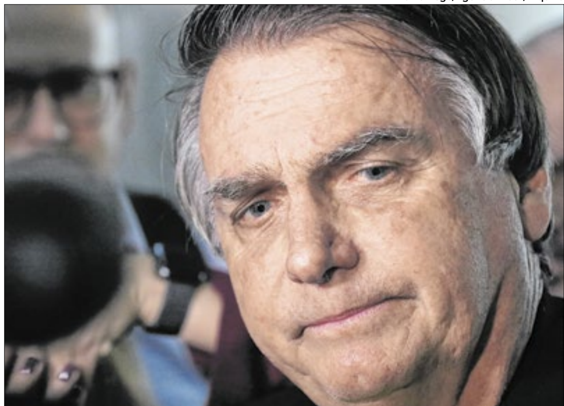
Mesmo com vitória de Trump, Bolsonaro não deve conseguir concorrer em 2026

Além disso, na Câmara, tramita o PL 2.858/2022, que concede anistia aos envolvidos nos atos de 8 de janeiro de 2023, quando manifestantes depredaram a Praça dos Três Poderes. Ambos os projetos podem be-