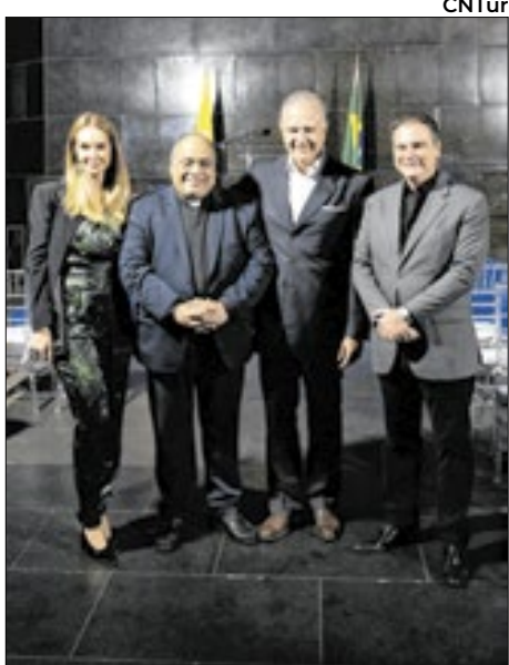
A escolha do Cristo Redentor como cenário para a posse simboliza o desejo da CNTur de promover o turismo como um instrumento de união e esperança