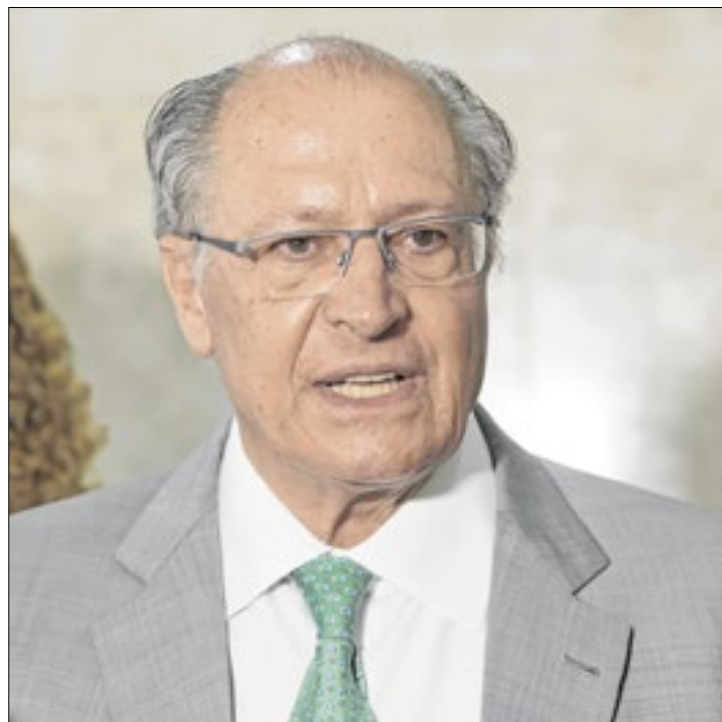
Alckmin diz que países manterão boas relações econômicas

O candidato republicano tem uma postura mais protecio-