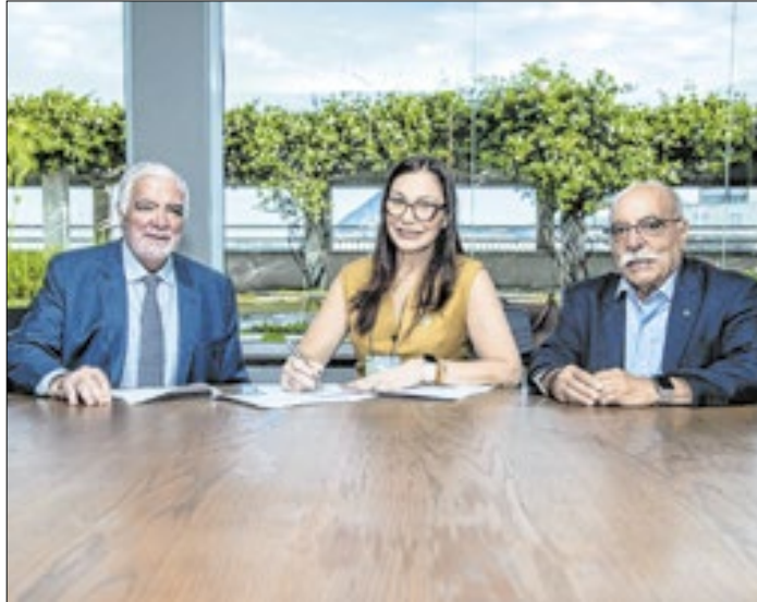
Cerimônia foi realizada na sede do Sebrae, no Centro do Rio