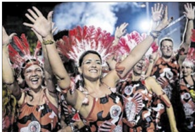
Ícônico bloco é 'patrimônio' eterno da alegria carioca