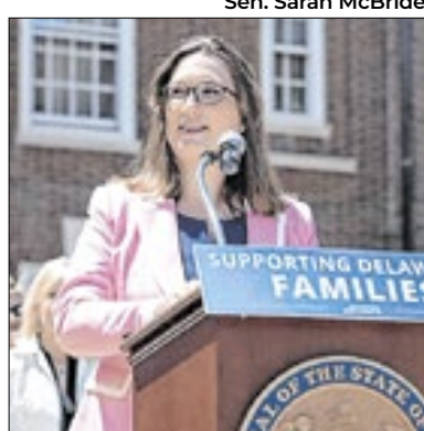
Sarah vai representar Delaware

Sarah McBride, 34, é a primeira pessoa transgênero a ser eleita, na história dos Estados Unidos, para uma vaga na Câmara dos Representantes. Segundo a apuração, ela vai representar seu estado natal, Delaware. Atualmente, além