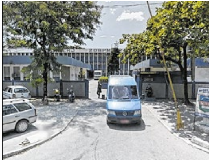
Agentes do 20ºBPM foram presos por esquema de corrupção

O Ministério Público do Estado do Rio de Janeiro (MPRJ), por meio da 1ª Promotoria de Justiça junto à Auditoria de Justiça Militar, em conjunto com a Corregedoria da Polícia Militar, realiza operação, nesta quinta-feira (07), para prender 22 policiais militares denunciados por corrupção passiva, negativa de obediência e associação criminosa. A investigação apurou que as guarnições realizavam um verdadeiro "tour da propina" em Nova Iguaçu, visitando em sequência dezenas de comércios para arrecadar dinheiro ilegalmente. Segundo a denúncia, foi identificado o recolhimento de valores em 54 estabelecimentos.