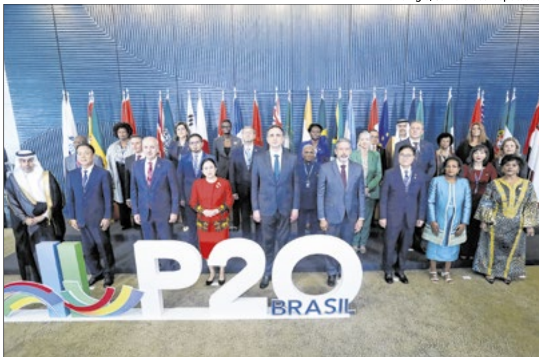
Parlamentares das maiores economias do mundo acompanhados de Lira e Pacheco

Já Lira, pontuou que, para a 10ª edição do P20, é necessário se discutir o papel de deputados e senadores em três eixos prioritários: o combate à fome, à pobreza e à desigualdade. “O desenvolvimento sustentável