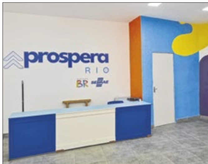
Programa vai ajudar produtores locais