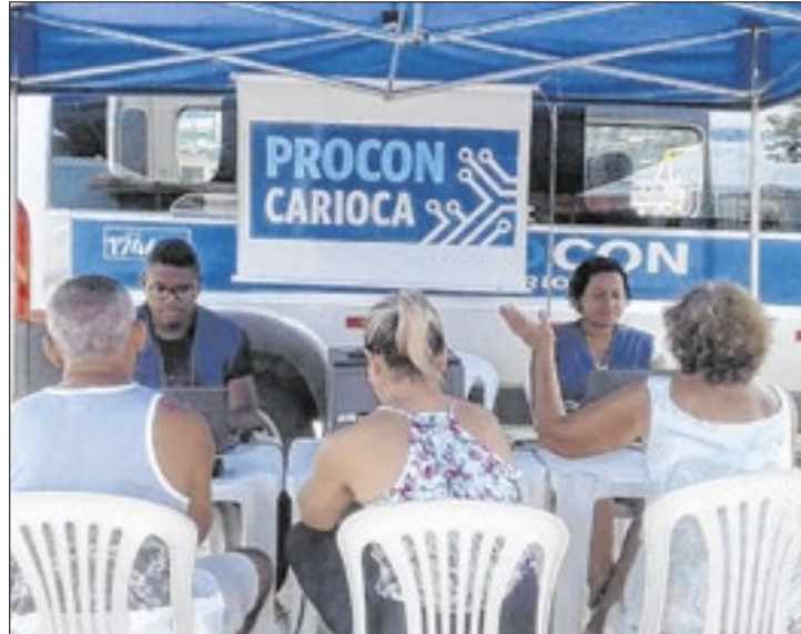
Ação do Procon Carioca é oportunidade para sanar dívidas

meio do Núcleo de Educação e Atendimento do Consumidor (NEASCON).