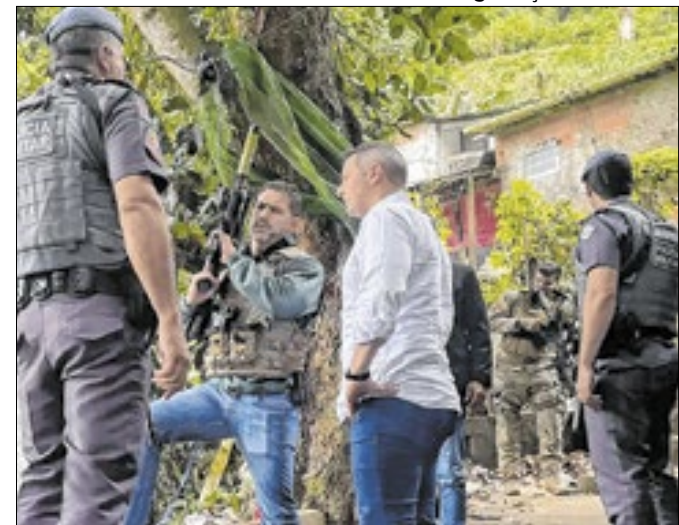
A Operação Escudo, da PM paulista, matou 84 pessoas