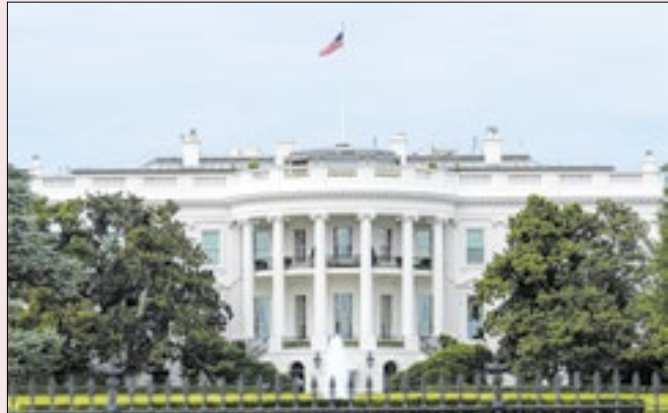
Casa Branca também divulgou nota sobre telefone