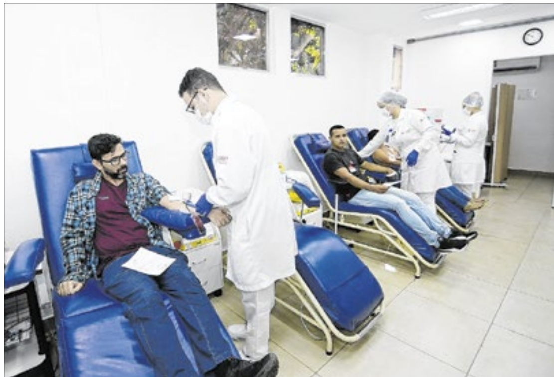
Banco de sangue funciona de segunda à sábado, das 7h30 às 18h