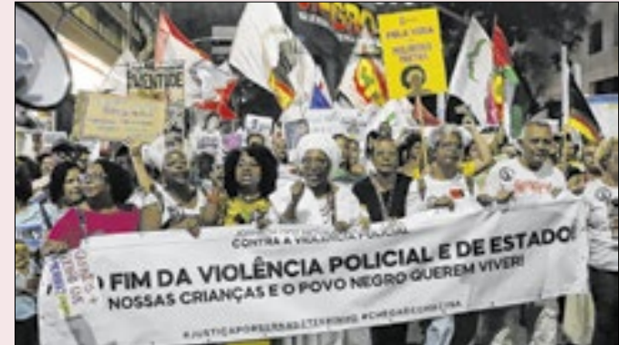
Protesto contra violência policial na Bahia