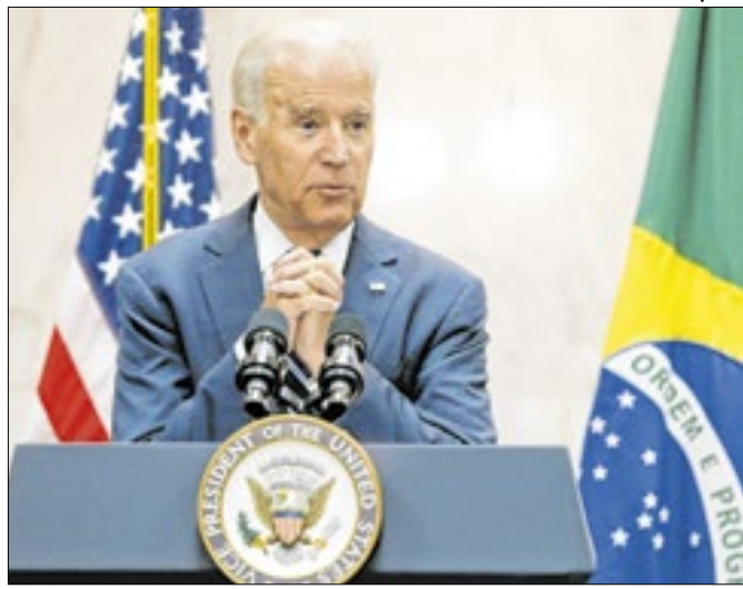
Presidente americano também estará em Manaus