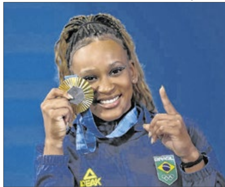
Rebeca Andrade é embaixadora dos Jogos da Juventude

"Estou bem ansiosa para encontrar essa garotada, para celebrar esse momento que é tão importante e especial. E não só para eles, mas para mim também. Esses meninos e meninas são o futuro do nosso esporte, podem estar representando o nosso país em Mundiais, Jogos Olímpicos da Juventude, Pan-Americanos, Olimpíadas nos próximos anos. Que eles aproveitem muito todas as oportunidades, todos os momentos,