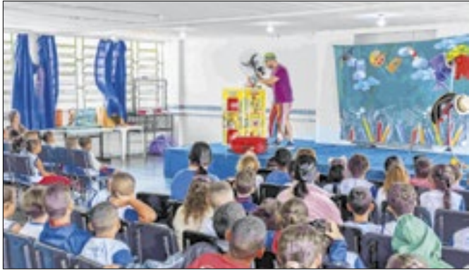
Contaço de histórias na escola Belkis Frony Morgado