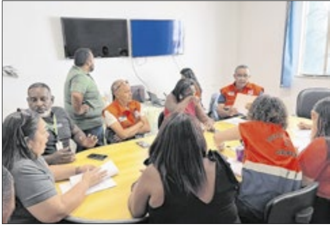
Reunião discute estratégias e define próximos passos