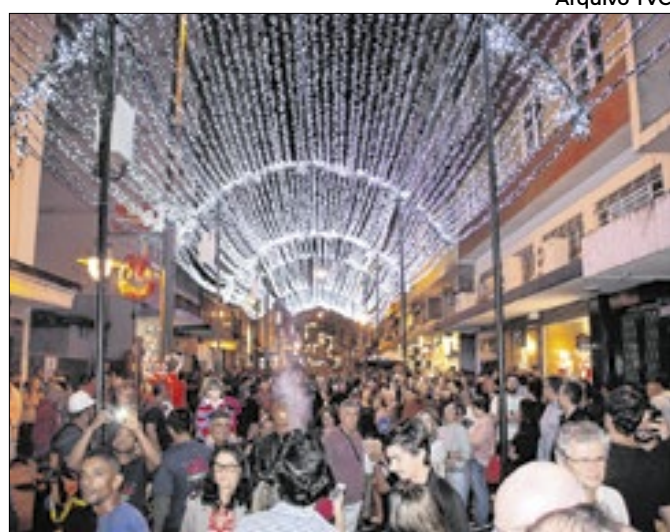
Evento é um dos principais atrativos para turistas