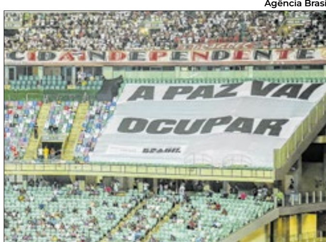
Ministério do Esporte quer promover a paz no futebol

No jogo Bahia e São Paulo, 384 cadeiras ficaram vazias no setor Sudoeste da Arena Fonte Nova, nas quais foram colocadas camisas de diferentes times, na intenção de representar as pessoas que perderam a vida por conta da violência no futebol entre 1988 e 2023.