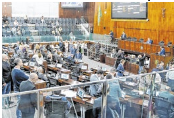
Assembleia aprova Projeto de Lei

De acordo com o texto, os municípios com mais de 20 mil habitantes ficarão condicionados a elaborar e revisar seus Planos Municipais de Arborização Urbana — com diretrizes voltadas ao conforto ambien-