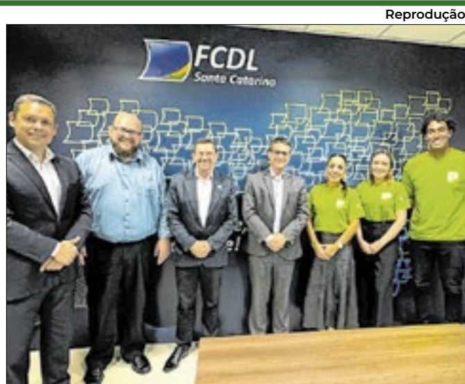
Ação teve parceria com a FCDL/SC