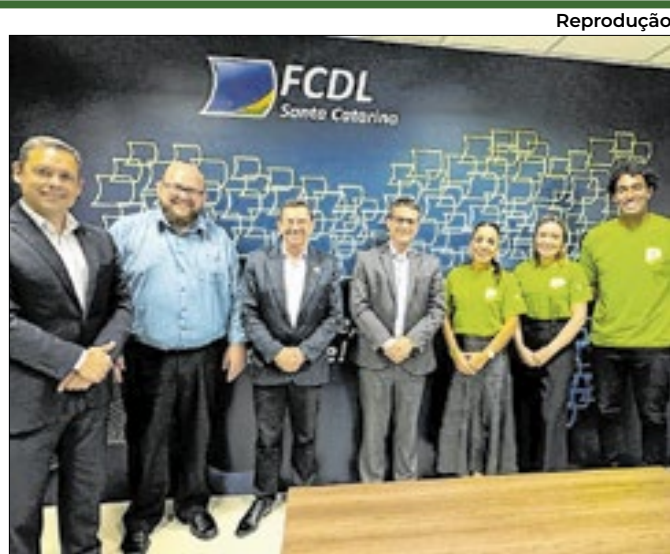
Ação teve parceria com a FCDL/SC